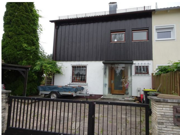
Nordwestseite, Zugang Wohnhaus