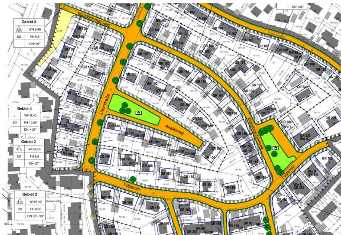
Auszug aus dem Bebauungsplan, ohne Maßstab