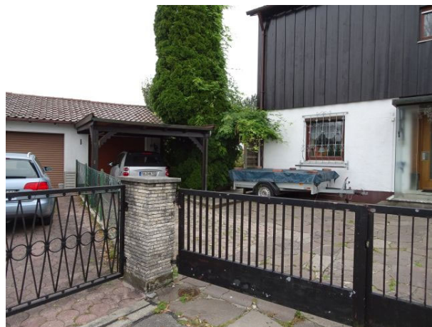
Nordwestseite, Zufahrt Garage