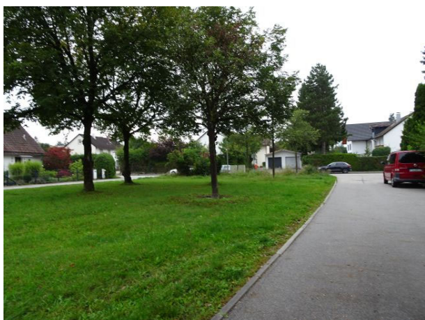
Akeleiweg, öffentliche Grünfläche