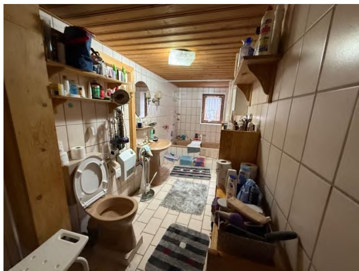
Bad mit WC (EG)