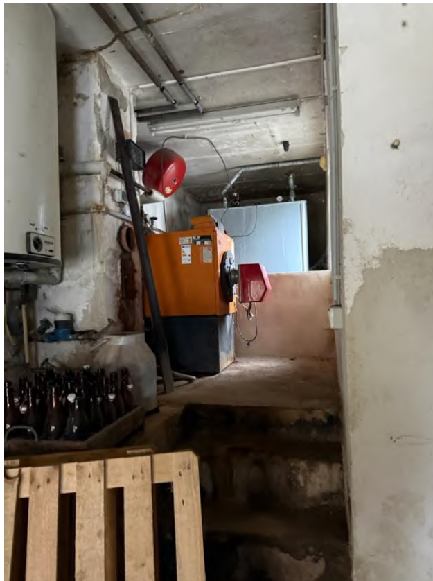
Heizung mit altem Stahltank zur Ölbevorratung