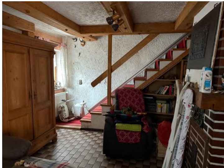
Wohnen (EG) mit Treppe zum OG