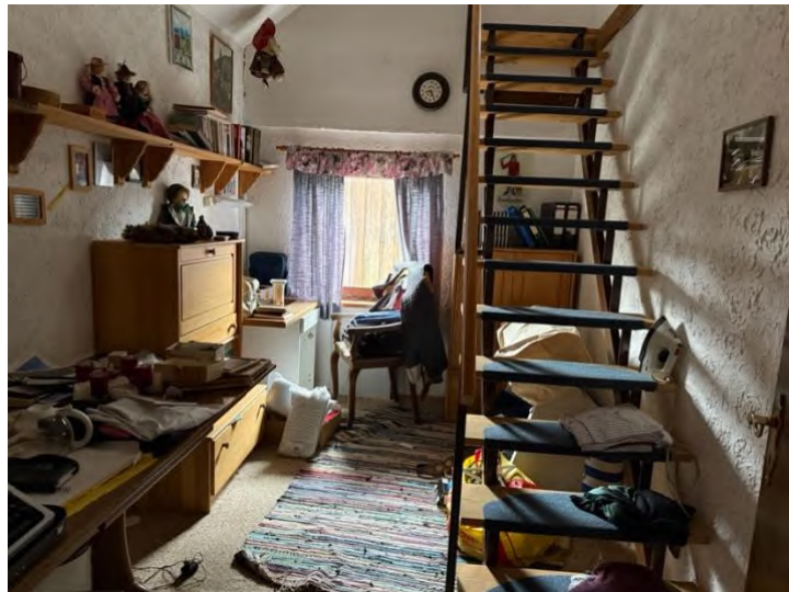
Zimmer (OG) mit Treppe zum Dachspitz