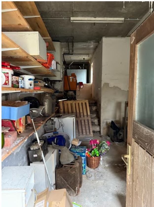
Anbau (Heiz- und Lagerraum) auf fremden Grundstück