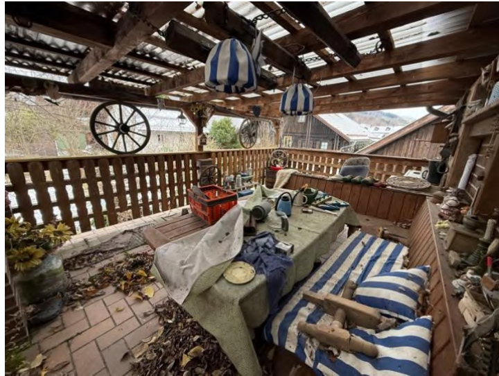
Dachterrasse (OG) auf überbautem Gebäudeteil