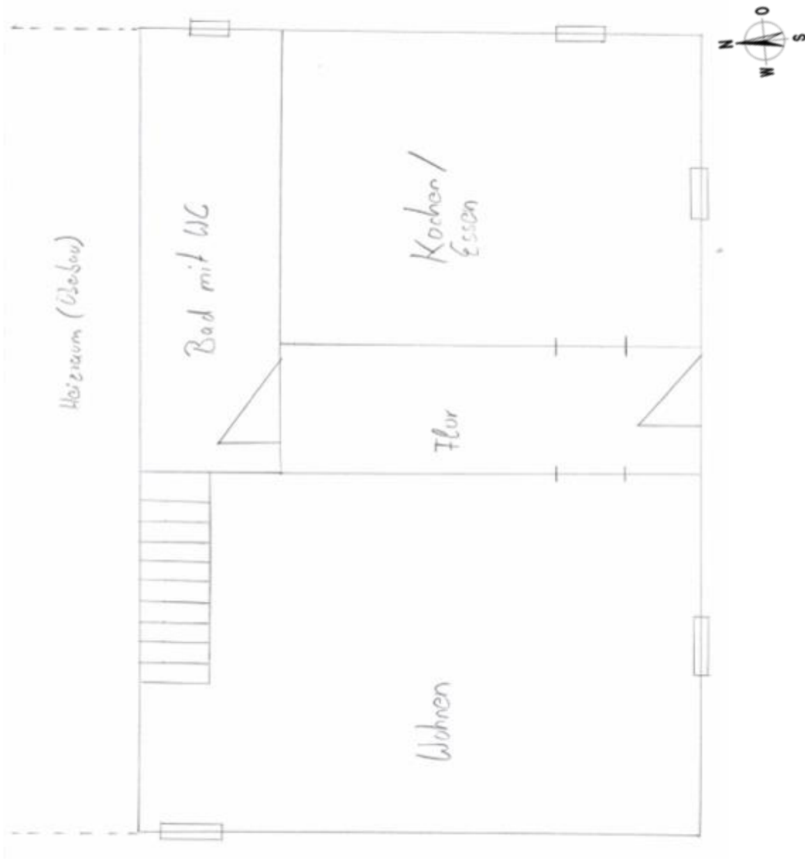
Grundrisskizze Erdgeschoss (ohne Maßstab)