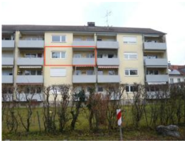
Ansicht v. Südwesten

Nutzung: Nach Angabe gewerbliche Fremdvermietung als Ferienwohnung. Hausgeld: Monatlich zum Stichtag 202 € Rücklagen: Zum 31.12.2023 rd. 639.000 € Energieausweis: Endenergiebedarf Energieeffizienzklasse 124 kWh/m 2 D