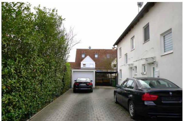
Zufahrt Blick Richtung Osten Entlang nördlicher Grundstücksgrenze