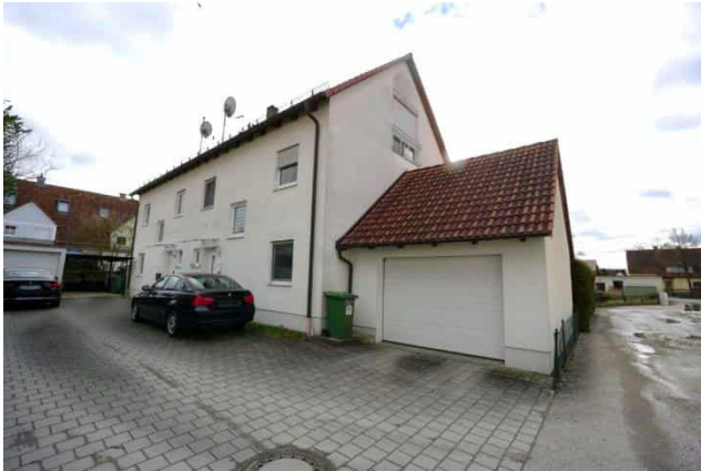
Wohnhaus mit Garage Nordwestansicht