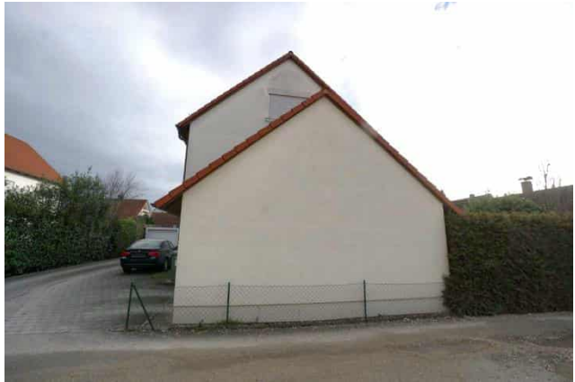
Wohnhaus mit Garage Westansicht