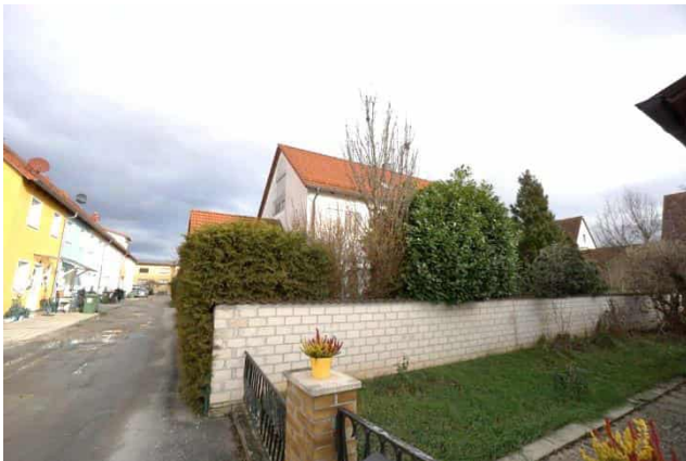
Wohnhaus mit Garage Südwestansicht