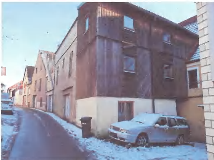
holzverschaltes Rückgebäude und Zufahrt an der Mühlgasse