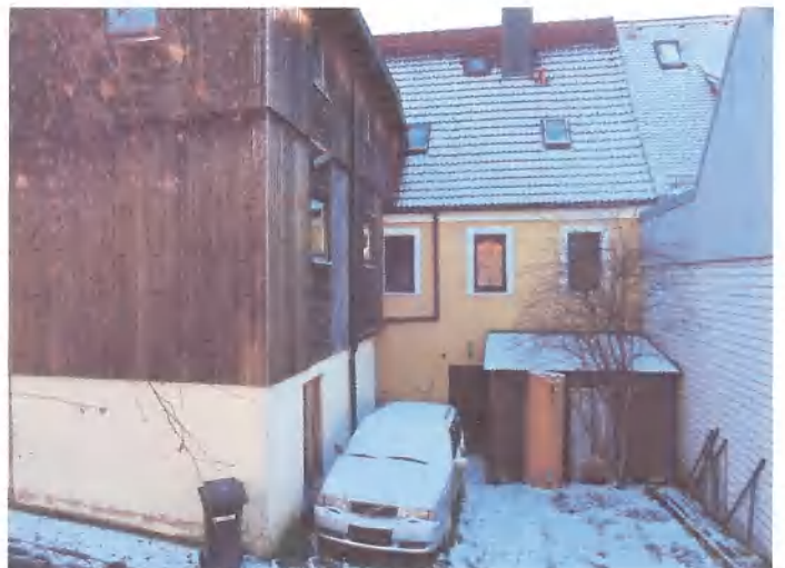
nordseitiger Hof mit Einfahrt

Ausdrücklicher Hinweis: keine Gewähr für Richtigkeit und Vollständigkeit der Angaben