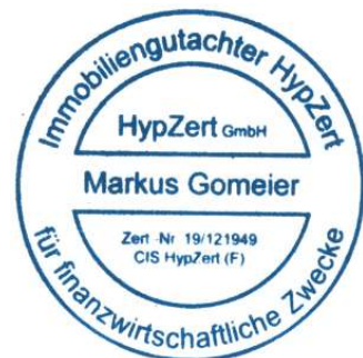
Markus Gomeier MRICS

Die Stellungnahme wurde unparteiisch, ohne Rücksicht auf ungewöhnliche oder persönliche Verhältnisse und ohne eigenes Interesse am Ergebnis nach bestem Wissen und Gewissen erstellt. Urnehmerschutz, alle Rechte vorbehalten. Die Stellungnahme ist nur für den Auftraggeber und den angegebenen Zweck bestimmt. Eine Vervielfältigung oder Verwertung durch Dritte ist nur mit schriftlicher Genehmigung gestattet.