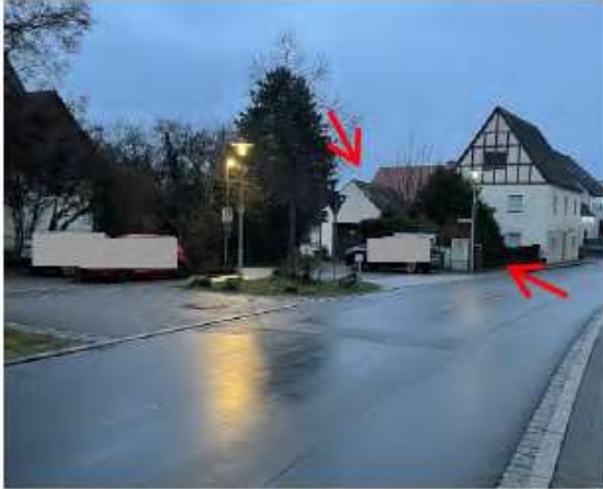
Blick entlang der Atzelsberger Straße zum Bewertungsobjekt