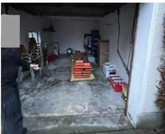
Innenansicht der Garage