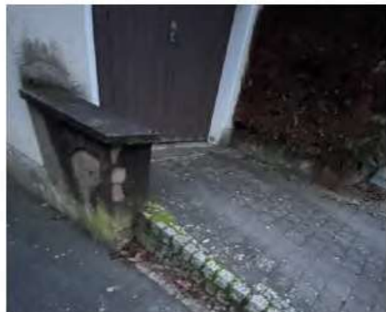
Beispiel baulicher Auffälligkeiten