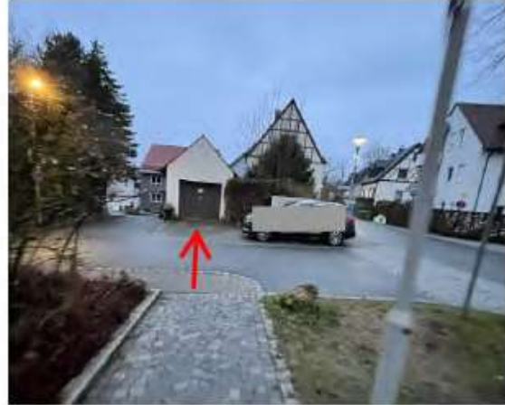
Blick von Südosten auf das Garagengebäude auf Flst 58/9