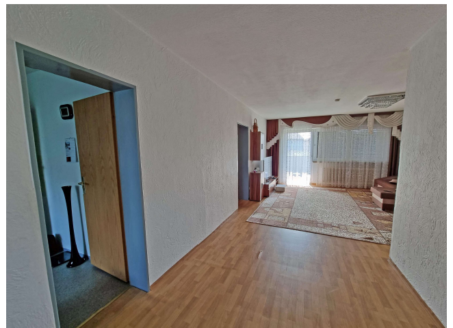
Küche ... Wohnung Nr. 1 ... Wohnzimmer Porzellerstr. 33