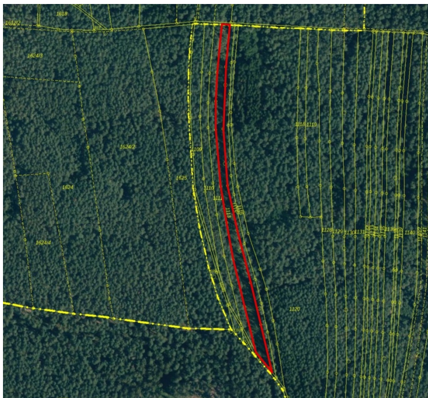
Orthophoto mit Flurkarte im Maßstab 1 : 5.000