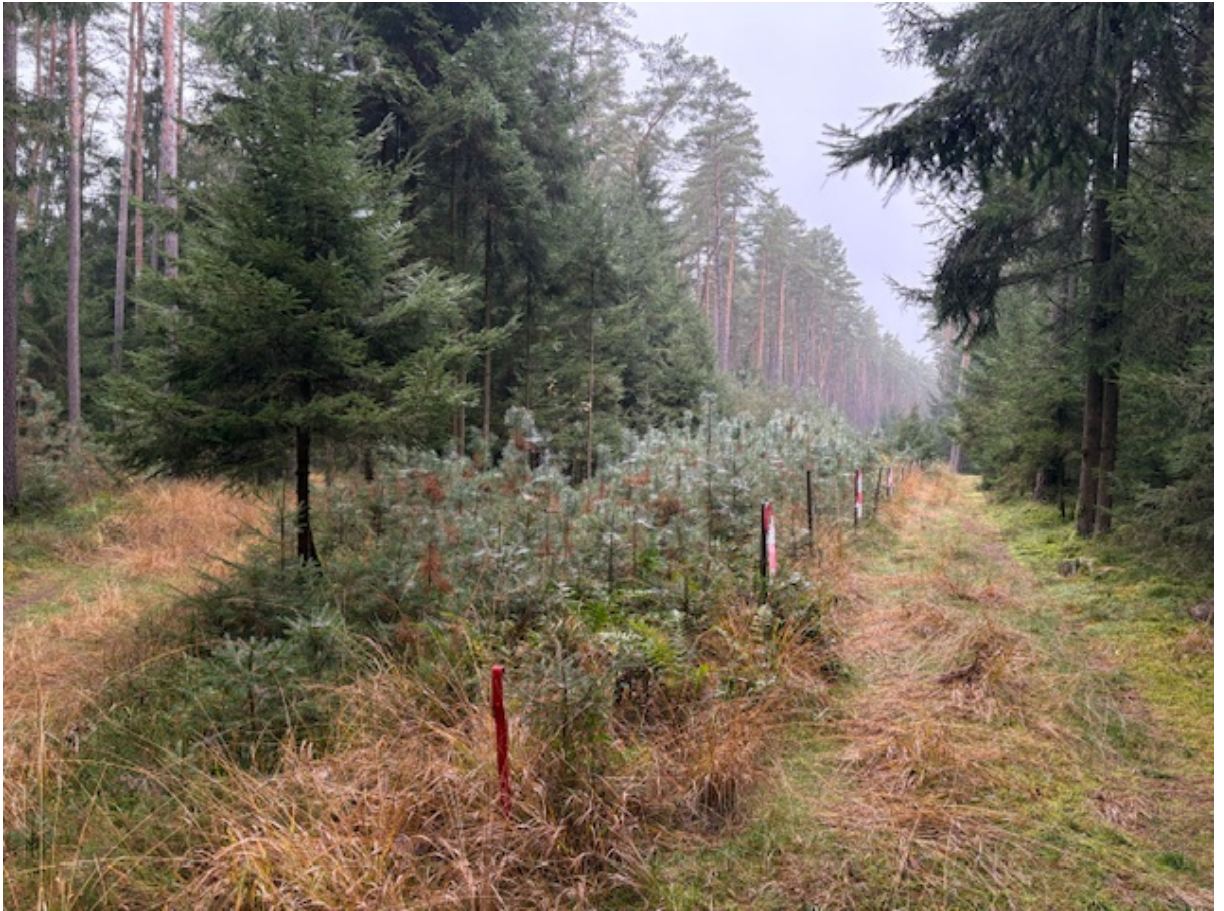
Foto: Blick von der südlichen Grundstücksgrenze nach Norden; links im Bild Bestand I.1,1, rechts Bestand I.1,2