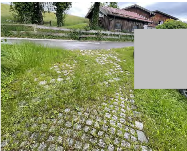
Grundstückszufahrt und Hauszugangsbereich