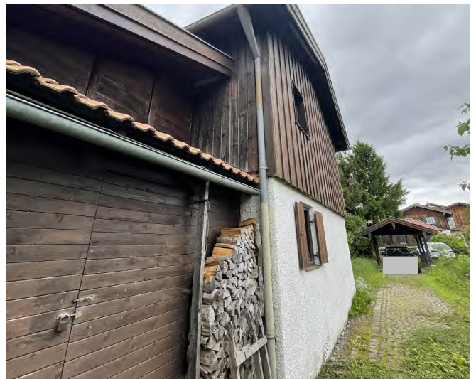
Blick entlang der WH-Fassade Richtung SW, im Hintergrund Carport