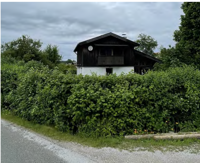
Blick auf das Bewertungsgrundstück Flst 481 aus Richtung SO