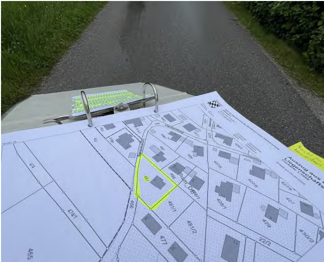
Blick in den Leonhardiweg