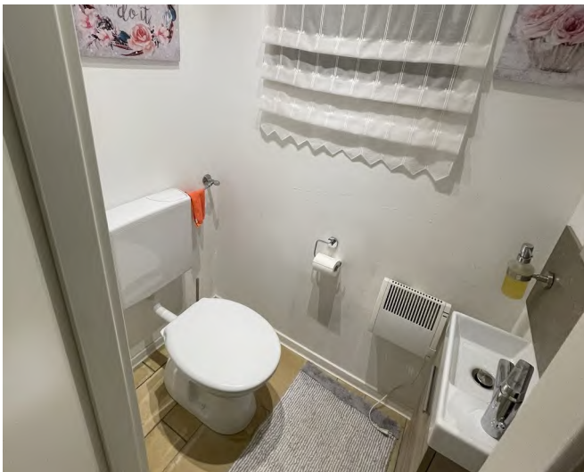
EG: WC mit verschlossener ursprgl. Fensteröffnung aufgrund Anschluss WH-Anbau