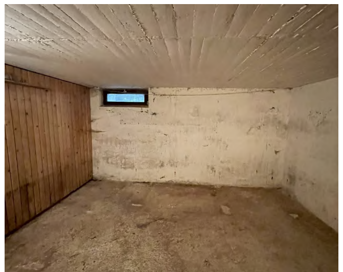
Eindruck der Kellerräume