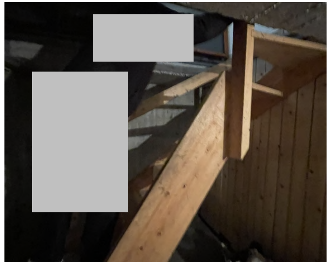
Bodenluke vom ursprgl. Hauseingang aus, Zugang in das KG über einfache Holzstiege