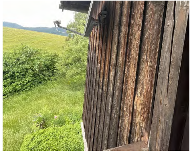
Balkon OG , Zustand Holzbauteile beispielhaft