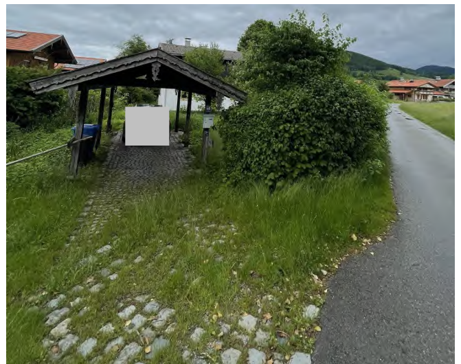
mit Carport im Grundstücksbereich NW