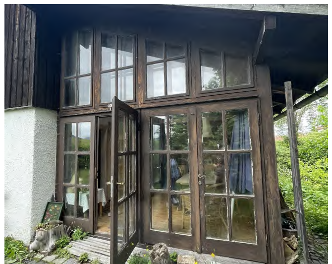
Teil der WH-Fassade SO, Ursprungsbau und WH-Anbau mit Hauseingang