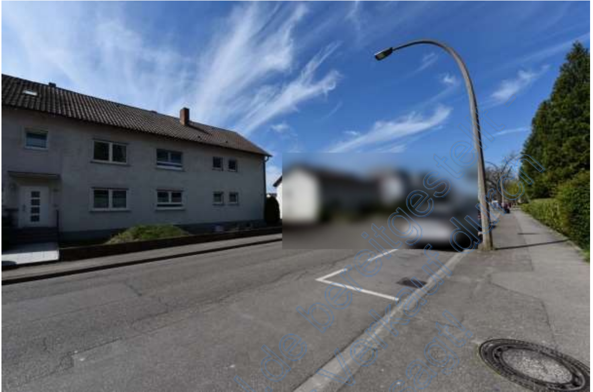
Abb. 17 Wohnumgebung Grüngärtenweg