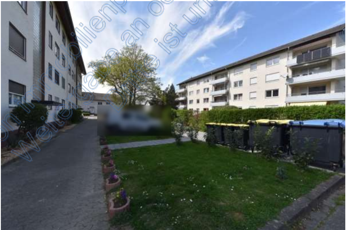
Abb. 18 Wohnumgebung Grüngärtenweg, Stellplätze