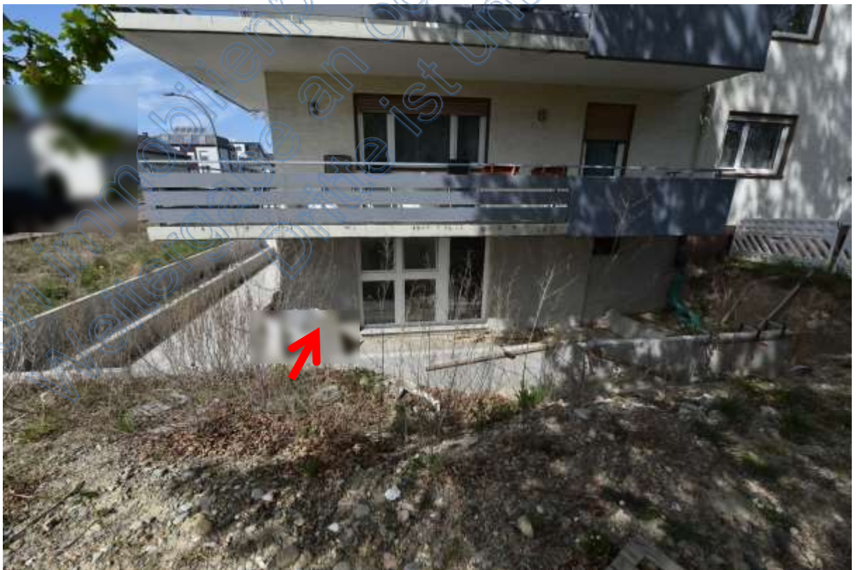
Abb. 26 Lage der Wohnung Nr. 10 (Pfeil) im KG