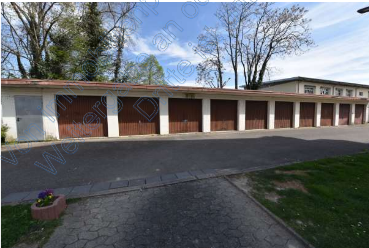
Abb. 28 Lage der Garagen