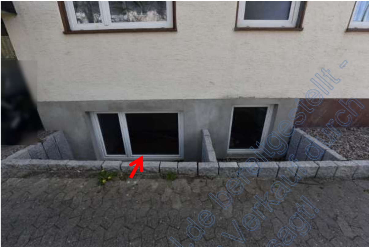
Abb. 23 Lage der Wohnung Nr. 10 (Pfeil) im KG