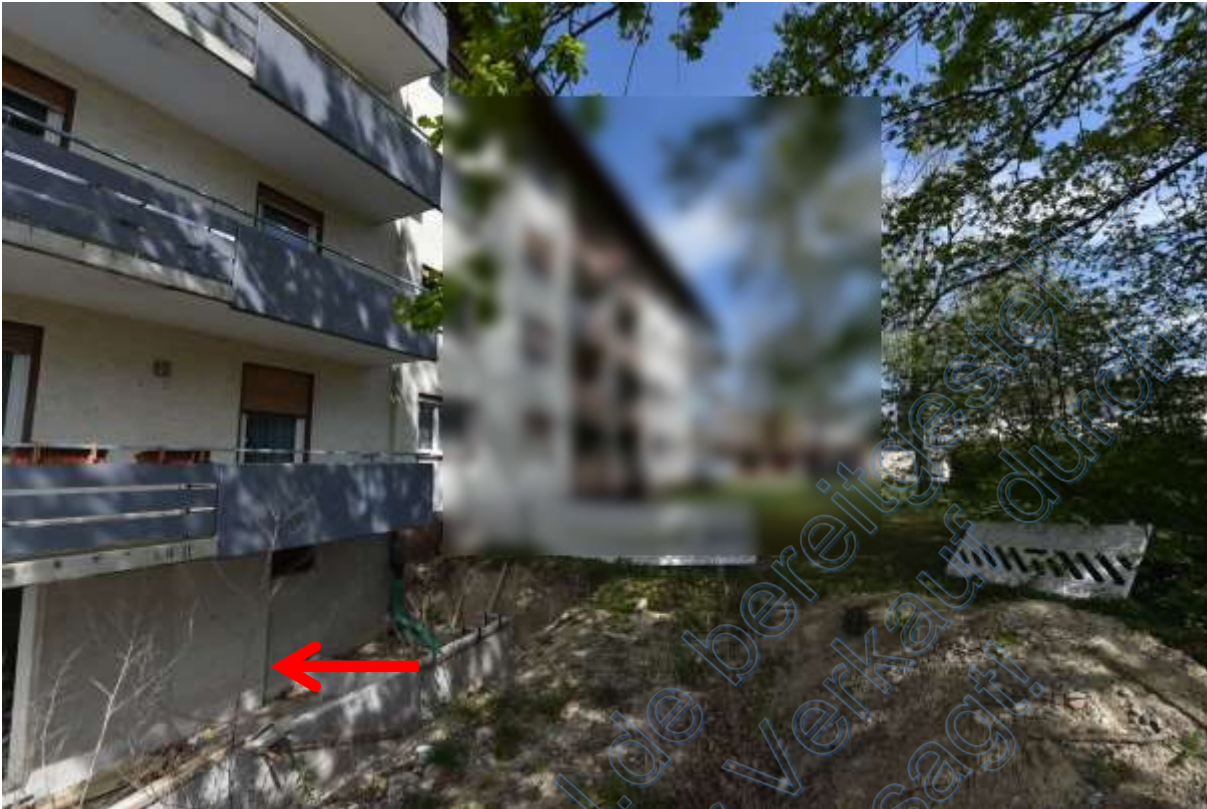
Abb. 27 Lage der Wohnung Nr. 10 (Pfeil) im KG