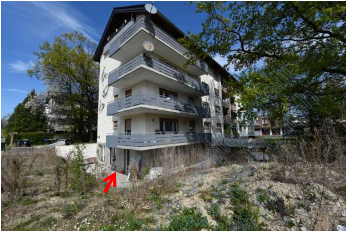
Abb. 25 Lage der Wohnung Nr. 10 (Pfeil) im KG