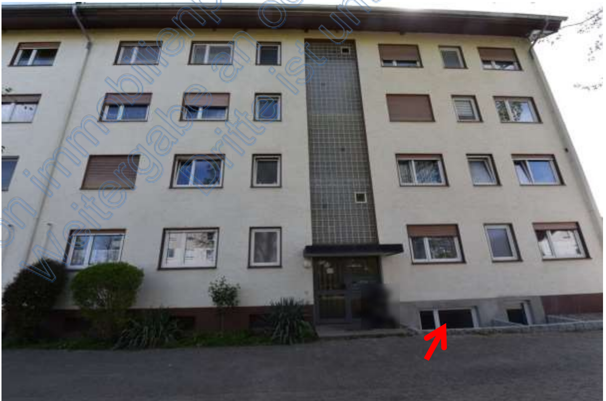
Abb. 22 Gebäudeansicht, Lage der Wohnung Nr. 10 (Pfeil) im KG