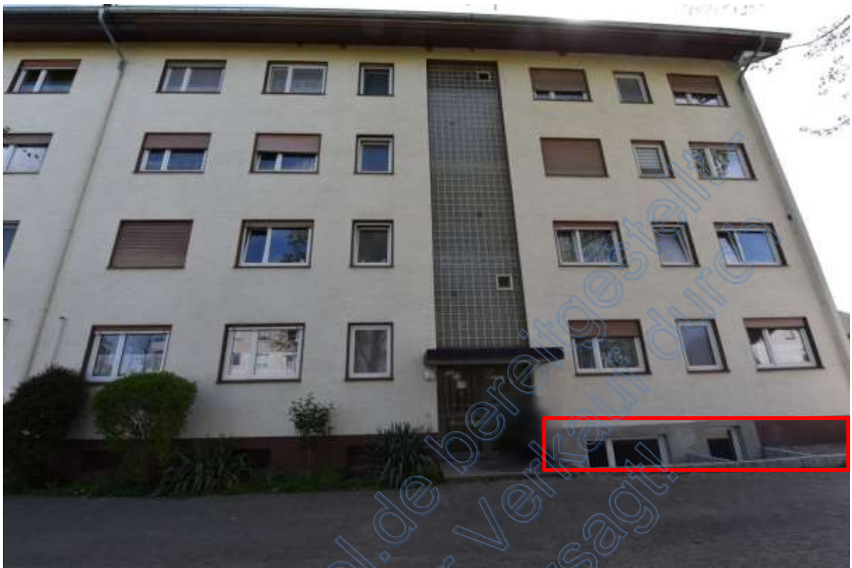
Abb. 1 Lage des Bewertungsobjekts, ETW Nr. 10, KG rechts (rot gerahmt)

Das Objekt konnte nicht besichtigt werden!