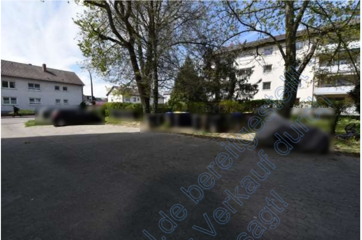
Abb. 21 Wohnumgebung Grüngärtenweg, Stellplätze