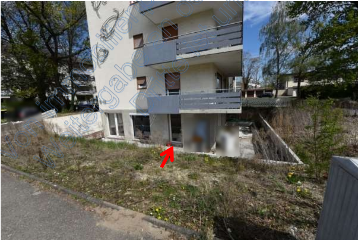
Abb. 24 Lage der Wohnung Nr. 10 (Pfeil) im KG