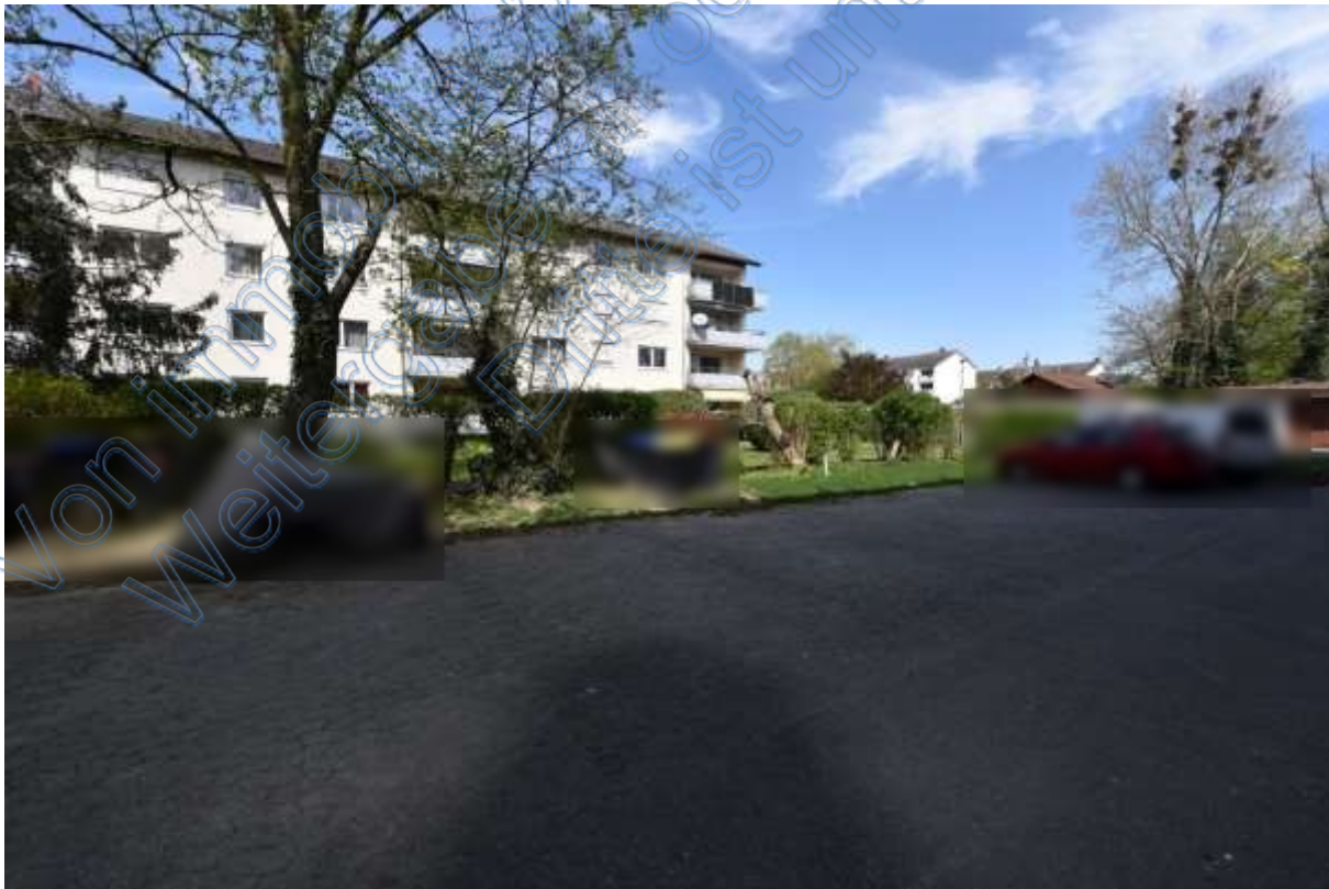
Abb. 20 Wohnumgebung Grüngärtenweg, Stellplätze