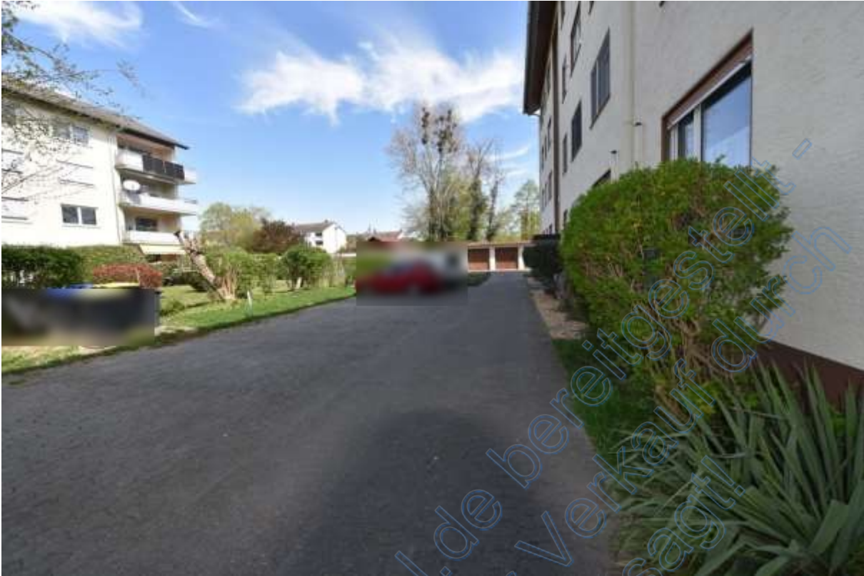
Abb. 19 Wohnumgebung Grüngärtenweg, Stellplätze und Garagen