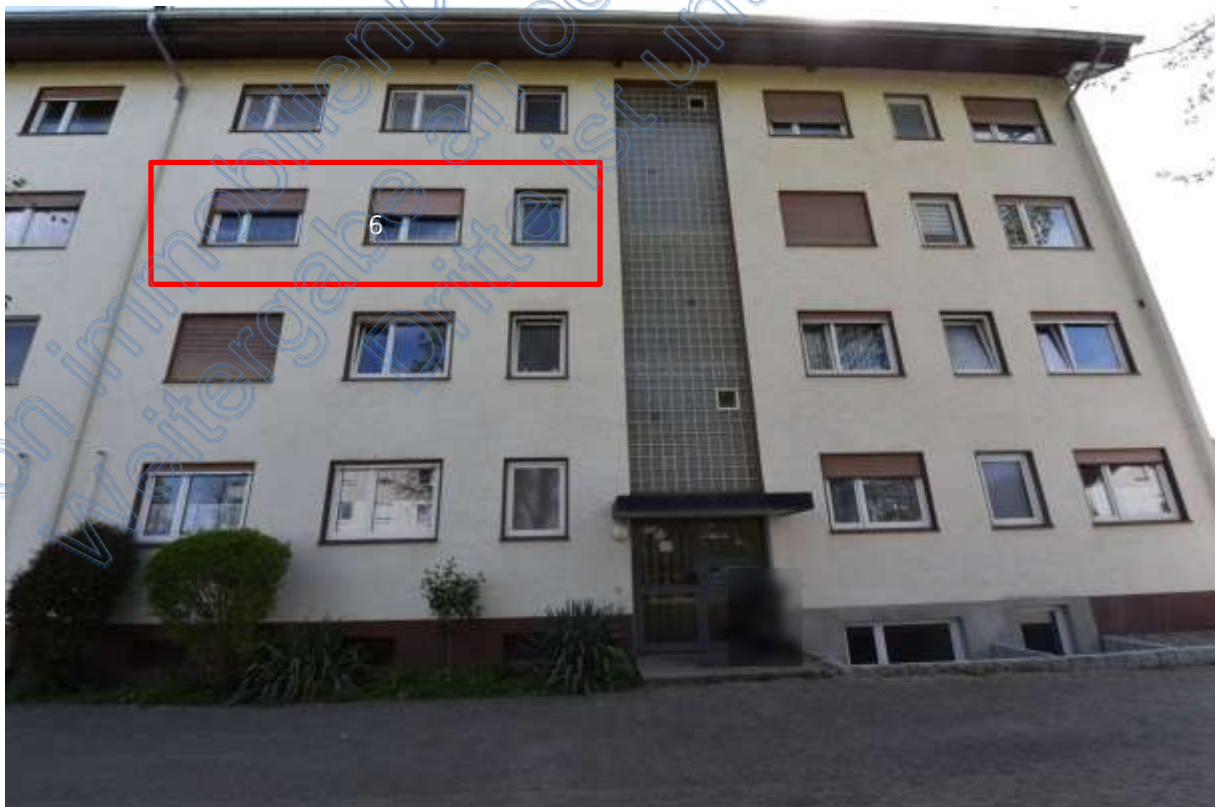
Abb. 23 Gebäudeansicht, Lage der Wohnung Nr. 6 im 2. OG links (roter Rahmen)