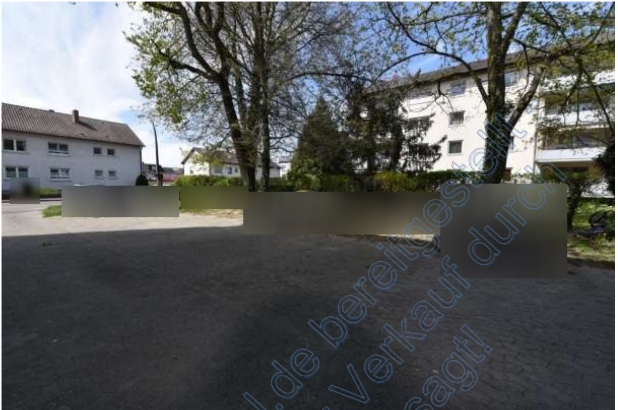
Abb. 22 Wohnumgebung Grüngärtenweg, Stellplätze