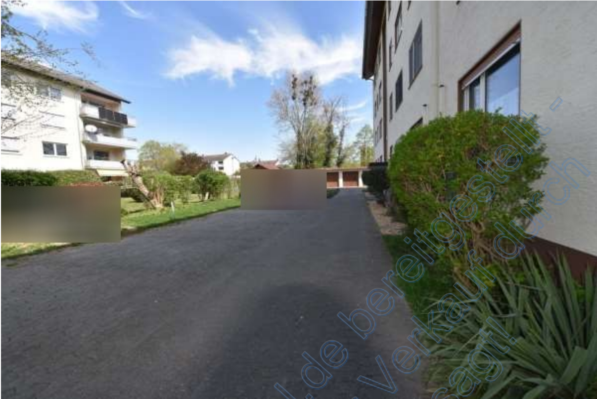
Abb. 20 Wohnumgebung Grüngärtenweg, Stellplätze und Garagen