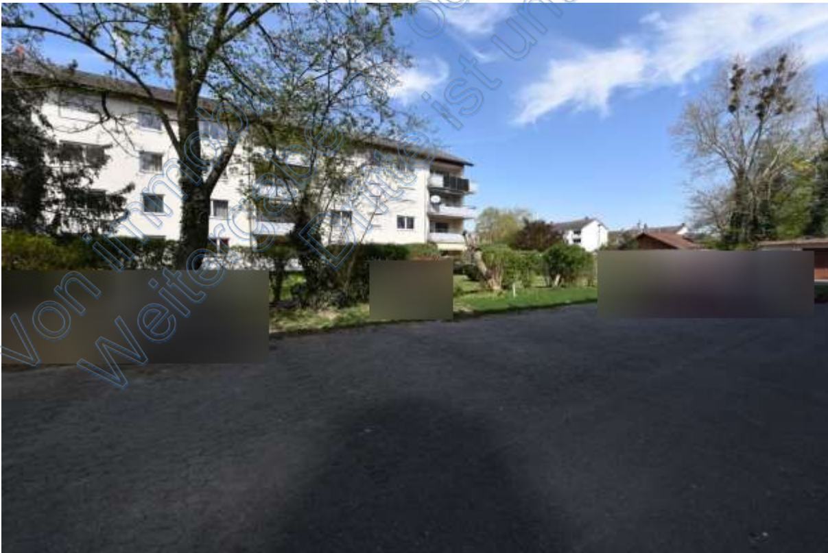
Abb. 21 Wohnumgebung Grüngärtenweg, Stellplätze