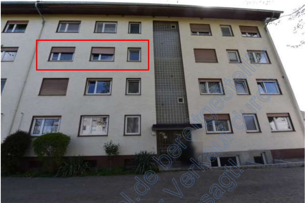
Abb. 1 Lage des Bewertungsobjekts, ETW Nr. 6, 2. OG links (rot gerahmt)

Das Objekt konnte nicht besichtigt werden!