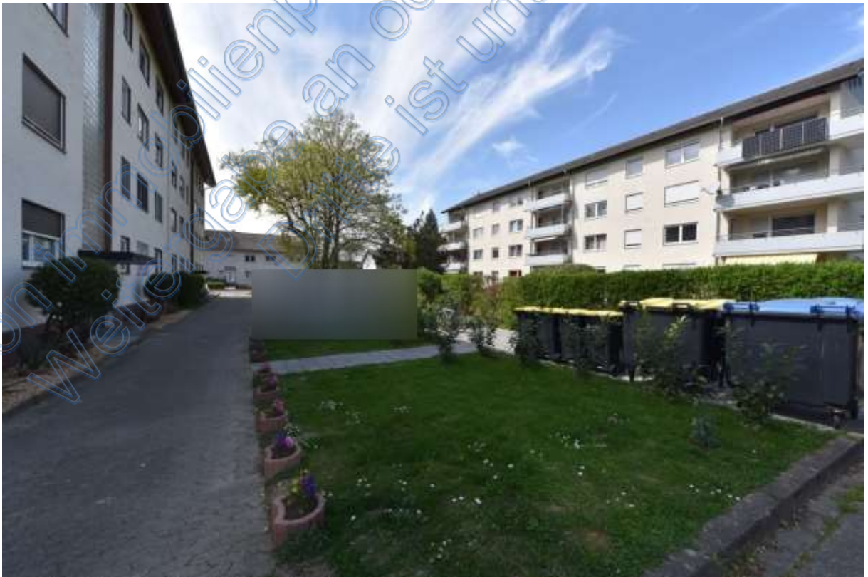
Abb. 19 Wohnumgebung Grüngärtenweg, Stellplätze