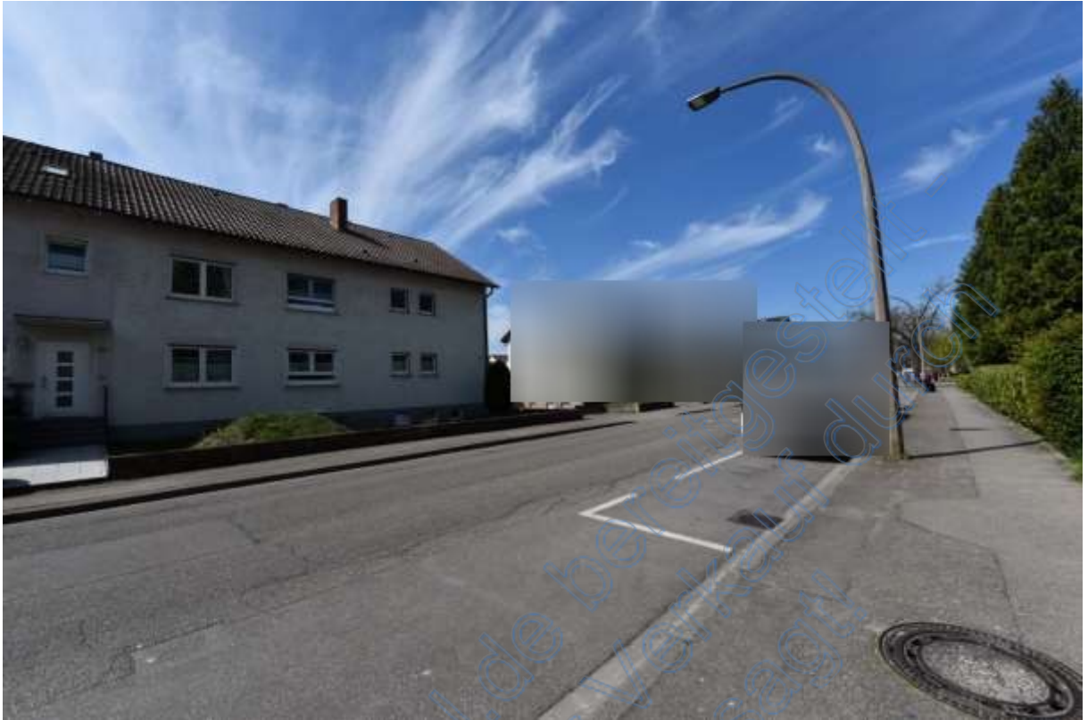
Abb. 18 Wohnumgebung Grüngärtenweg