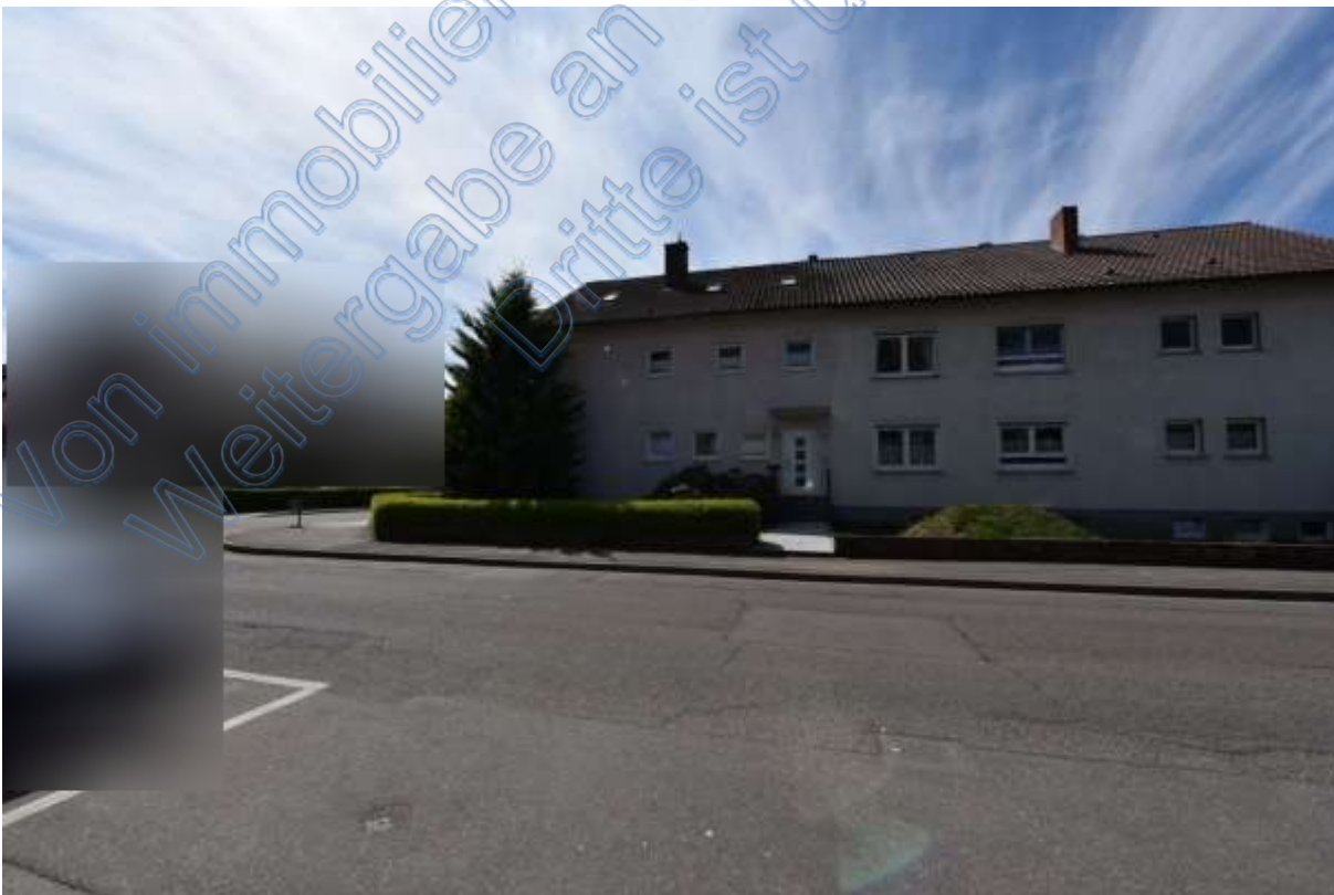
Abb. 17 Wohnumgebung Grüngärtenweg