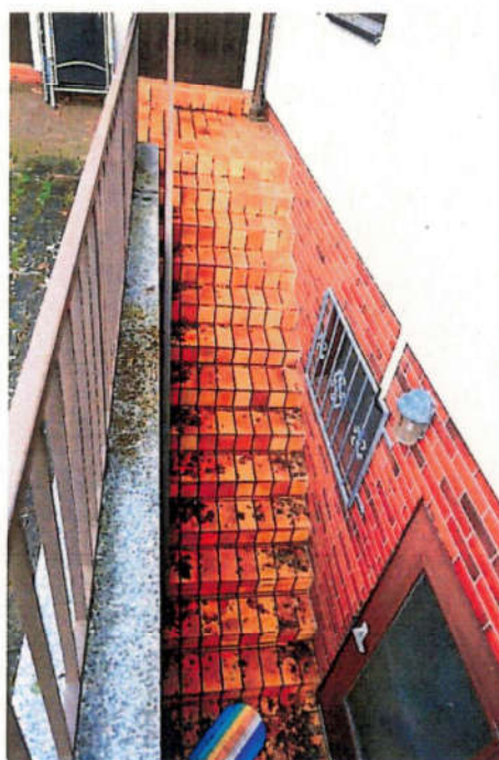
Das Untergeschoss ist zusätzlich über eine Außentreppe zugänglich.