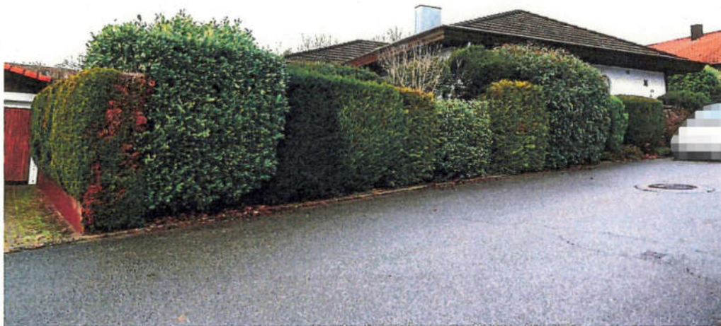
Das Grundstück ist durch eine Hecke kaum einsehbar.