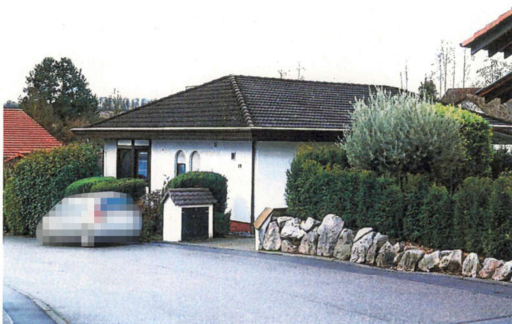
Blick auf das Bewertungsobjekt von Nordosten.