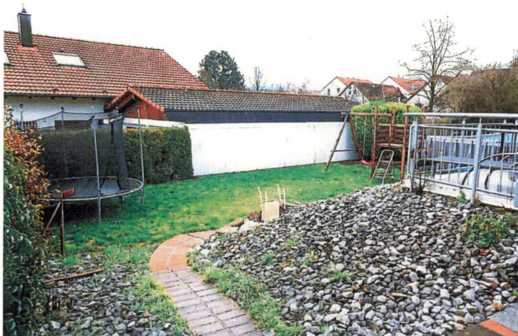
Blick auf einen Teil der rückwärtigen Teilflächen.