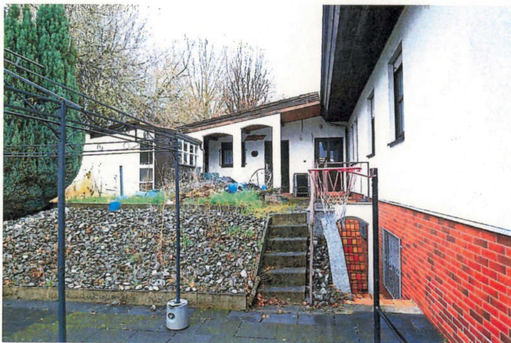
Blick auf einen Teil der Garage und der westlichen Anbauten. Für die Anbauten liegen keine Baugenehmigungen vor.