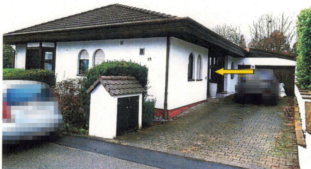
Blick auf das Bewertungsobjekt mit Zufahrt zur Garage bzw. Zuwegung zum Hauseingang (gelber Pfeil).