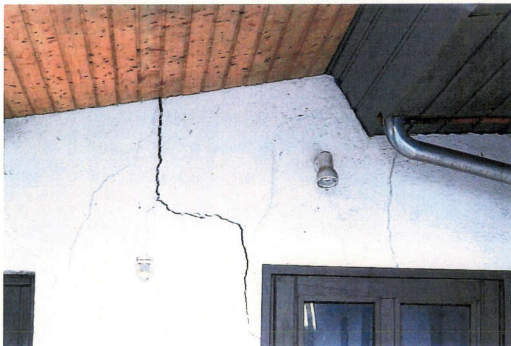
An der südlichen Außenfassade der Garage sind Rissbildungen sichtbar.