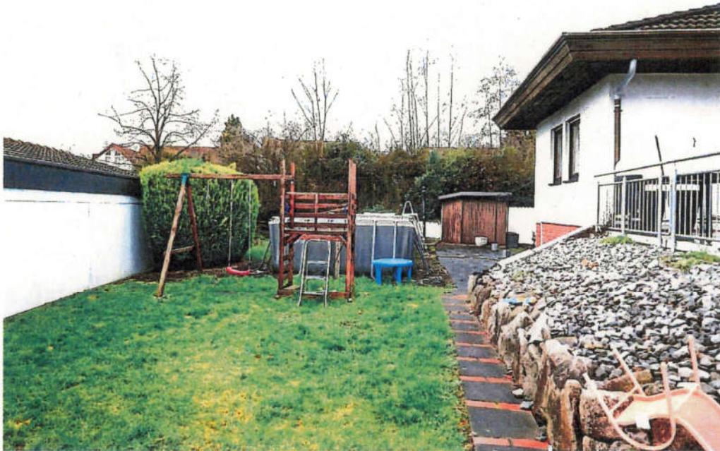
Sicht auf die südliche Freifläche mit Kinderspielplatz und Außenpool.