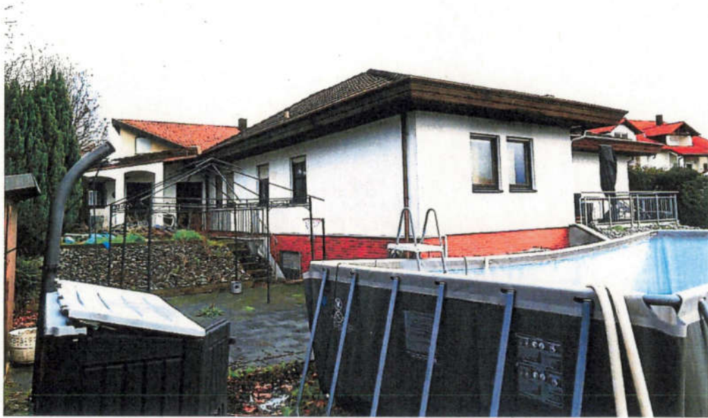
Gebäudeansicht von Südwesten mit Pool im Vordergrund.