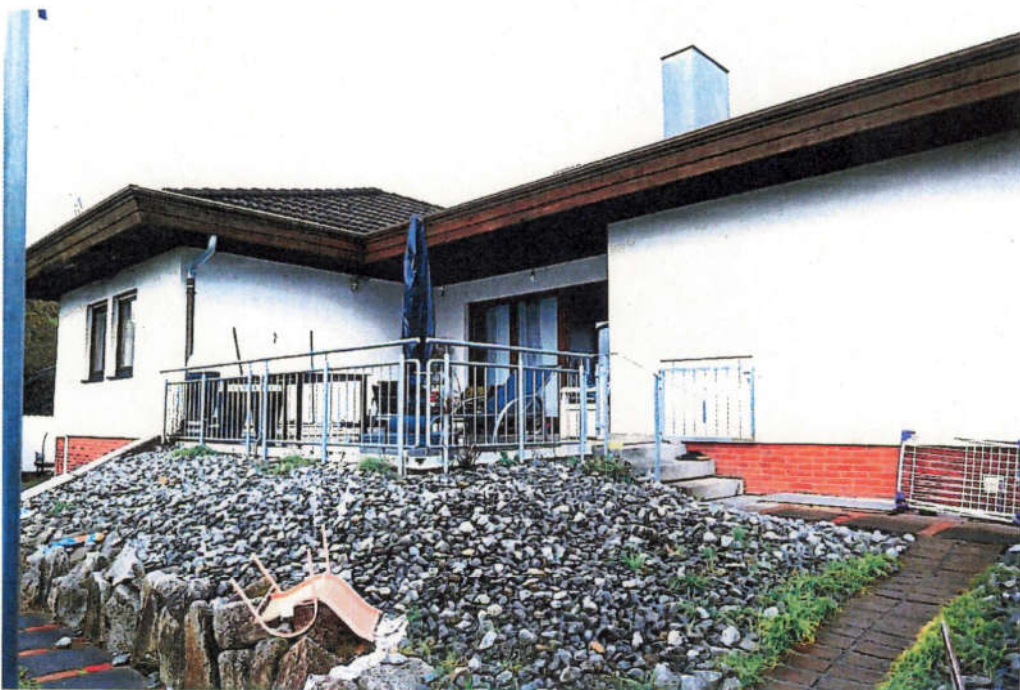
Blick auf die südliche Gebäudeseite mit Terrasse.