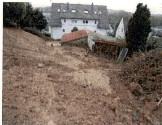
Ansicht von Westen