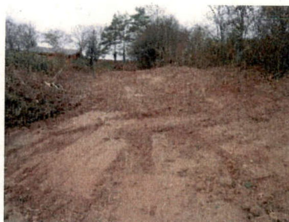
Ansicht von Osten