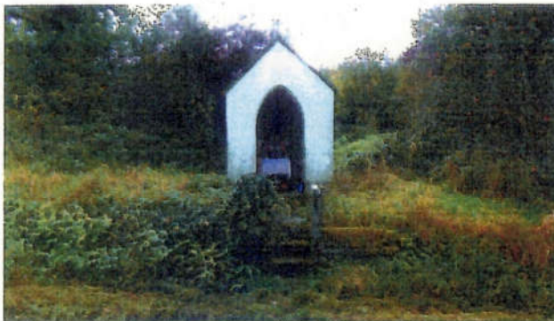
Ansicht aus Nordwesten