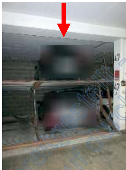
Doppelparkplatz Nr. 47