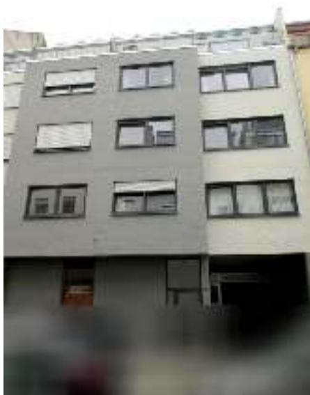
Straßenansicht S 6, 12