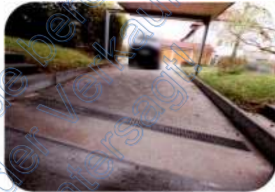
Carport im Anschluss an Garage

Von immobilienpool.de bereitgestellt - Weitergabe an oder Verkauf durch Dritte ist untersagt