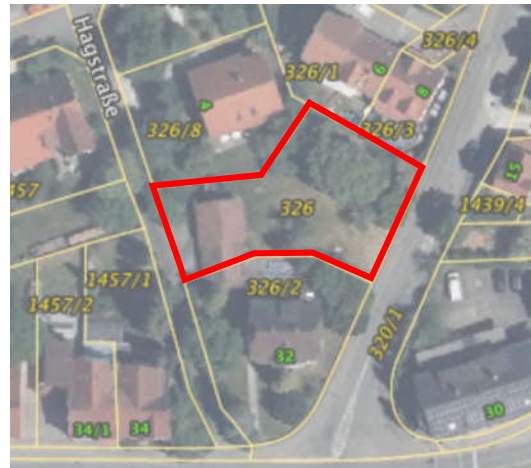
Verkleinerungen, Darstellungen nicht maßstabsgerecht!