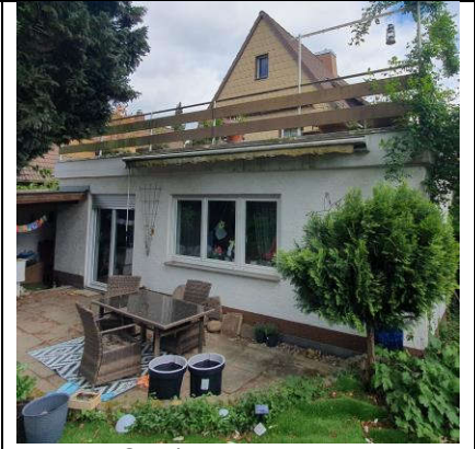
Ansicht Süd/West mit Anbau