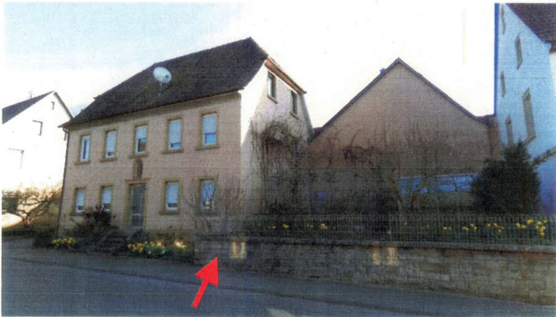
Bild 1: Außenansichten Gebäude und Grundstück (ff.); Wohnhaus links, Gebäude A Mitte