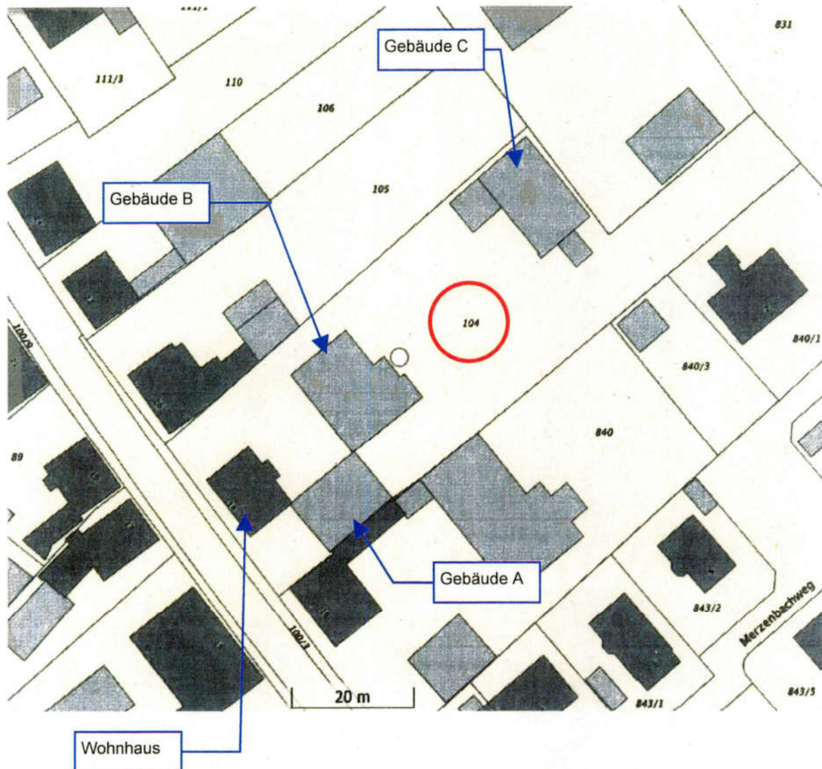
Darstellung der Lage von Wohnhaus und Nebengebäuden