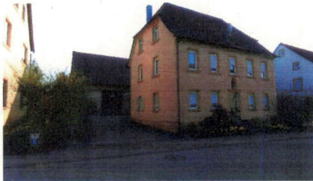
Ansicht aus Westen (Straßenansicht)