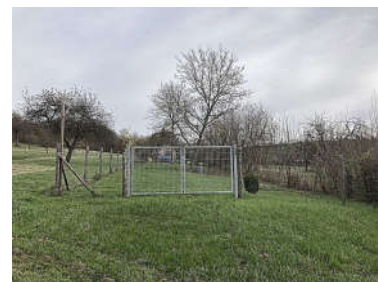
Westl. Zugang mit Toranlage