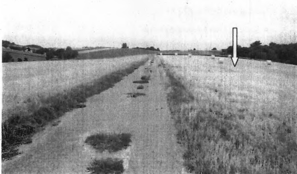
Die zu bewertende Landwirtschaftsfläche ist über angrenzende Feldwege erreichbar. Der gelbe Pfeil zeigt auf das Bewertungsgrundstück.