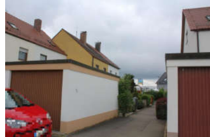
Garage und Zuwegung