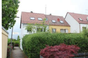
Rückansicht und Zuwegung