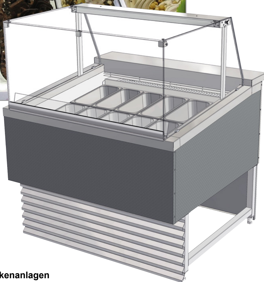
Abbildung mit Eisbehältern (als Sonderzubehör erhältlich).