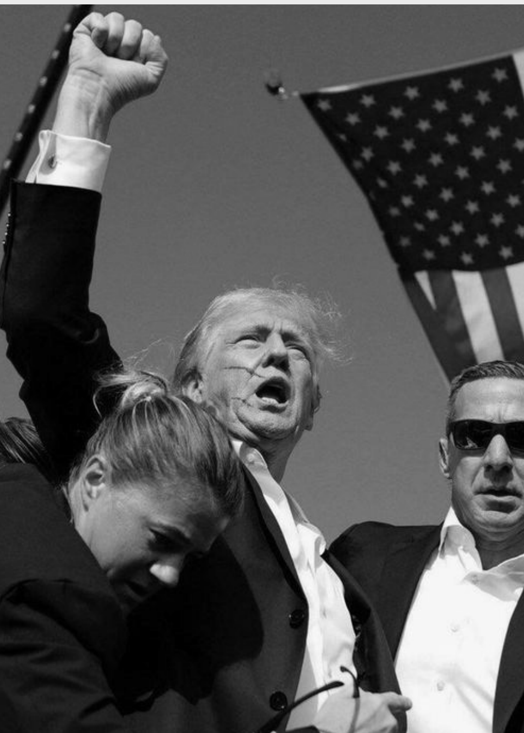
[Tiroteo contra Donald Trump]