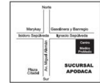
SUCURSAL APODACA APODACA Ignacio Sepúlveda 204 Col. La Encarnación, Apodaca, N.L. Tel. (81) 1766-5353 asistente.apodaca@promedic.com.mx