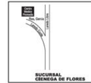
SUCURSAL CIENEGA DE FLORES CIENEGA Autopista Monterrey-Laredo Km. 25.5 Cienega de Flores, N.L. Tel. 8340-1447 asistente.cienega@promedic.com.mx