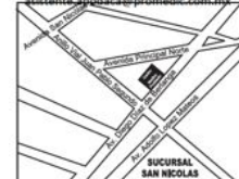
SUCURSAL SAN NICOLAS SAN NICOLAS Av. Diego Díaz de Beltranga 402 Col. Bosques de Anahuac San Nicolás de los Garza, N.L., C.P. 66463 Tel. (81) 2282-9880 asistente.poniente@promedic.com.mx