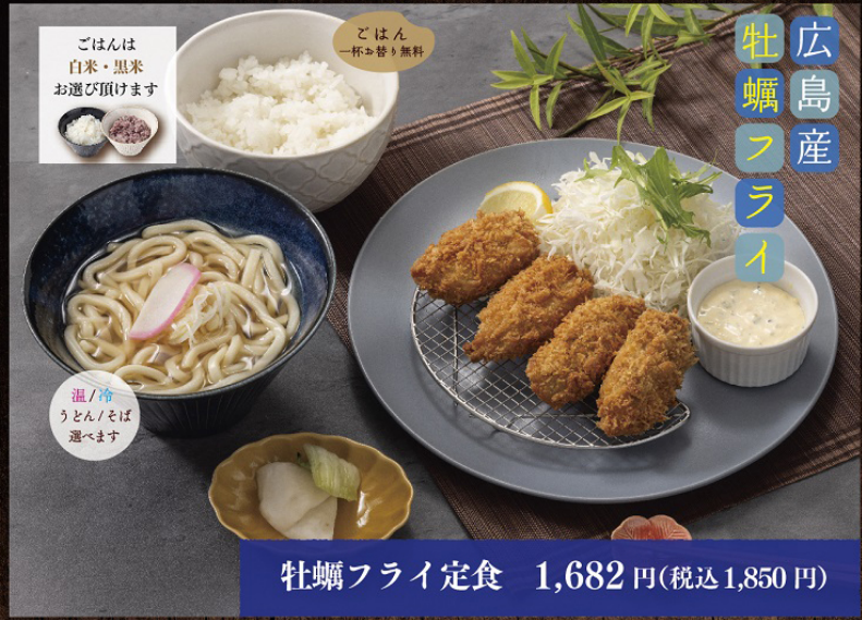
牡蠣フライ定食 1,682円(税込1,850円)