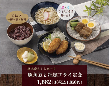
柳本産さくらボーク 豚角煮と牡蠣フライ定食 1,682円(税込1,850円)