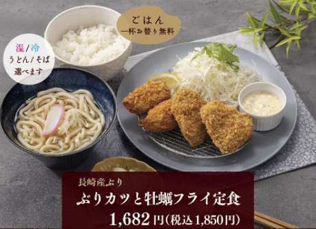
長崎産ぶり ぶりカツと牡蠣フライ定食 1,682円(税込1,850円)