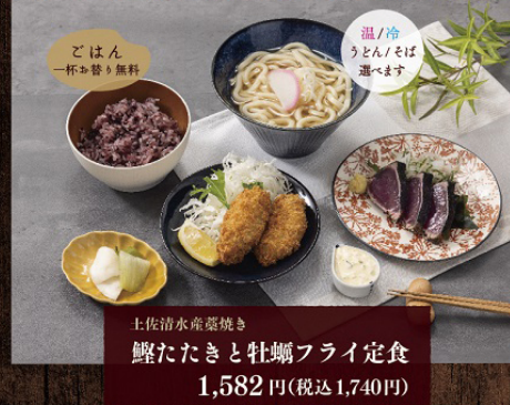
土佐清水産鰯焼き 鱈たたきと牡蠣フライ定食 1,582円(税込1,740円)