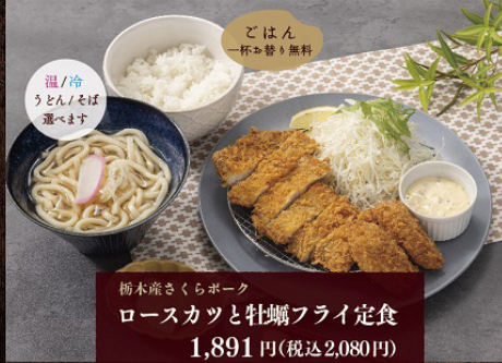
柳本産さくらボーク ロースカツと牡蠣フライ定食 1,891円(税込2,080円)