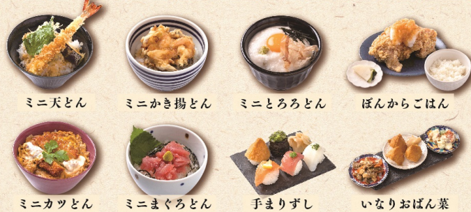
うどんそばと各種セット +482円(税込+530円) 単品の場合は上記価格+100円(税込110円)になります