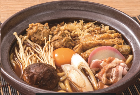
みそ煮込みうどん 1,282円(税込1,410円)