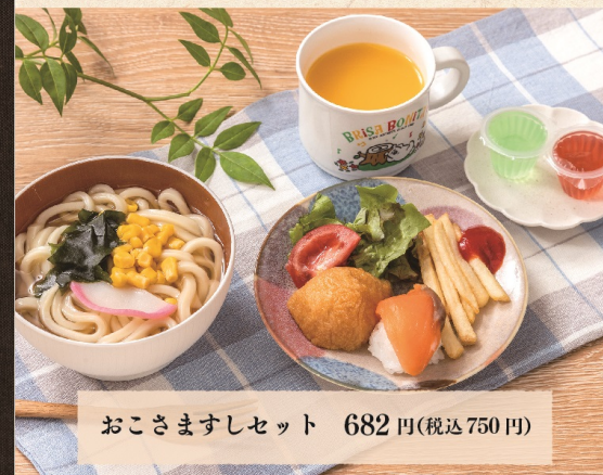
おこさま寿司セット 682 円 (税込 750 円)