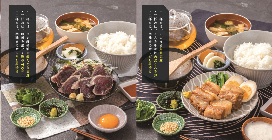
薬焼き鰹たたきのひつまぶし定食 1,782円(税込1,960円)

一杯めは、そのまま角煮定食 二杯めは、とろろをかけ角煮とろろ丼 三杯めは、薬味をのせてだし茶漬け