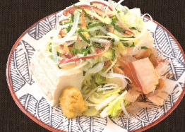
たっぷり薬味の冷奴 382 円 (税込 420 円)