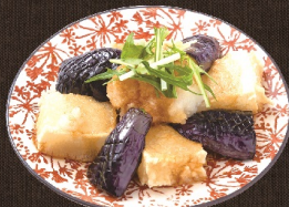
餅と茄子の揚げ出し 482 円 (税込 530 円)