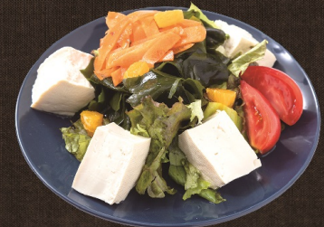
豆腐とわかめのサラダ 482 円 (税込 530 円) ハーフサイズ 291 円 (税込 320 円)