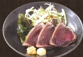
鯉たたき 682 円 (税込 750 円)