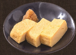
出し巻き玉子 382 円 (税込 420 円)