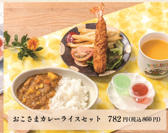
おこさまカレーライスセット 782 円 (税込 860 円)