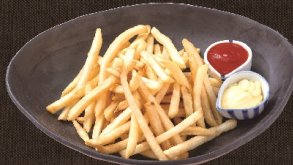
ポテトフライ 482 円 (税込 530 円)