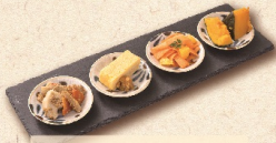
おばん菜4種盛 582円(税込640円)