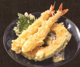
天ぷら 582 円 (税込 640 円)