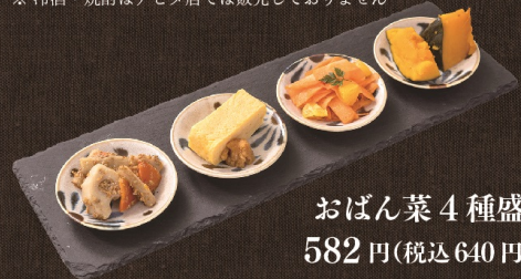
おばん菜 4 種盛 582 円 (税込 640 円)

※ 20 歳未満、車を運転のお客さまにはアルコールの販売は致しません ※ 冷酒・焼酎はアピタ店では販売しておりません