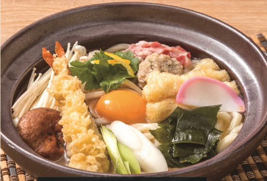
海老天なべ焼きうどん 1,282円(税込1,410円)