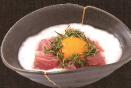
まぐろ山かけ 582 円 (税込 640 円)