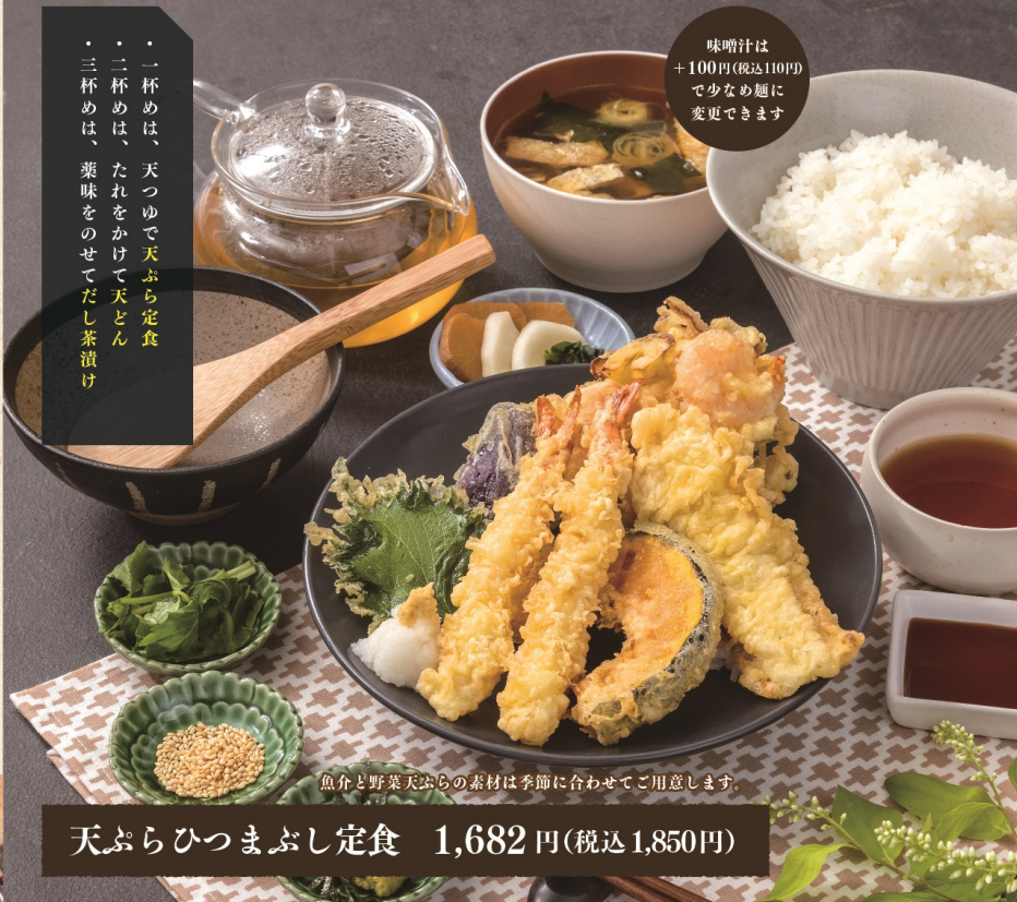
天ぷらひつまぶし定食 1,682円(税込1,850円)