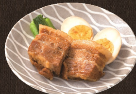
豚角煮 682 円 (税込 750 円)