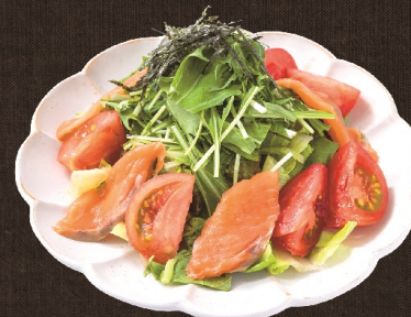
サーモンサラダ 764 円 (税込 840 円) ハーフサイズ 391 円 (税込 430 円)