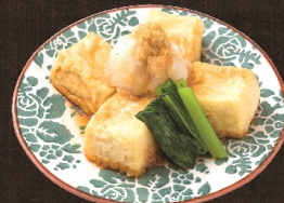
揚げだし豆腐 482 円 (税込 530 円)