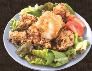
ぼんから 864 円 (税込 950 円) ハーフサイズ 482 円 (税込 530 円) から揚げ (6コ) 782 円 (税込 860 円)