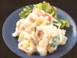
ポテトサラダ 382 円 (税込 420 円)