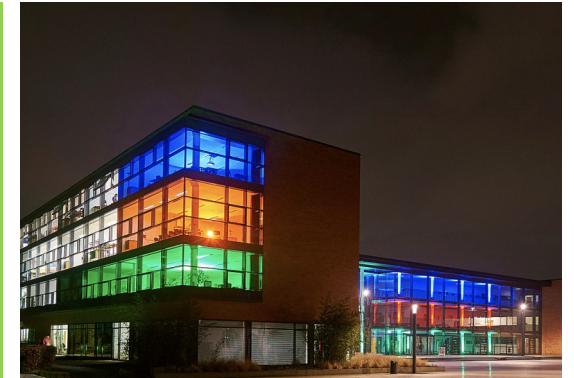
Berufskolleg St. Michael Ahlen