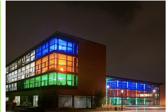
Berufskolleg St. Michael Ahlen