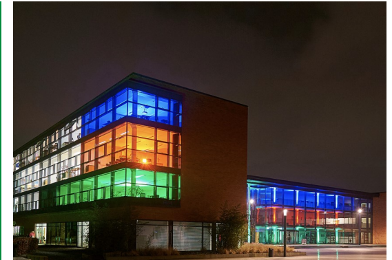
Berufskolleg St. Michael Ahlen