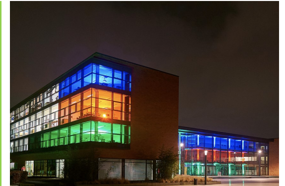
Berufskolleg St. Michael Ahlen