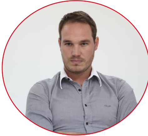
George Forsyth Candidato Presidencial