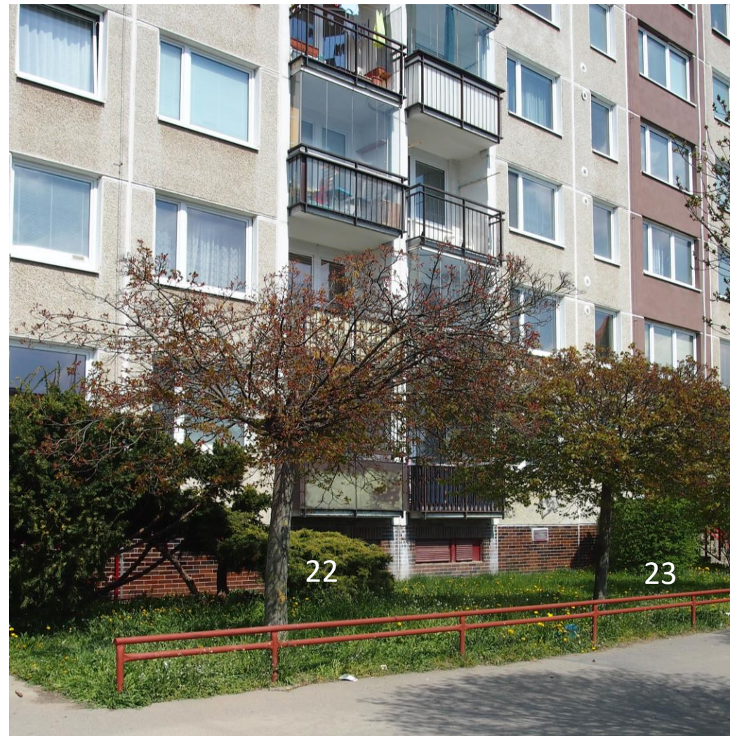
Injektovaný strom - Javor č. 22 Aplikace 29.4. 2021