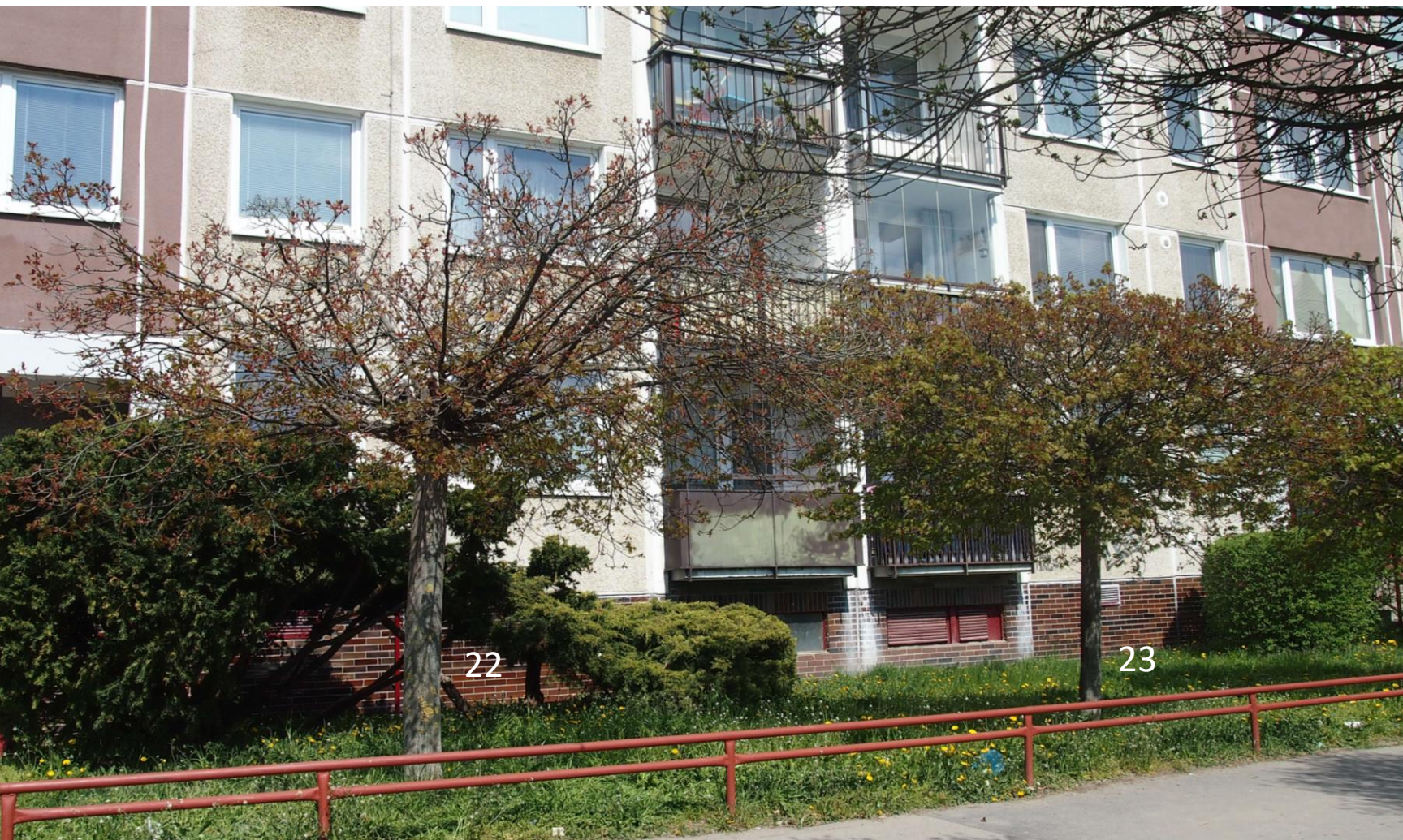
Injektovaný strom - Javor č. 22 Porovnání stavu se sousedním stromem