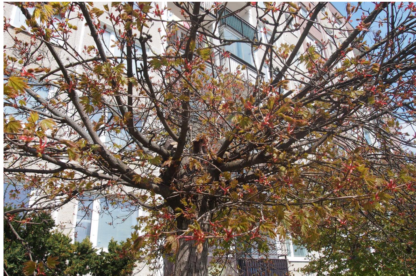
Injektovaný strom - Javor č. 22 Fotodokumentace – nejvíce poškozený strom v aleji Aplikace 29.4.2021