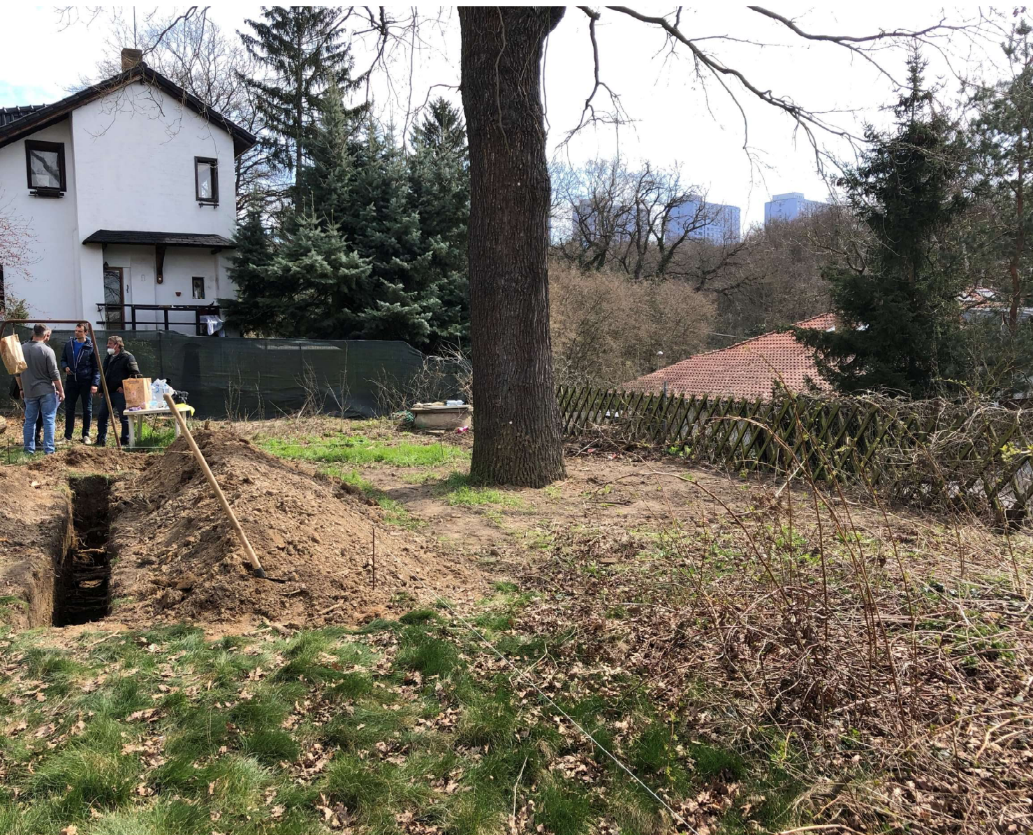
Injektovaný strom: Quercus robur Průzkum stavu kořenového systému stomu před aplikací injektáže