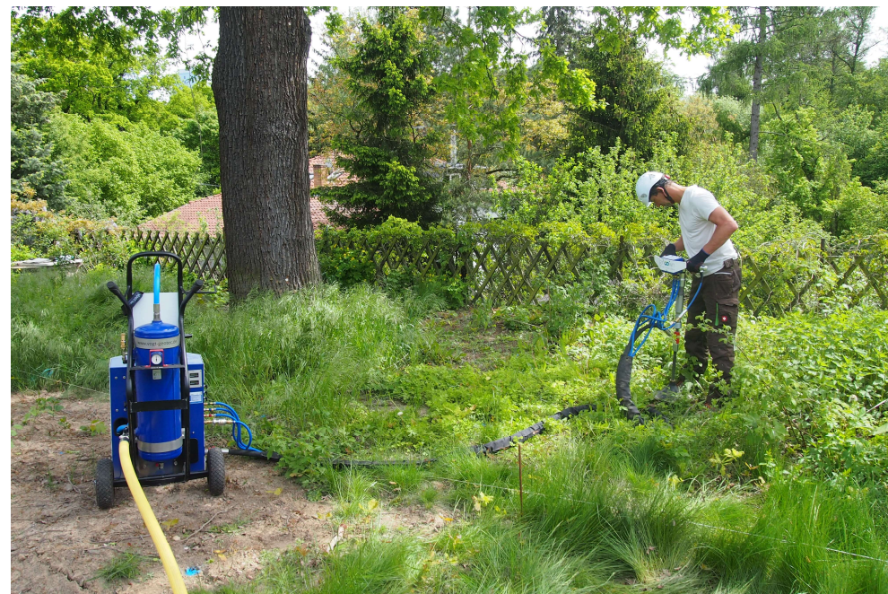
Injektovaný strom - Quercus robur Aplikace 24. 5. 2021