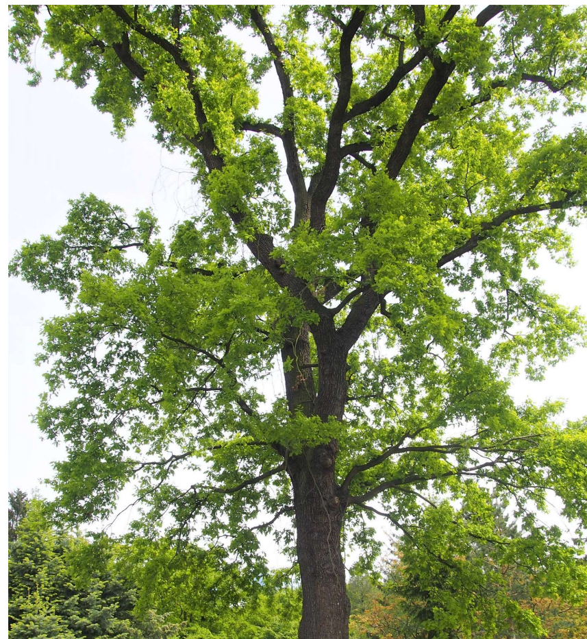
Injektovaný strom - Quercus robur Aplikace 24. 5. 2021