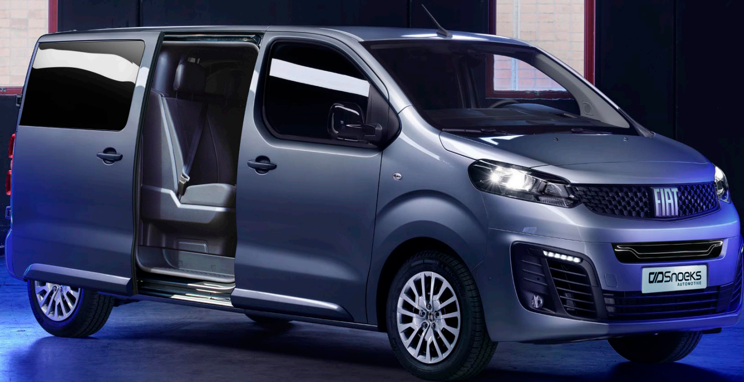
FIAT SCUDO Crew Cab