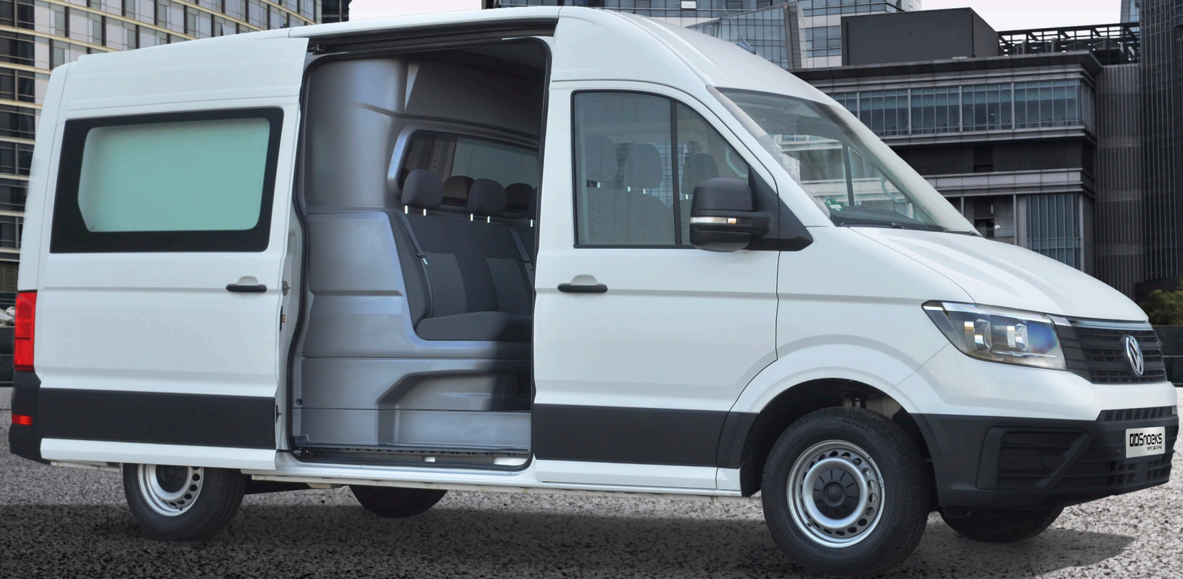
VOLKSWAGEN CRAFTER Crew Cab