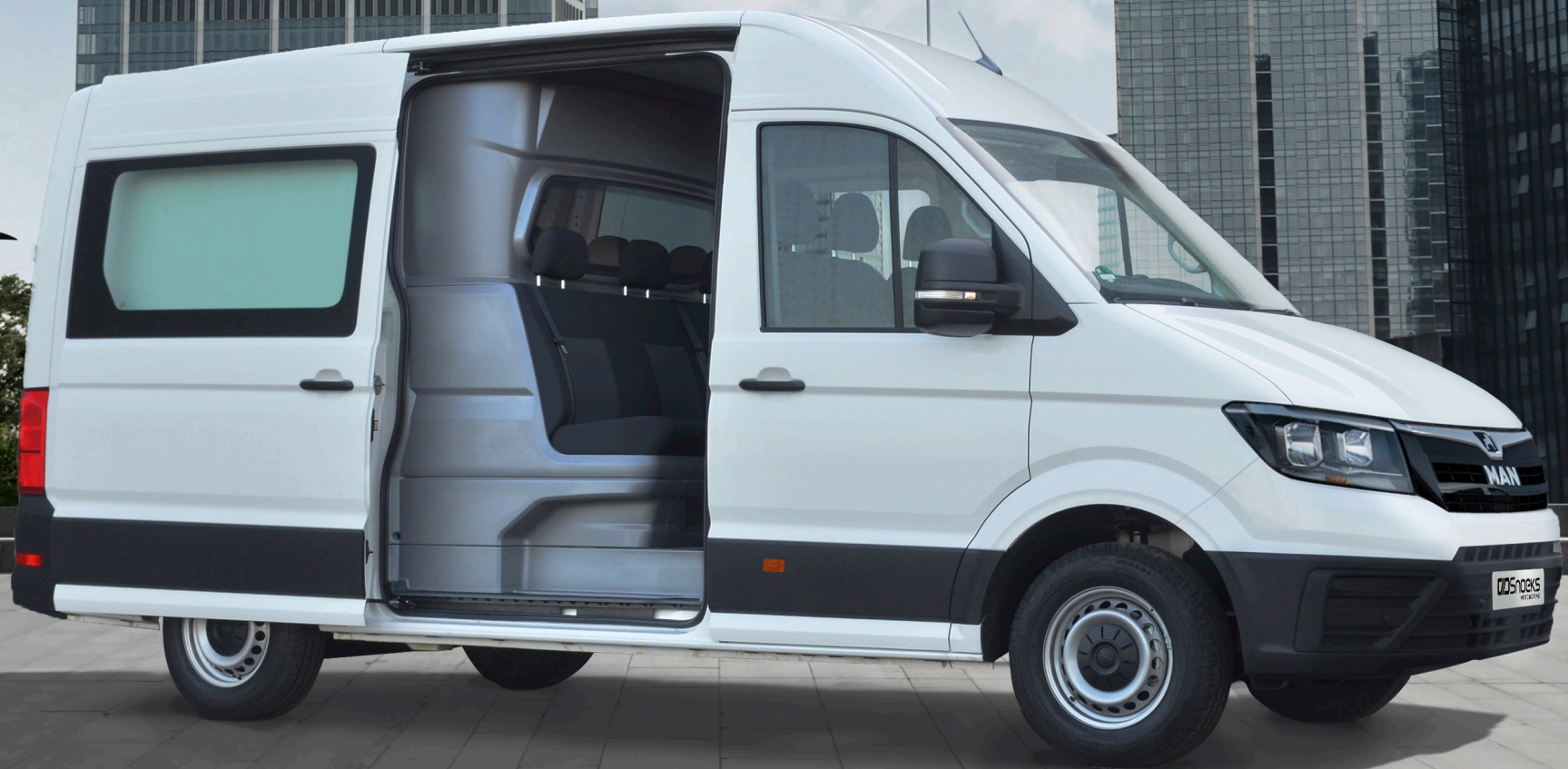
MAN TGE Crew Cab