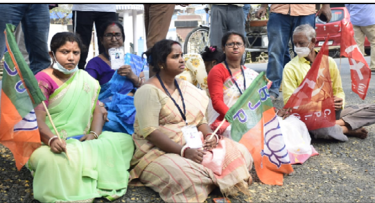
নির্বাচনী এজেন্টকে মারধর, বুথ জ্বালা, ভোট লুট-এর অভিযোগে তুলে ধর্য বিজেপি, সিপিআইএম, নির্দল প্রার্থীরা। বনগাঁ থানার সামনে ছবিটি তুলেছেন সায়েন ঘোষ।

জয়! তৃণমূলের জয়! মা-মাটি-মানুষের জয়! সদ্য সমাপ্ত পশ্চিমবঙ্গের ১০৮টি পৌরসভার সাথে বনগাঁ পৌরসভাও। জয়ের ধারা অব্যাহত। ২২টির মধ্যে ১৯টি নির্বাচনের পরের দিন সকালে খবরের কাগজের হেড লাইন— সূষ্ঠ অবাধ নির্বাচন বনগাঁ পৌরসভাতে। গুপ্ত হাসি তৃণমূলের প্রার্থীদের মুখে। অথচ বাস্তব চিত্র ছিল ভিন্ন রকমের। থানার সামনে বসে কেঁদেছে বিজেপি, সিপিআইএম ও নির্দল প্রার্থী, বুকের সামনে কান্নায় ভেঙে পড়েছে কংগ্রেস প্রার্থী, বুখে এজেস্ট বসাতে না পেরে পথ অবরোধ করেছে বিজেপি প্রার্থী। ভারতবর্ষ একটি সংসদীয় গণতন্ত্র। সংবিধানের নিয়মানুসারে প্রত্যেক নাগরিক তার নিজস্ব ভাবনায়, নিজের মতে ভোট দিতে পারে যে কোন প্রার্থীকে। সেক্ষেত্রে যদি কোন ভোটারকে নির্দিষ্ট কোন প্রার্থীর ক্যাডারদের মতে ভোট দিতে হয়, তাহলে সেটি কেমনতর অবাধ নির্বাচন। বা কোন ভোটারকে যদি ভোট কেন্দ্রে গিয়ে গুনতে হয় তার ভোট দেওয়া হয়ে গেছে, তা হলে তো আরও অবাধ নির্বাচন। সরকারের নির্ধারিত সহায়ক ব্যক্তিবর্গের সাথে নির্বাচন কেন্দ্রে অবাধে যেতে পারেন কোন পত্রিকার নির্ধারিত প্রতিনিধিবৃন্দ; যার অনুমোদন আসে তথ্য সংস্কৃতি দপ্তর থেকে। সেই নির্বাচিত পত্রিকা প্রতিনিধিকে যদি ভোট কেন্দ্রে গিয়ে মার খেতে হয় বা তার ক্যামেরা কেড়ে নেওয়া হয়, তাহলে এ কেমন সূষ্ঠ অবাধ নির্বাচন। একবিংশ শতাব্দীর মধ্যলগ্নে দাঁড়িয়ে সংসদীয় গণতন্ত্রের এমনতর নির্বাচনের জন্য একটাই শব্দ লেখনীতে উঠে আসে— প্রহসন!