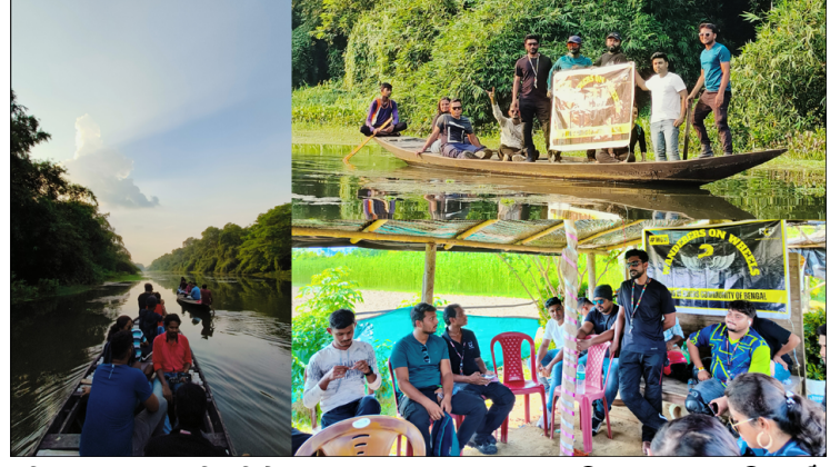
রবিবার রাইডার কমিউনিটি অফ বেঙ্গল-এর পক্ষ থেকে নদীয়ার মঙ্গলগঞ্জ নীলকুঠি প্রাঙ্গণে সচেতনতামূলক বাইক র্যালির আয়োজন করা হয়।