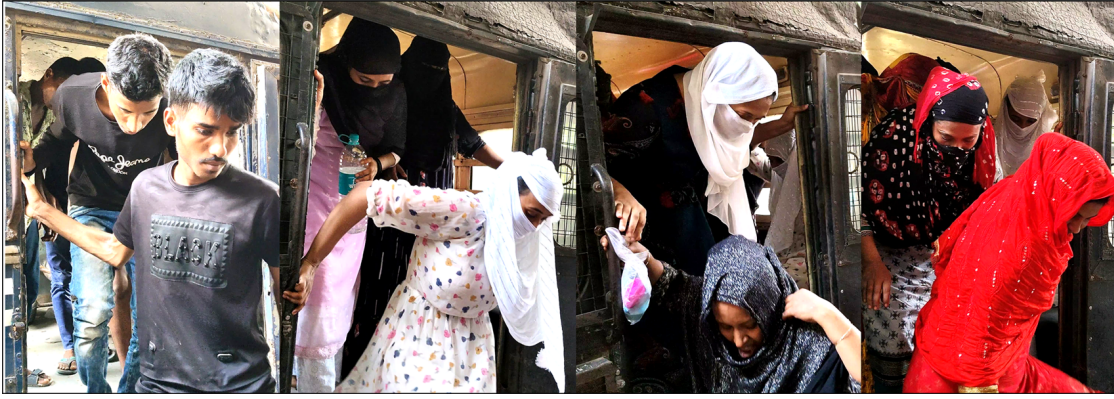
বাগদা পুলিশের হাতে ধরা পড়া অনুপ্রবেশকারীরা।

পুলিশ। পুলিশ জানিয়েছে, ধৃতরা সকলেই ভারত থেকে চোরাপথে বাংলাদেশে যাবার জন্য এসেছিল। এর মধ্যে একাধিক মহিলা রয়েছে। ধৃত মহিলারা ভারতের বিভিন্ন রাজ্যে পরিচারিকার কাজ ও পুরণ্বরা দিনমজুরের কাজ করছিল। তারা দালাল ধরে চোরাপথে বাংলাদেশে যাবার জন্য রনঘাট সীমান্তে এসেছিল।