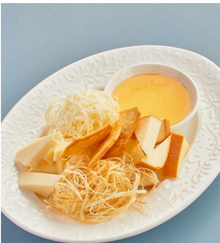
Ассорти сыров Cheese plate