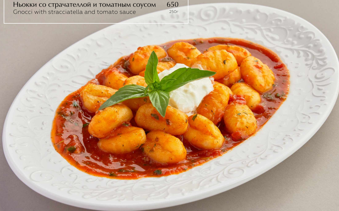
Ньокки со страчателлой и томатным соусом 650 Gnocci with stracciatella and tomato sauce 250r