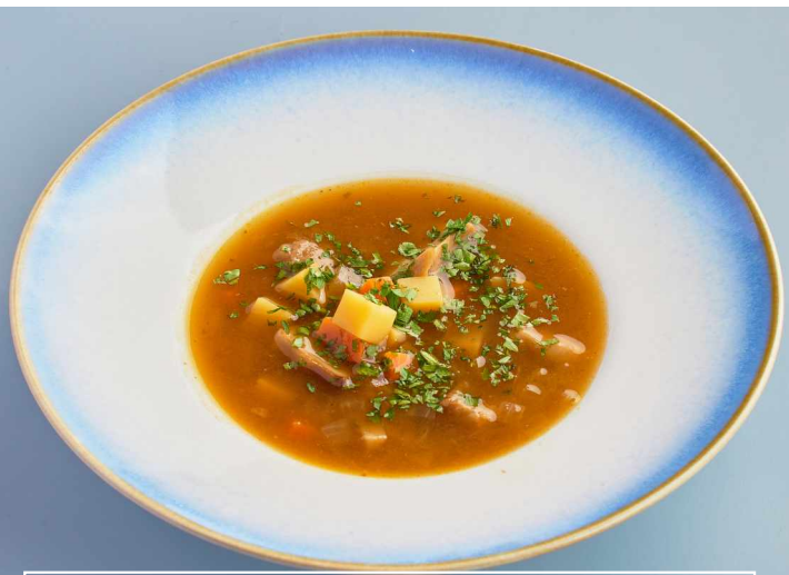
Грибной суп Mushroom soup