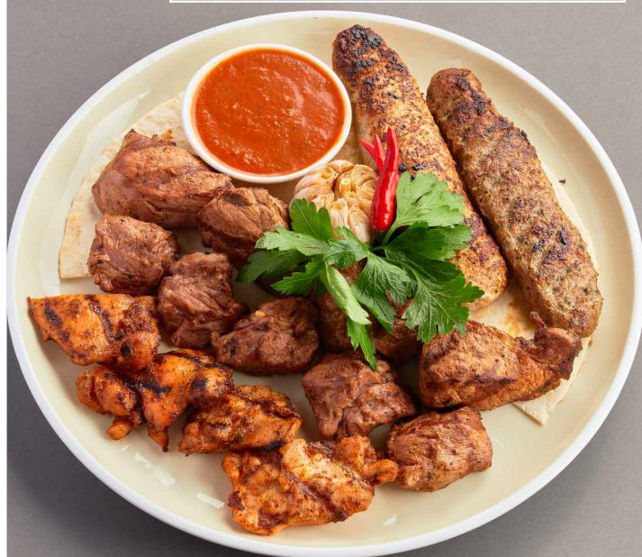
Шашлык из свинины 1050 Grilled pork 200/100/40/30г