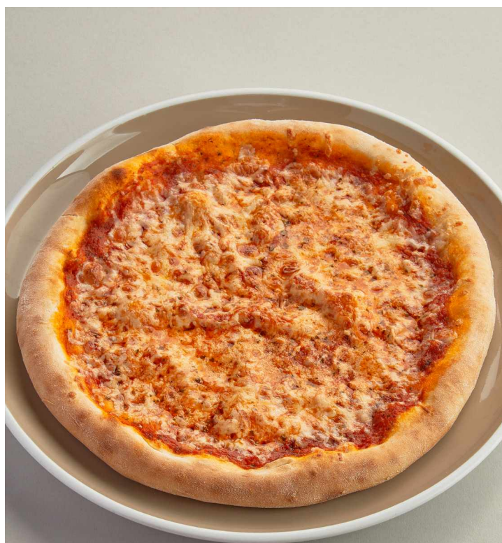
Пицца Маргарита Margarita