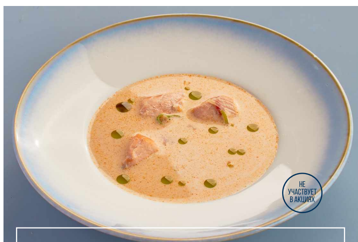
Уха/ Сливочная Уха Fish soup/ Creamy fish soup