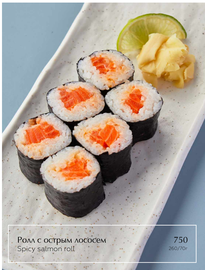
Ролл с острым лососем Spicy salmon roll