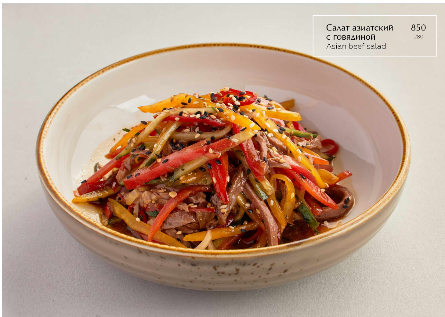
Салат азиатский с говядиной Asian beef salad