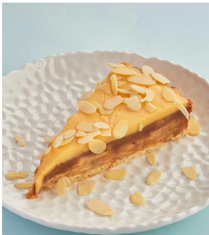
Шоколадно - банановый торт Chocolate banana cake