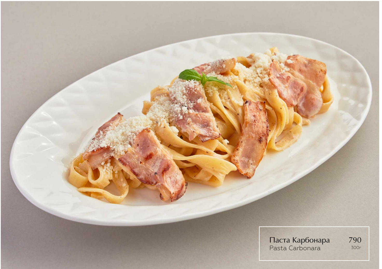
Паста Карбонара Pasta Carbonara 790 300г