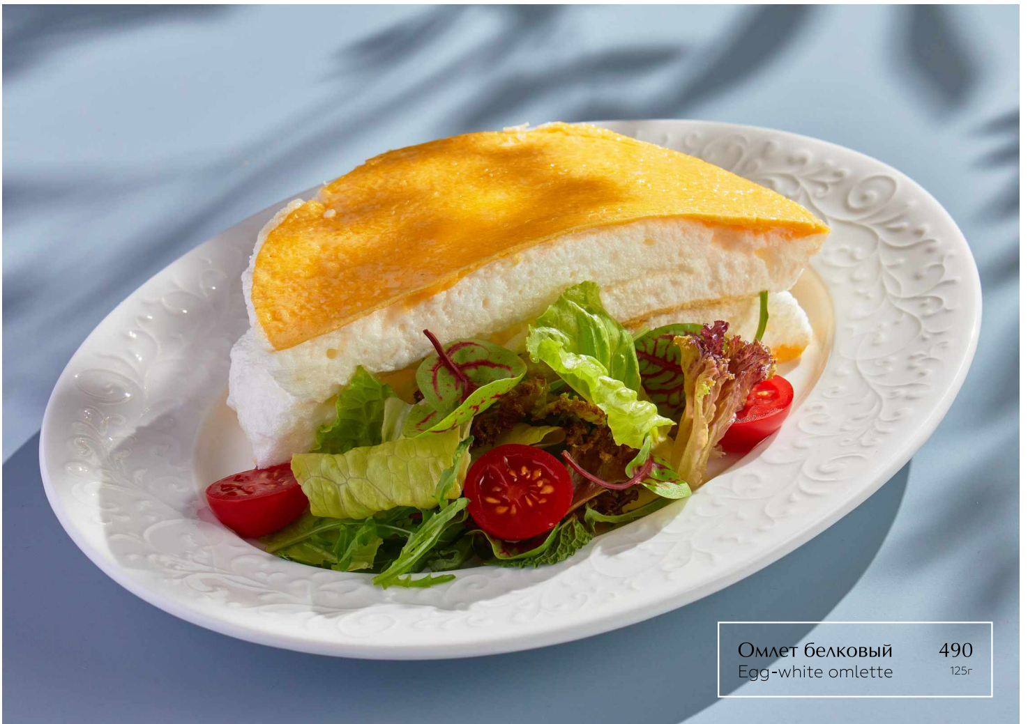
Омлет белковый 490 Egg-white omlette 125г