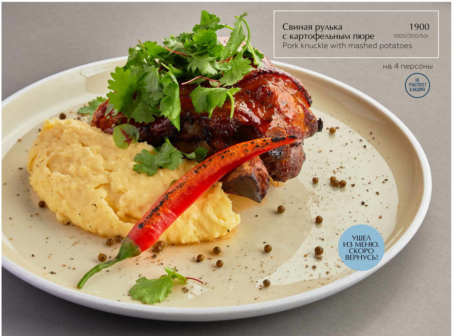
Свиная рулька с картофельным пюре Pork knuckle with mashed potatoes