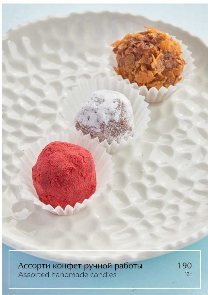
Ассорти конфет ручной работы Assorted handmade candies