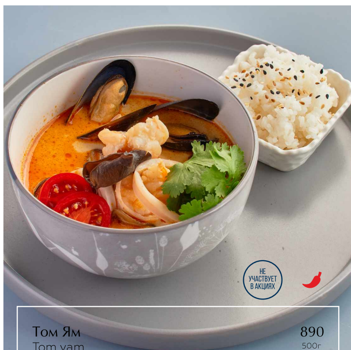
Том Ям Tom yam