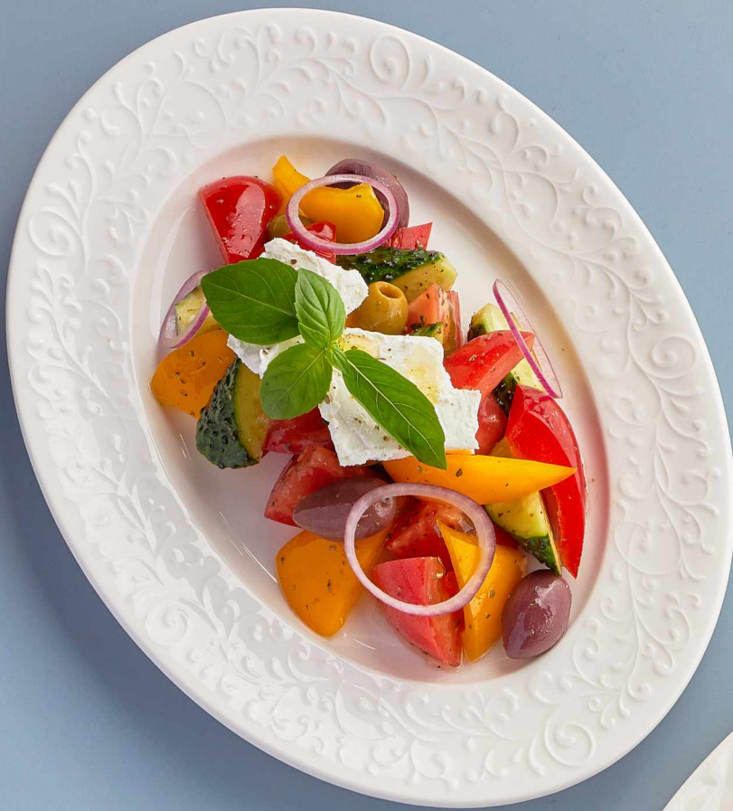
Греческий салат 750 Greek salad 290г