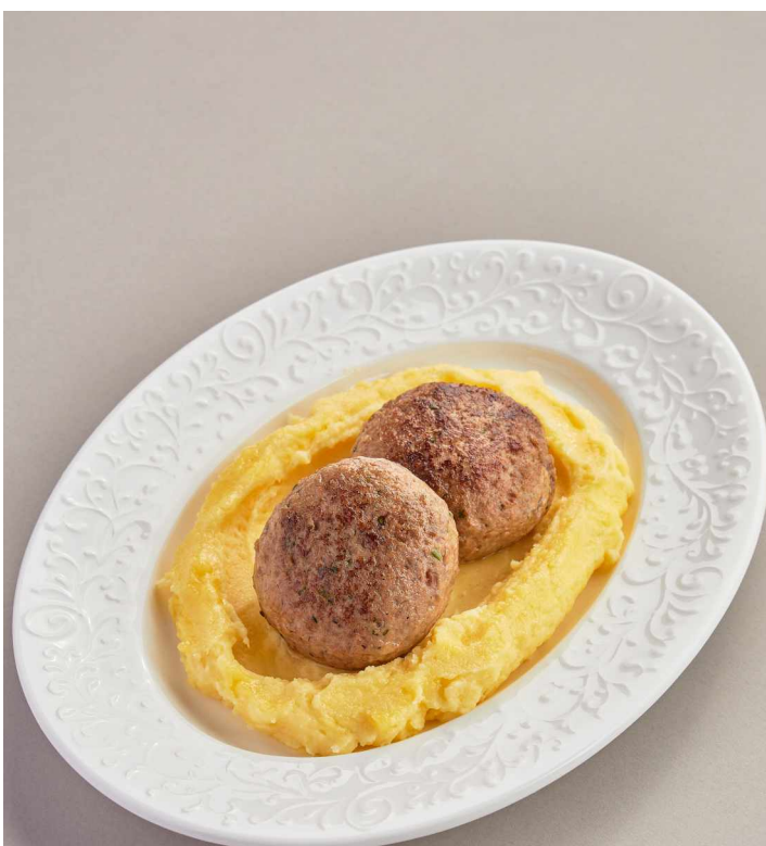
Домашние котлеты с картофельным пюре Homemade cutlets with mashed potatoes