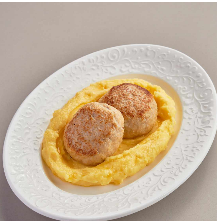
Куриные котлеты с картофельным пюре Chicken cutlets with mashed potatoes