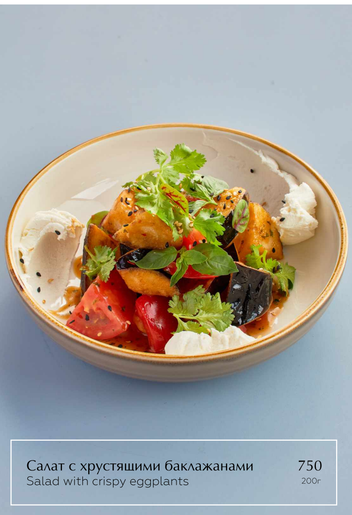
Салат с хрустящими баклажанами Salad with crispy eggplants