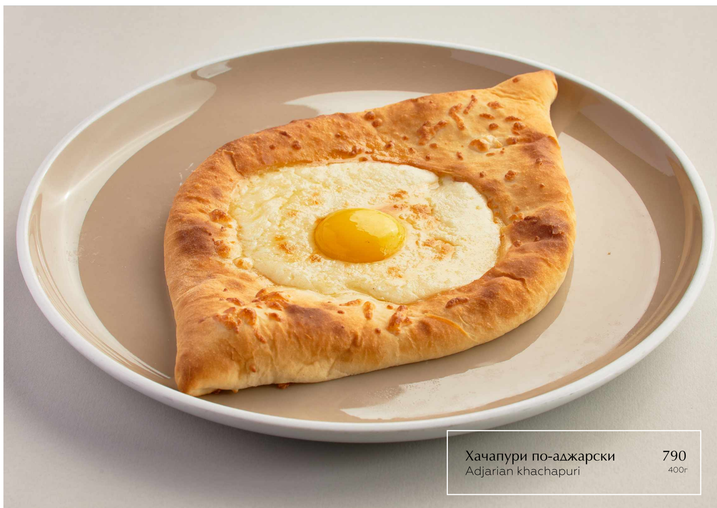
Хачапуре по-аджарски Adjarian khachapuri