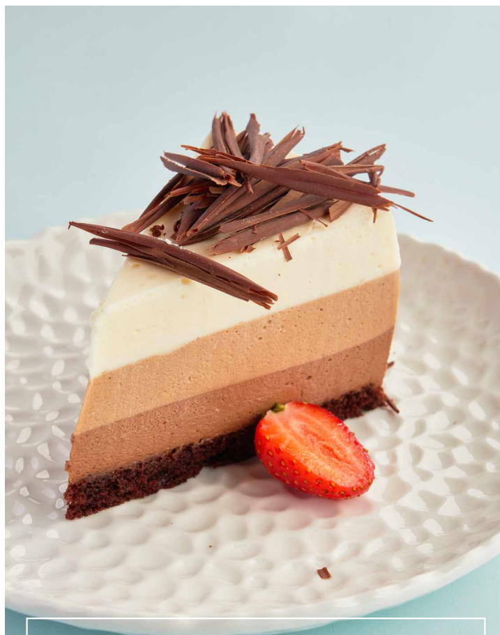
Три шоколада 3 chocolates