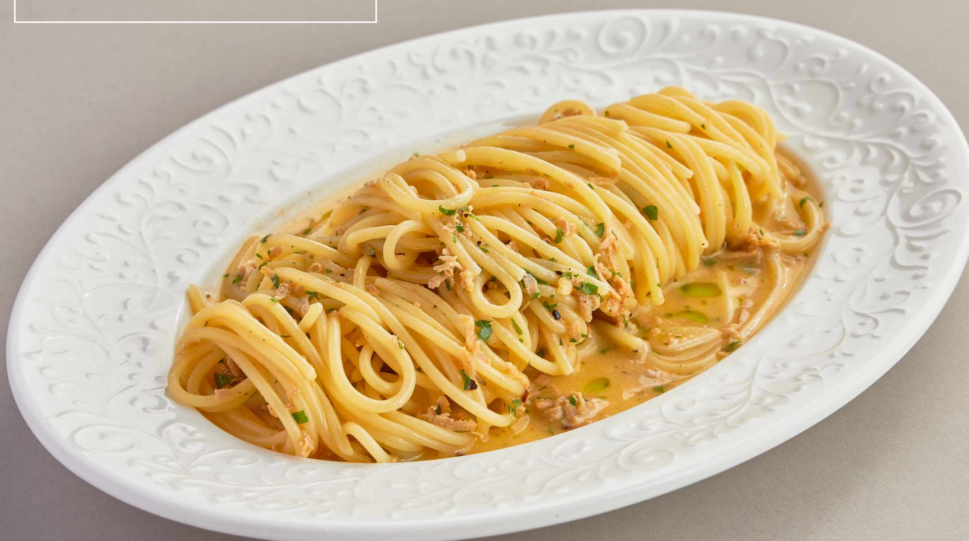
Паста с икрой минтая 650 Pasta with pollock roe 260г