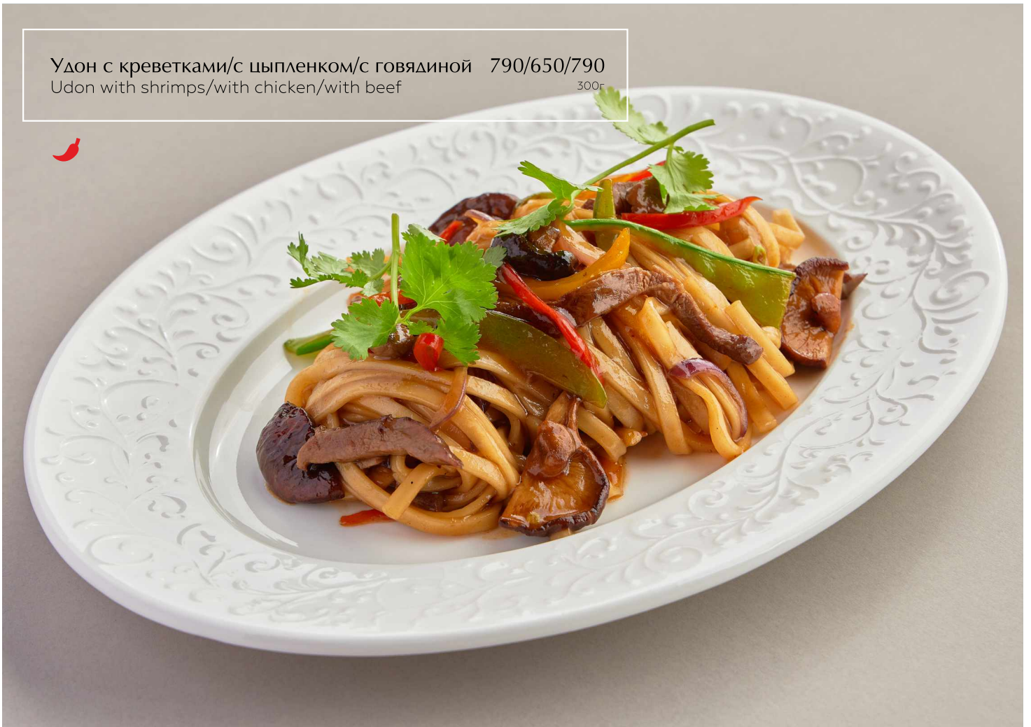
Удон с креветками/с цыпленком/с говядиной Udon with shrimps/with chicken/with beef 790/650/790 300г