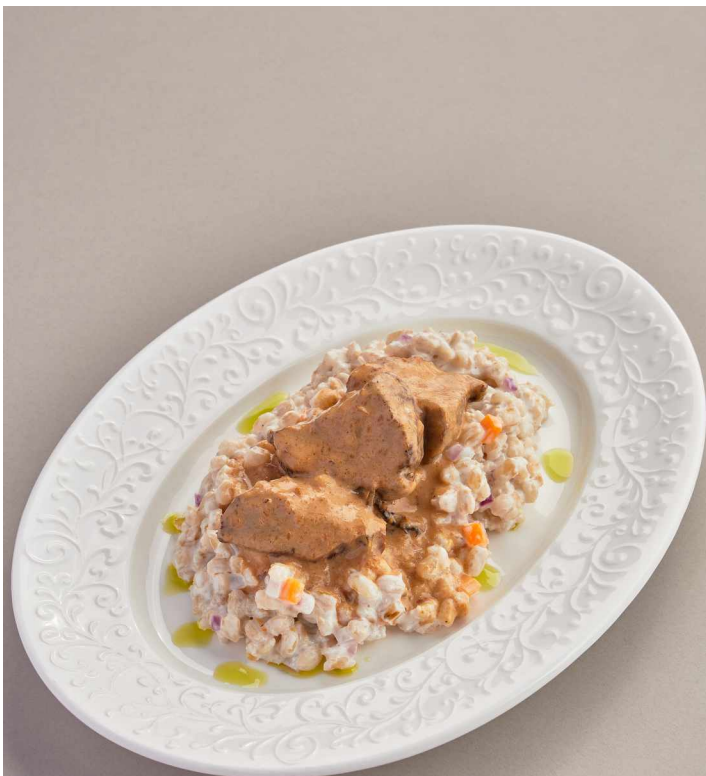
Говяжьи щечки с перловкой Beef cheeks with pearl barley