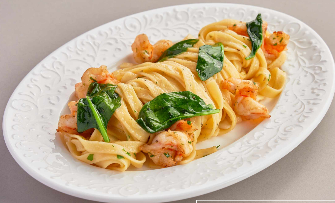
Паста с креветками и цукини 690 Pasta with shrimps and zucchini 270г