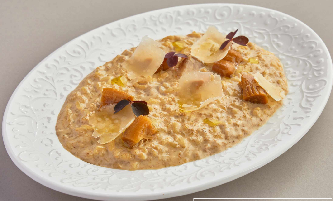
Ризотто с белыми грибами 1050 Risotto with porcini mushrooms 380r