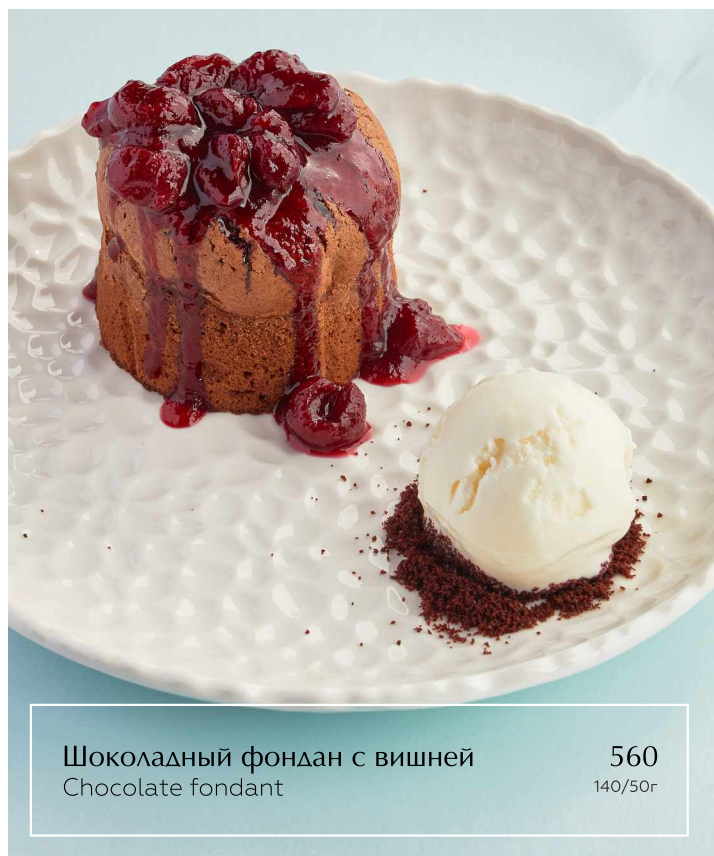
Шоколадный фондан с вишней Chocolate fondant