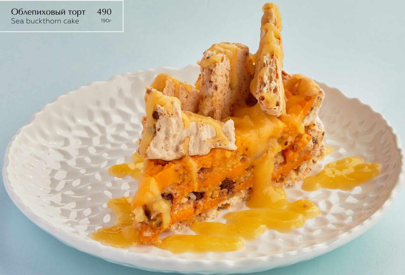
Облепиховый торт 490 Sea buckthorn cake 190r