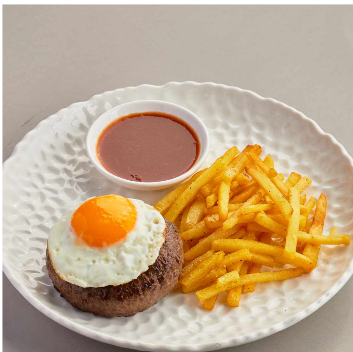
Бифштекс с жареной картошкой Steak with fried potatoes