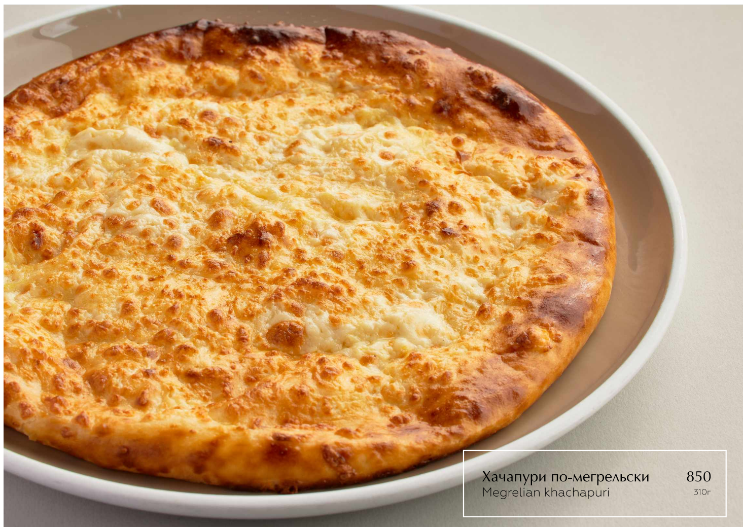
Хачапуре по-мегрелски Megrelian khachapuri