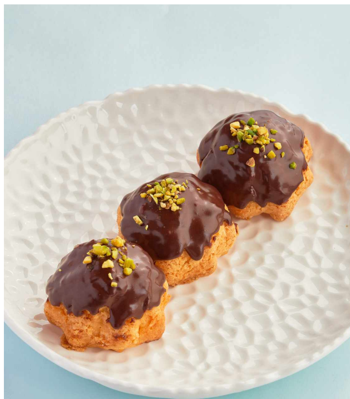
Профитролы с нежным кремом и шоколадом Profiteroles with cream and chocolate