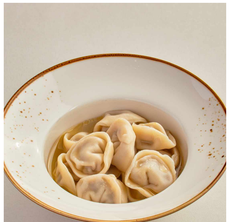
Пельмени домашние Meat dumplings