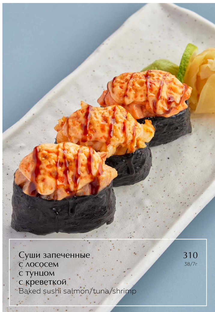
Суши запеченные с лососем с тунцом с креветкой Baked sushi salmon/tuna/shrimp