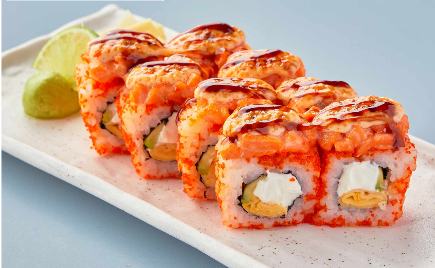
Ролл с креветками Shrimp roll