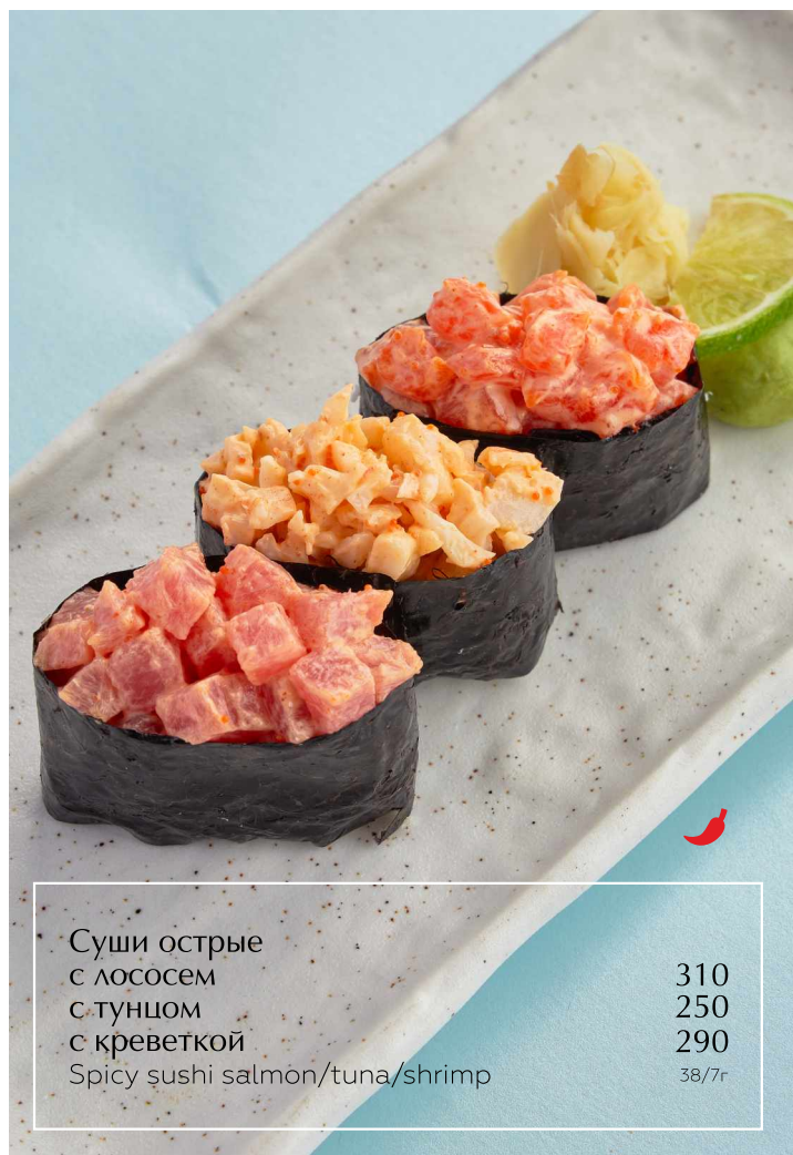
Суши острые с лососем с тунцом с креветкой Spicy sushi salmon/tuna/shrimp