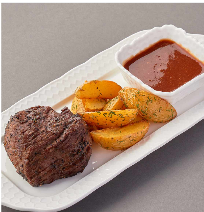
Филе миньон с картофелем Filet mignon