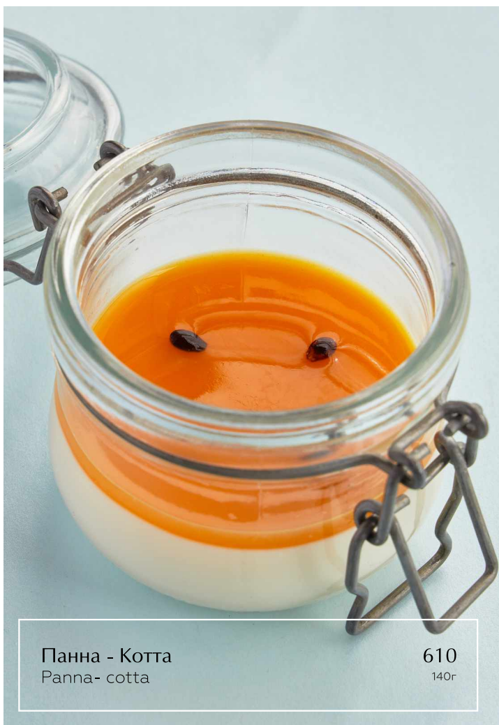
Панна - Котта Panna-cotta