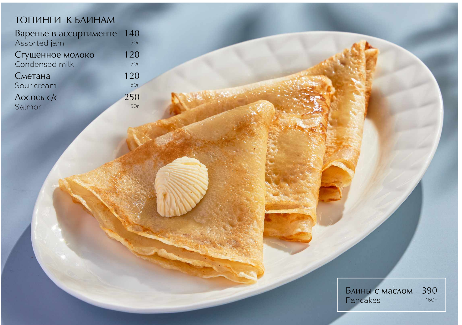
Блины с маслом 390 Pancakes 160г