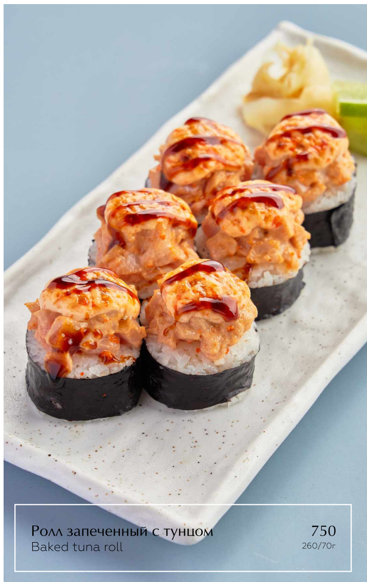
Ролл запеченный с тунцом Baked tuna roll