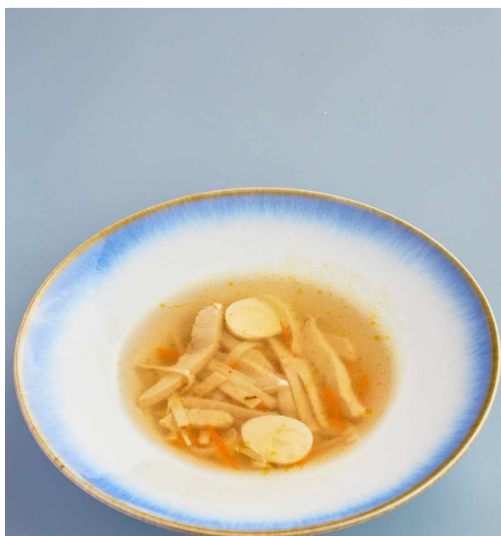
Куриный суп с лапшой Chicken soup with noodles