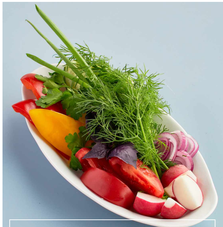
Сезонные овощи Seasonal vegetables