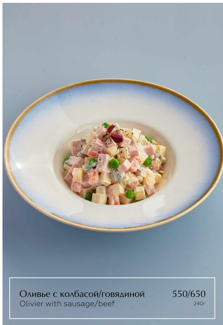
Оливье с колбасой/говядиной Olivier with sausage/beef