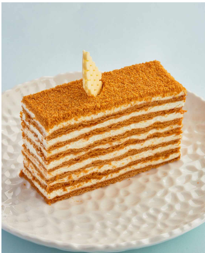
Медовик Honey cake