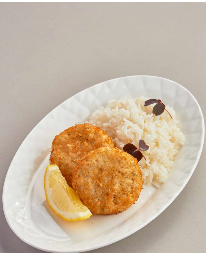
Котлеты из трески с рисом Cod cutlets with rice