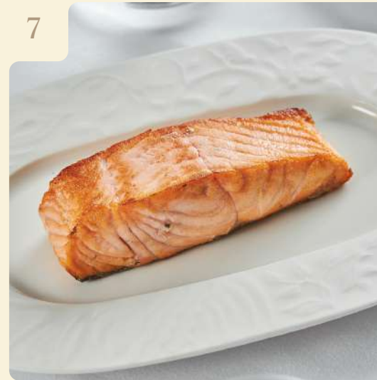
ГЛАЗИРОВАННОЕ ФИЛЕ ЛОСОСЯ / 130 ГР

Обжаренный лосось в глазури на основе апельсина и соуса терияки, с чесноком и соусом чимичурри.