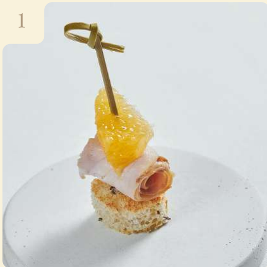
КАНАПЕ ИЗ ИНДЕЙКИ С ЦИТРУСОВЫМ СЕГМЕНТОМ / 18 ГР

Поджаренный хлеб с подкопчённой индейкой с горчичным соусом и сегментом апельсина.