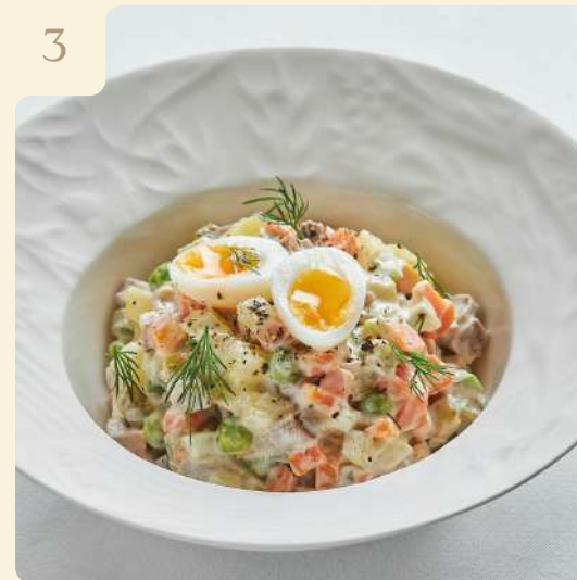
ОЛИВЬЕ С ТЕЛЯЧИМ ЯЗЫКОМ / 210 ГР

Телячий язык, картофель, морковь, огурец свежий, огурец маринованный, яйцо перепелинное, майонез, зелень.