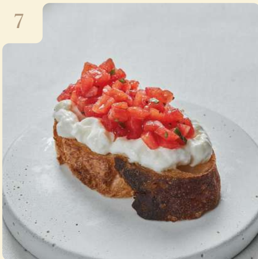
КРОСТИНИ СО СТРАЧАТЕЛЛОЙ И ТОМАТАМИ / 55 ГР

Хрустящий багет со страчателлой, томатами, красным луком, базиликом и оливковым маслом.