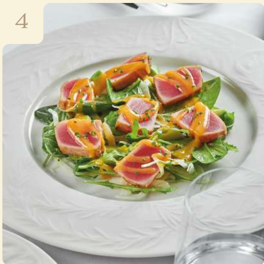
САЛАТ С ТУНЦОМ И ЗАПРАВКОЙ МАНГО-ЧИЛИ / 170 ГР

Обоженный тунец с заправкой манго-чили, авокадо, фенхелем, рукколой.