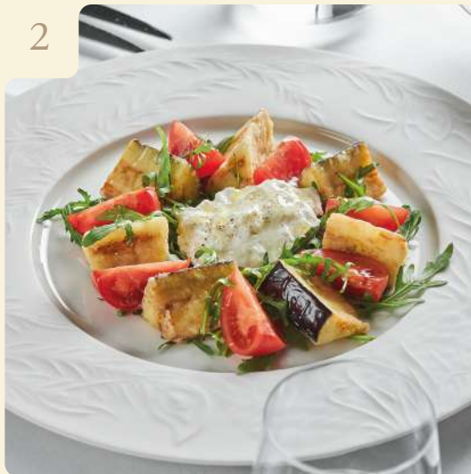
САЛАТ С БАКЛАЖАНАМИ И СТРАЧАТЕЛЛОЙ / 190 ГР

Баклажаны, кукурузный крахмал, томаты, руккола, страчителла, бальзамический крем, оливковое масло.