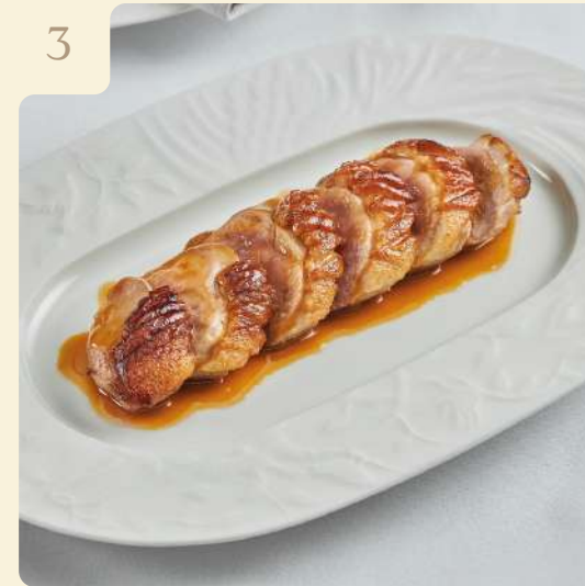
УТИНАЯ ГРУДКА МАГРЭ / 170 ГР

Обжаренная на гриле утиная грудка с трюфельно-сливочным соусом.