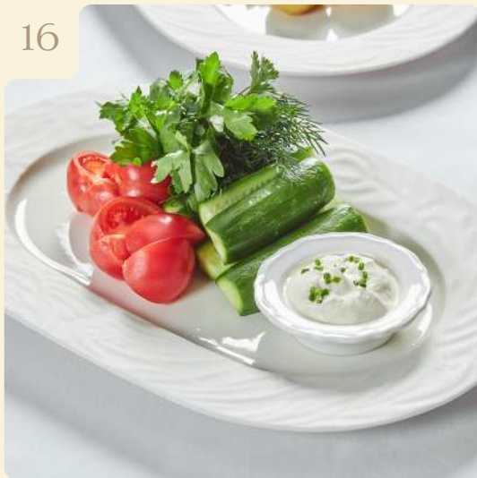
МОЛОДЫЕ ОВОЩИ С КОПЧЕНОЙ СМЕТАНОЙ / 280 ГР

Свежие огурцы, томаты, зелень, копченая сметана.