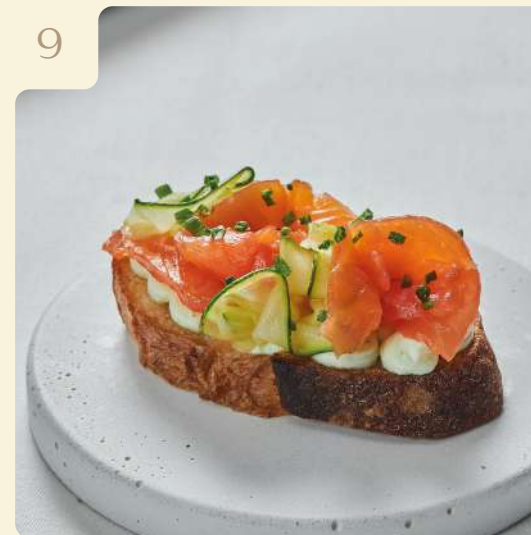
КРОСТИНИ С ЛОСОСЕМ СЛАБОЙ СОЛИ / 55 ГР

Хрустящий багет с лососем слабой соли, кремом из сыра и зелени, маринованным цукини, укропом и шнитт луком.