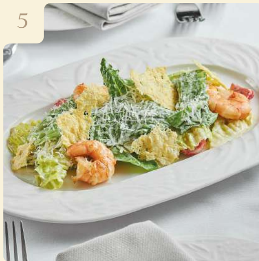
САЛАТ ЦЕЗАРЬ С КРЕВЕТКАМИ / 140 ГР

Ромейн, соус цезарь, креветки, чеснок, томаты, крутоны, пармезан.