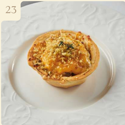
ТАРТИФЛЕТ С КРАБОМ И КРЕВЕТКАМИ / 80 ГР

Пирог на основе рубленого теста запечённый под сыром жульен из мяса краба и креветок с луком и вешенками.