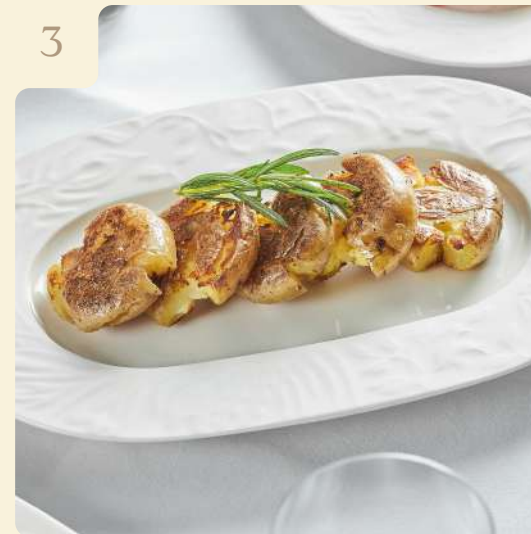
МОЛОДОЙ КАРТОФЕЛЬ / 180 ГР

Обжаренный картофель с розмарином и чесноком.