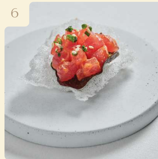
ТАР-ТАР ИЗ ТУНЦА НА ХРУСТЯЩЕЙ РИСОВОЙ БУМАГЕ / 16 ГР

Тартар из тунца заправленный томатным айоли на листе нори и рисовом чипсе, посыпанный кунжутом.