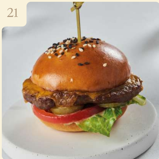
МИНИ-БУРГЕР С ГОВЯДИНОЙ / 100 ГР

Булочка с говяжьей котлетой, томатами, маринованными огурцами, соусом айоли, ромейном и сыром чеддер.