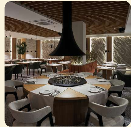
ОСНОВНОЙ ЗАЛ РЕСТОРАНА «ОСОБНЯК ЮРГЕНСА»

Элегантное пространство для проведения банкетов, торжественных ужинов и корпоративных мероприятий.