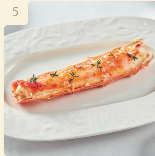
ФАЛАНГА КРАБА С СОУСОМ ГОЛЛАНДЕЗ / 200 ГР

Запечённая фаланга краба с ароматным маслом и голландским соусом.