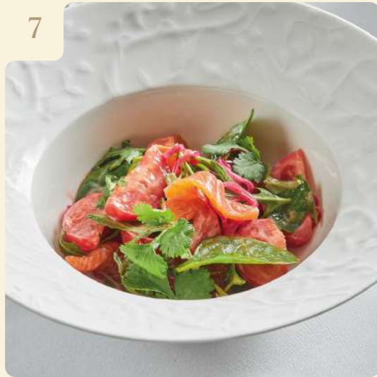
САЛАТ С ЛОСОСЕМ И ТОМАТАМИ / 150 ГР

Лосось слабой соли с томатами, заправкой из сладкого чили, маринованным луком и кинзой.