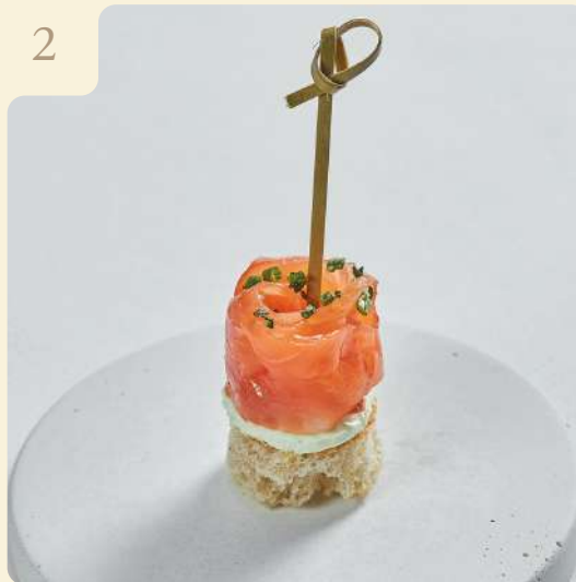
КАНАПЕ ИЗ ЛОСОСЯ СЛАБОЙ СОЛИ / 18 ГР

Поджаренный хлеб с кремом из сыра и зелени, лососем слабой соли и шнитт луком.