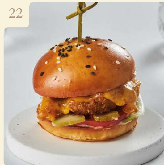
МИНИ-БУРГЕР С ЦЫПЛЕНКОМ / 100 ГР

Булочка с куриной котлетой, томатами, маринованными огурцами, соусом айоли, ромейном и сыром чеддер.