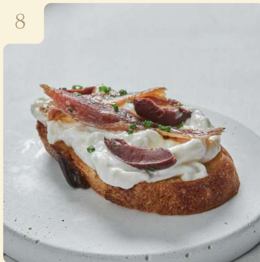
КРОСТИНИ СО СТРАЧАТЕЛЛОЙ И АНЧОУСАМИ / 50 ГР

Хрустящий багет со страчателлой, анчоусами и оливками Каламата, луком шнитт и оливковым маслом.