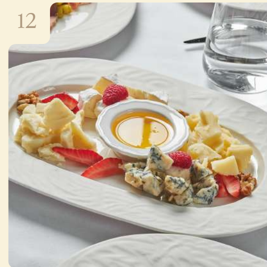
ПЛАТО СЫРОВ С ТРЮФЕЛЬНЫМ МЕДОМ / 130 ГР

Пармезано реджано, пекорино романо, горгонзола, камамбер, подаются с мёдом, орехами и виноградом.