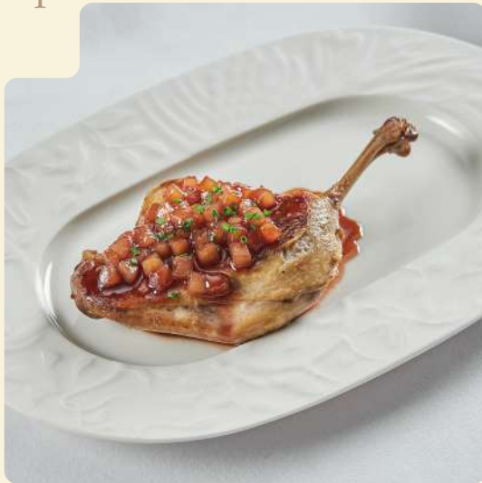
УТИНАЯ НОЖКА КОНФИ / 180 ГР

Томлённая с ароматными травами и корнеплодами утиная ножка конфи с соусом на основе груши.