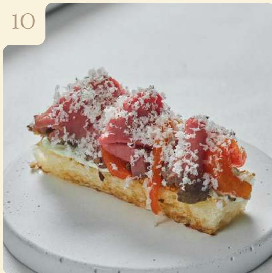
КРОСТИНИ С РОСТБИФОМ И ГОРГОНЗОЛОЙ / 40 ГР

Обжаренная бриошь с ростбифом, печёной паприкой, зелёным крем чизом и тёртой горгонзоллой.