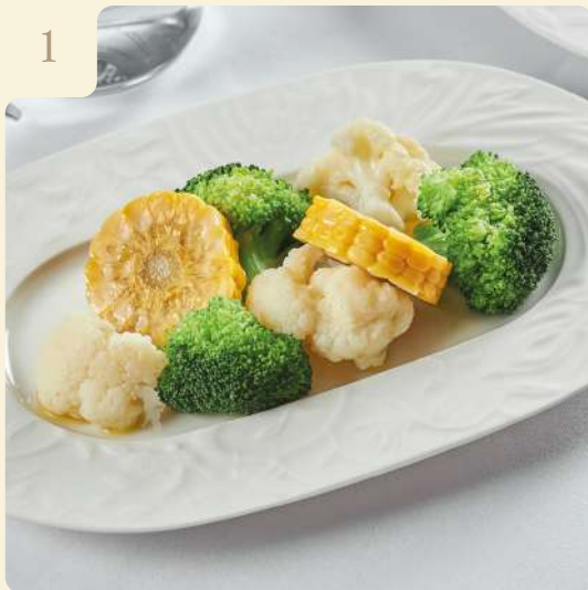
ОВОЦЫ НА ПАРУ / 175 ГР

Паровая кукуруза, цветная капуста и брокколи.