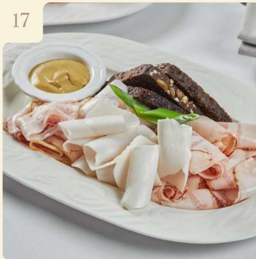
ЛЕДЯНОЕ САЛО / 270 ГР

Сало копченое, солёное, с мясной прожилкой, зеленый лук, горчица, ржаной хлеб.