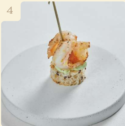
КАНАПЕ ИЗ КРЕВЕТКИ И ГУАКАМОЛЕ / 18 ГР

Хрустящий хлеб с обжаренной креветкой, цедрой, чесноком и кремом из сыра и зелени.