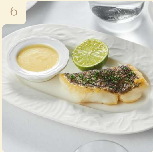
СТЕЙК ИЗ УГОЛЬНОЙ РЫБЫ / 150 ГР

Обжаренный стейк угольной рыбы с чесноком, тимьяном и соусом бешамель.