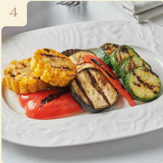
ОВОЩИ ГРИЛЬ / 150 ГР

Болгарский перец, молодой кабачок, баклажан и кукуруза на гриле с чесноком и тимьяном.