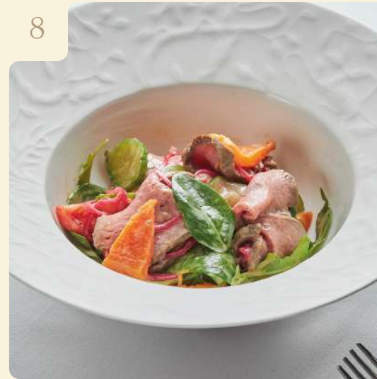
САЛАТ С РОСТБИФОМ / 170 ГР

Ростбиф, огурцы м/с, томаты розовые, печёная паприка, лук маринованный, листья салата, заправка горчиная.