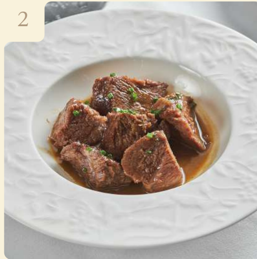
ТОМЛЁННЫЕ ТЕЛЯЧЬИ ЩЁЧКИ / 120 ГР

Томлённые с ароматными травами и корнеплодами телячьи щёчки с солодовым соусом.