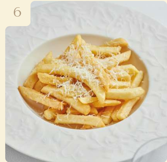
КАРТОФЕЛЬ ФРИ С ПАРМЕЗАНОМ / 150 ГР

Картофель фри с тёртым пармезаном и трюфельным маслом.