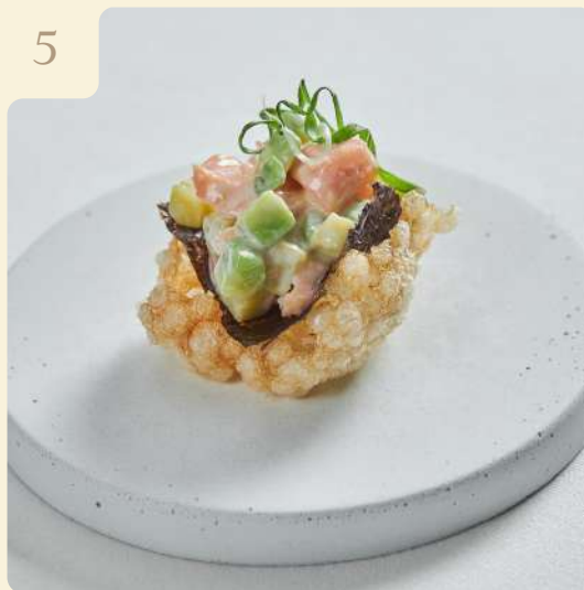
КОПЧЕНАЯ СЕМГА НА ЧИПСЕ ИЗ ТАПИОКИ / 18 ГР

Копчёная семга и авокадо на листе нори заправленная японским майонезом на рисовом чипсе.