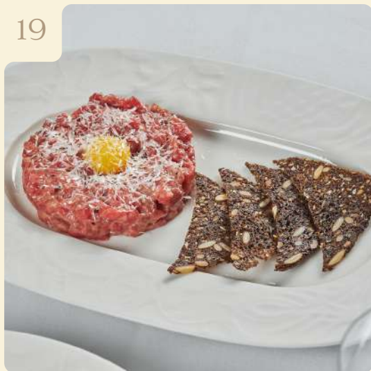
ТАР-ТАР ИЗ ГОВЯДИНЫ / 115 ГР

Говядина, каперсы, лук шалот, горчиная заправка, пармезан, перепелиный желток, шнитт лук и ржаные чипсы.