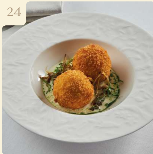
КАРТОФЕЛЬНЫЕ КРОКЕТЫ С ТРЮФЕЛЬНЫМ СОУСОМ / 180 ГР

Печёный картофель, трюфельный соус, вешенки жареные, зелёное масло, зелёный лук завитки.