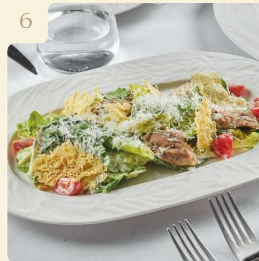
САЛАТ ЦЕЗАРЬ С ЦЫПЛЕНКОМ / 210 ГР

Ромейн, соус цезарь, бедро цыпленка, томаты, крутоны, пармезан.