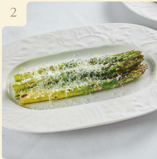
СПАРЖА НА ГРИЛЕ ОТ 5-ТИ ПОРЦИЙ / 130 ГР

Обжаренная спаржа с оливковым маслом, чесноком и цедрой лимона с тёртым пармезаном.