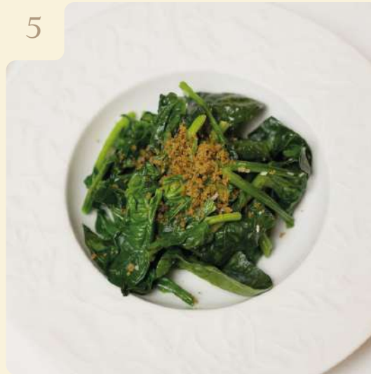
ПРИПУЩЕННЫЙ ШПИНАТ / 90 ГР

Припущенный шпинат с чесноком и оливковым маслом.