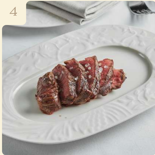
ФИЛЕ МИНЬОН С СОУСОМ РЕДВАЙН / 140 ГР

Классический стейк из говяжьей вырезки с соусом на основе красного вина и сливочного масла.