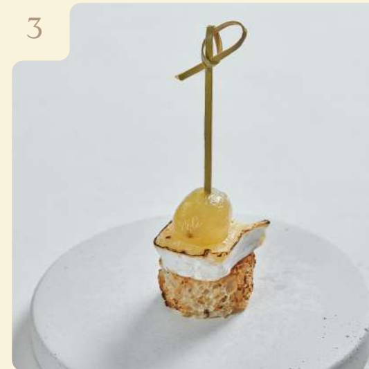
КАНАПЕ С СЫРОМ КАМАМБЕР / 15 ГР

Поджаренный хлеб с запечённым камамбером и маринованным виноградом.