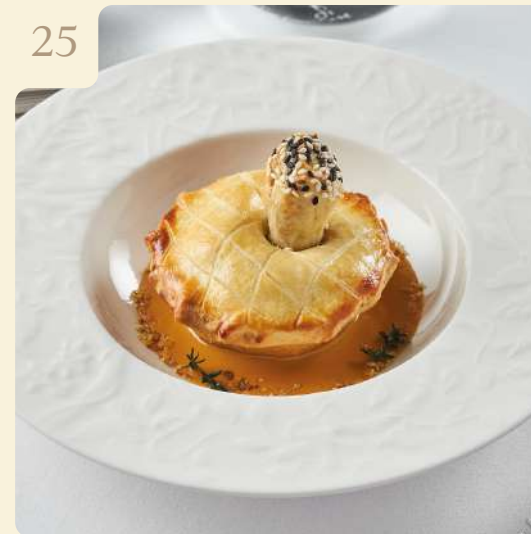
ТАРТИФЛЕТ С УТИНОЙ НОЖКОЙ КОНФИ / 125 ГР

Пирог на основе рубленого теста с уткой конфи, луком, морковью, сельдереем, тимьяном и сливочным соусом.