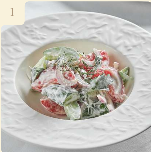
САЛАТ ИЗ ТОМАТОВ С КОПЧЕНОЙ СМЕТАНОЙ / 190 ГР

Томаты и бакинские огурцы, лук красный, зелень, копчёная сметана.