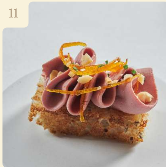
КРОСТИНИ С ПАШТЕТОМ ИЗ ПЕЧЕНИ ЦЫПЛЕНКА / 30 ГР

Хрустящий хлеб с семечками с паштетом из печени цыплёнка, фундук и шнитт лук.