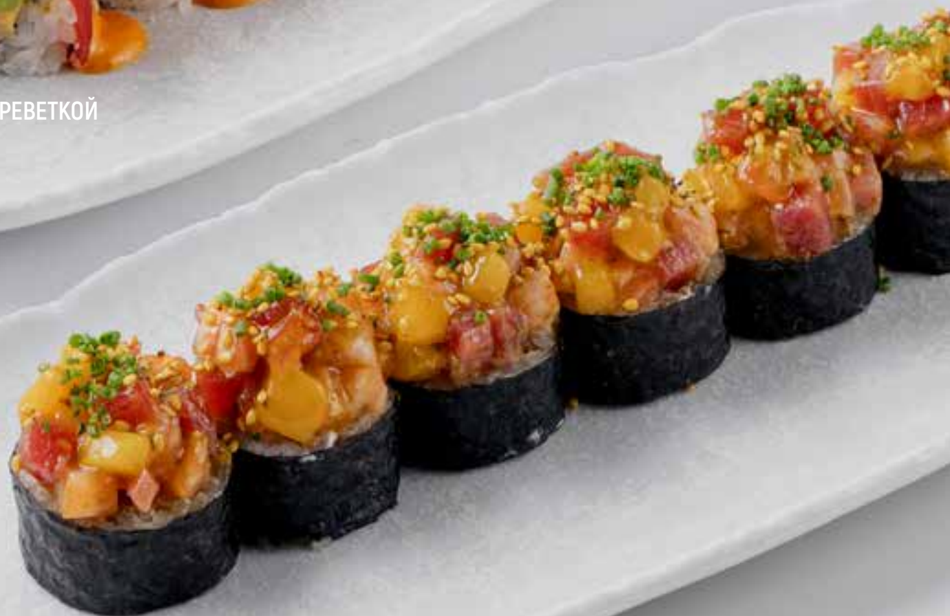
РОЛЛ С ЛОСОСЕМ, ТУНЦОМ И МАНГО В ЛАЙМОВОМ СОУСЕ 860 Р