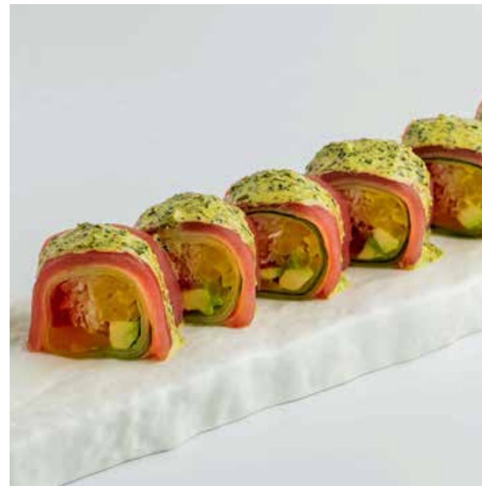
ФРЕШ РОЛЛ ТУНЕЦ С СОУСОМ ЧИМИЧУРРИ 680 Р