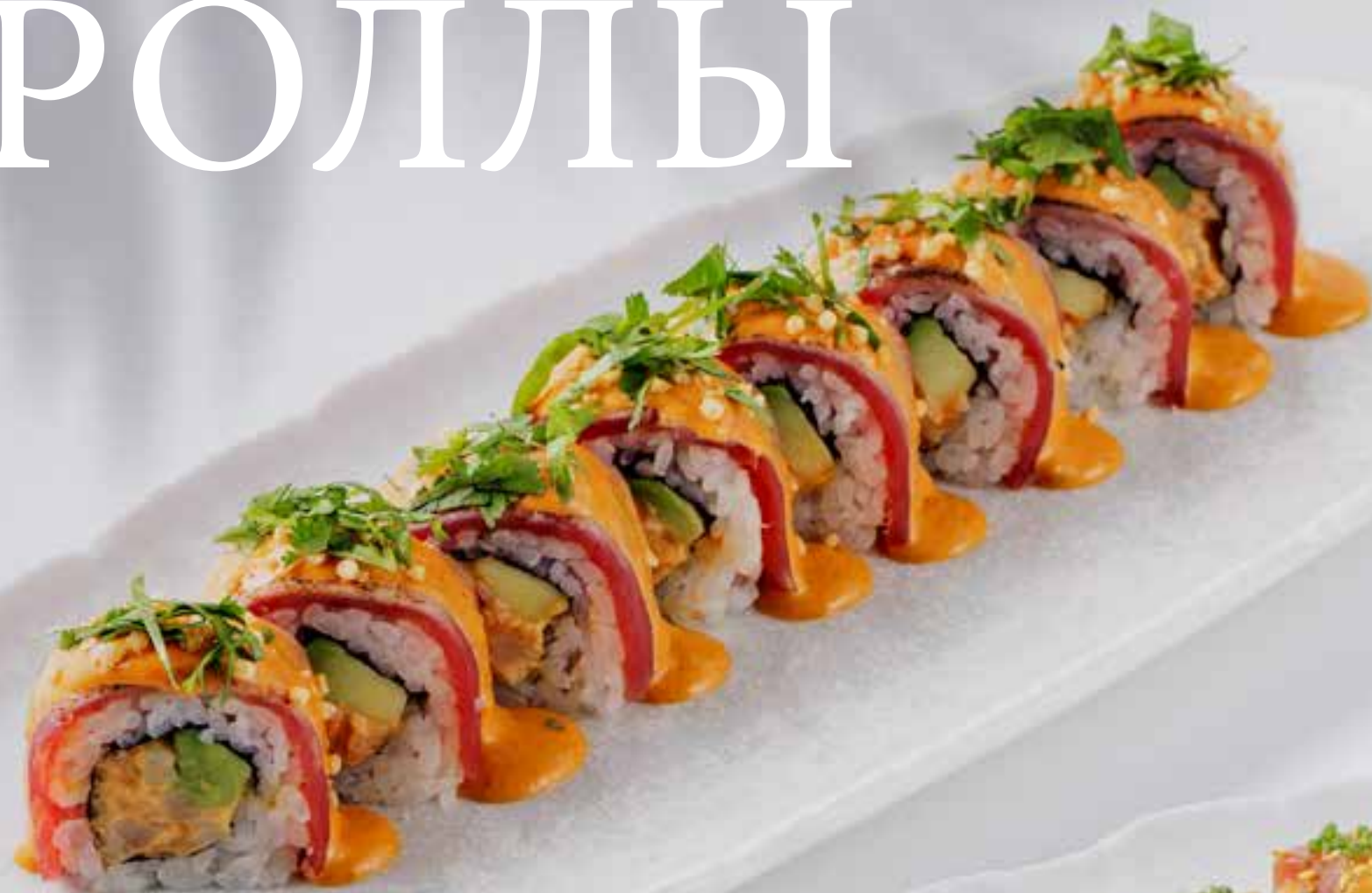
РОЛЛ С ТУНЦОМ, КРЕВЕТКОЙ И СОУСОМ ТОМ ЯМ 890 Р