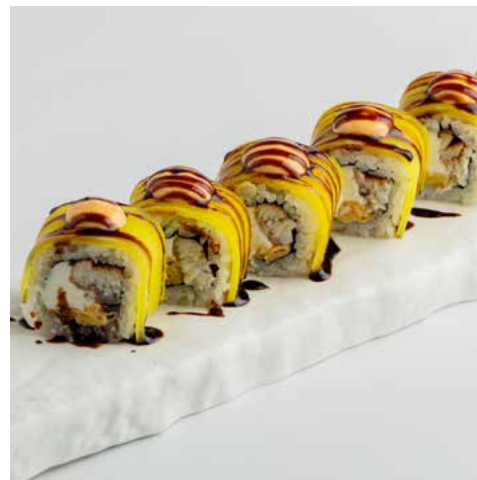
РОЛЛ С УГРЕМ И ТАКУАНОМ 780 Р