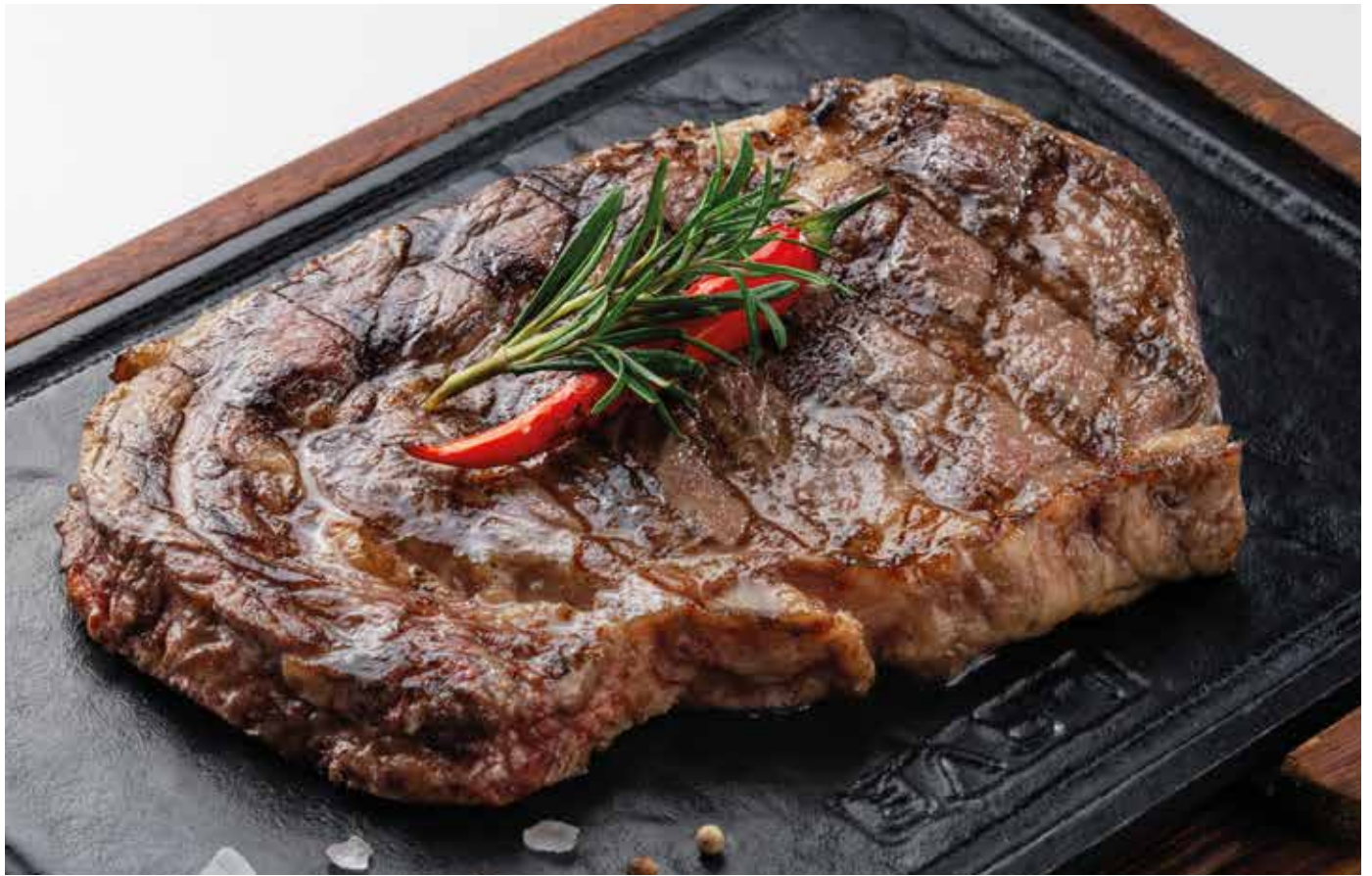
Стейк Рибай 2750 | 250 гр.