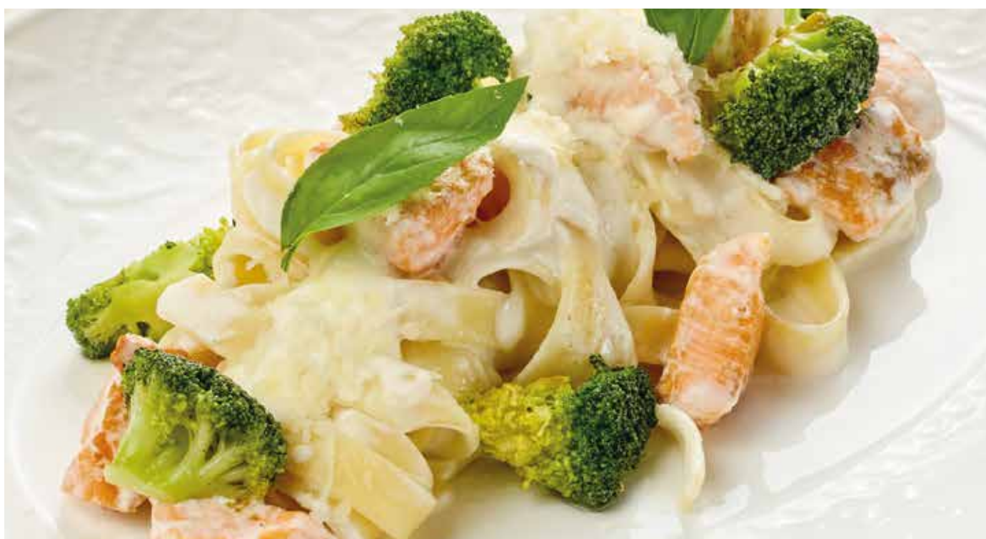
Паста с лососем и брокколи в сливочном соусе