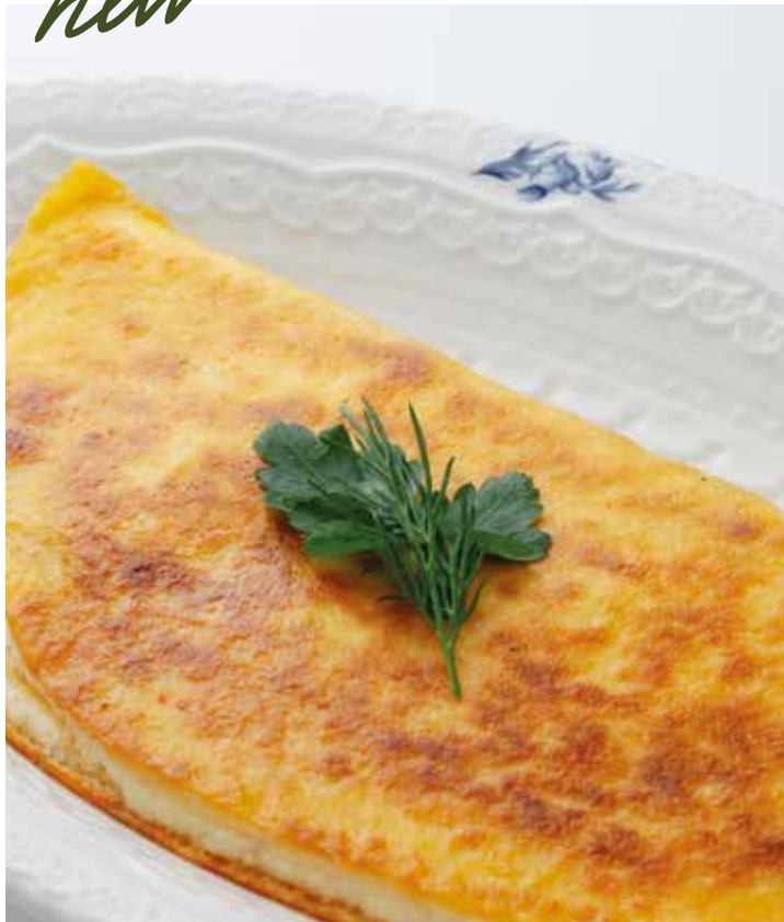
Домашняя лепёшка с курицей и сыром