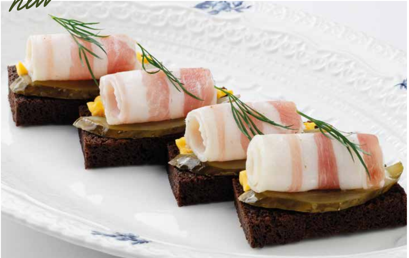
Тосты с салом и бочковыми огурцами