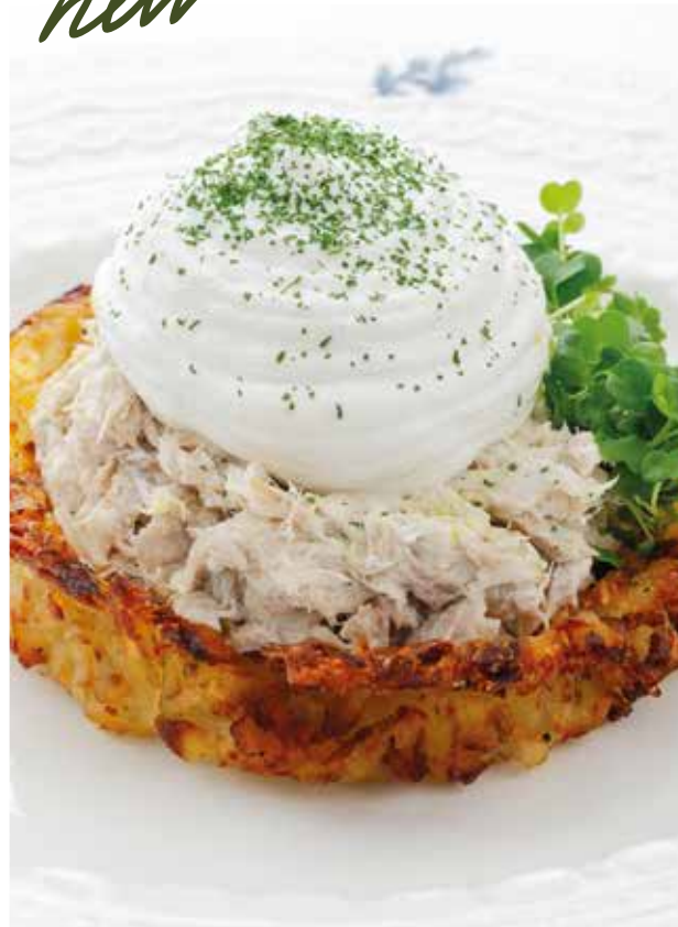
Драник с копчёной скумбрией и сметаной