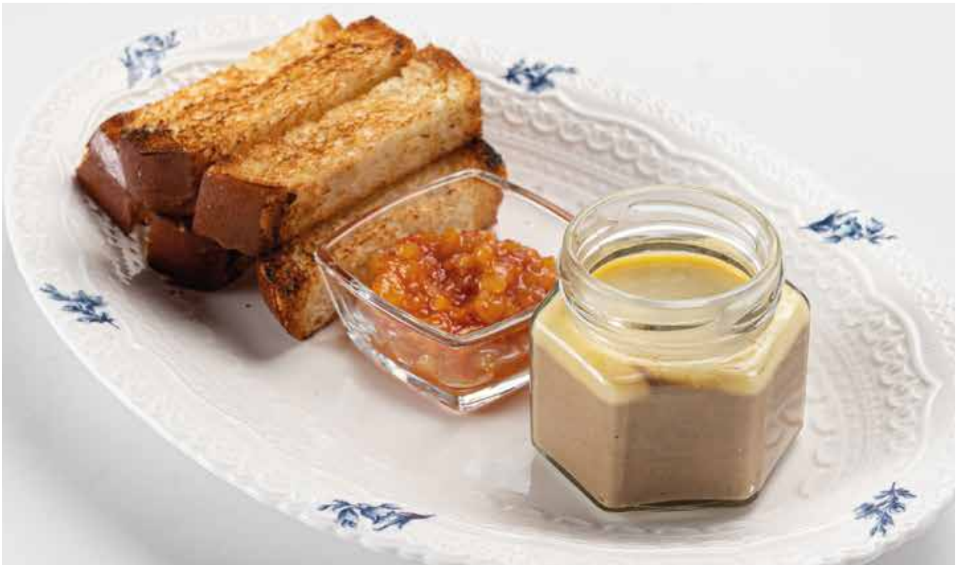
Паштет из утиной печени

подаётся с чатни из груши и обжаренной бриошью