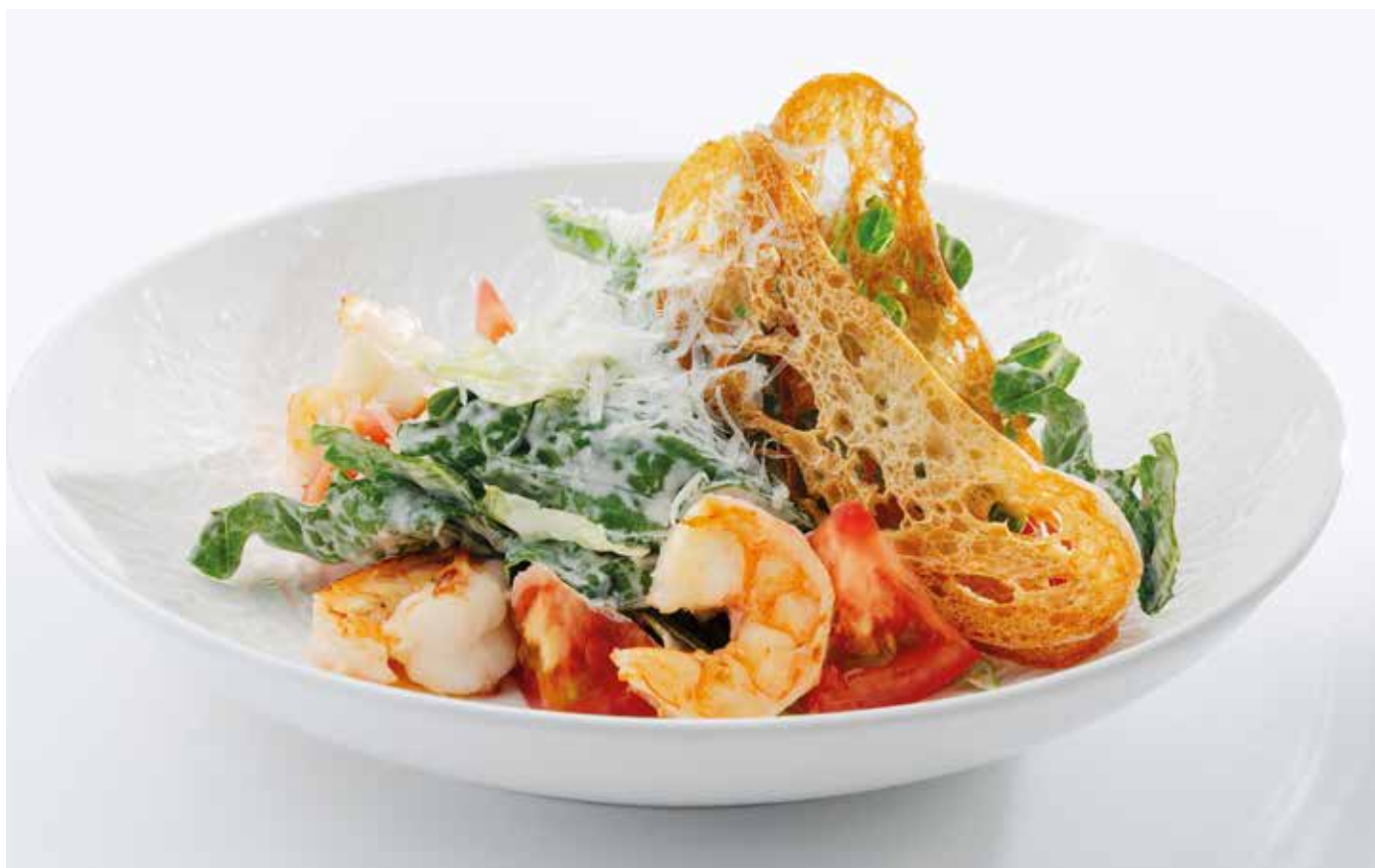
Цезарь с тигровыми креветками