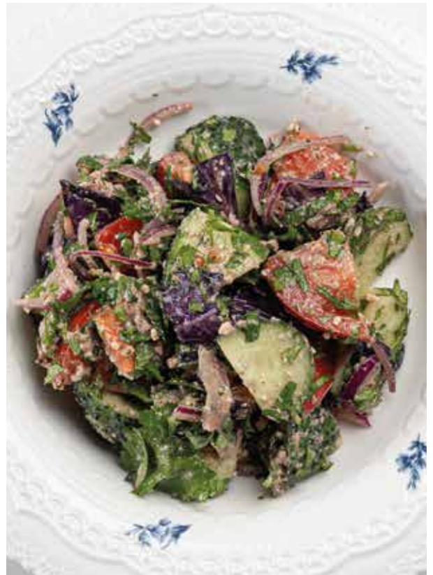
Овощной салат по-грузински с грецкими орехами