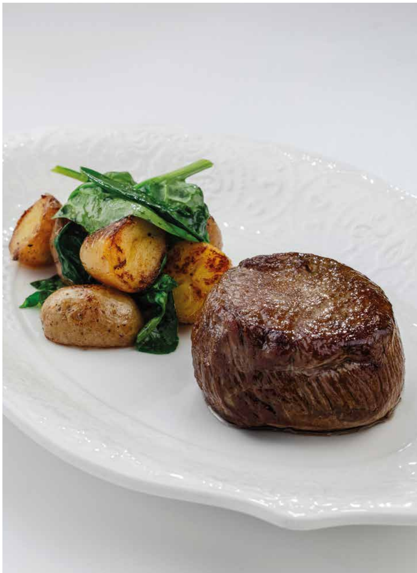
Медальон из брянского бычка с беби-картофелем и соусом демиглас 1390 | 230 гр.