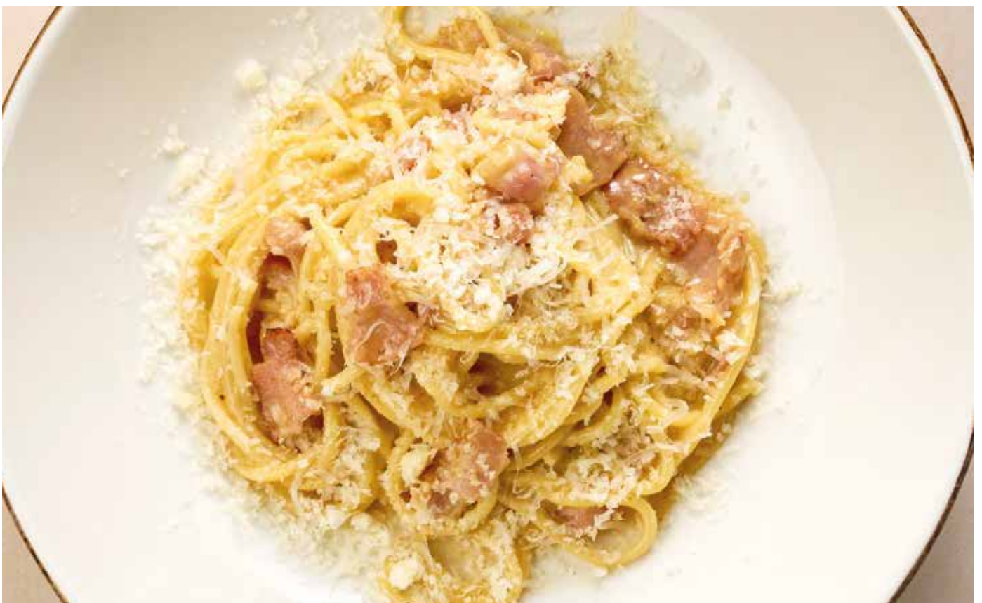
Спагетти Карбонара 660 | 260 гр.