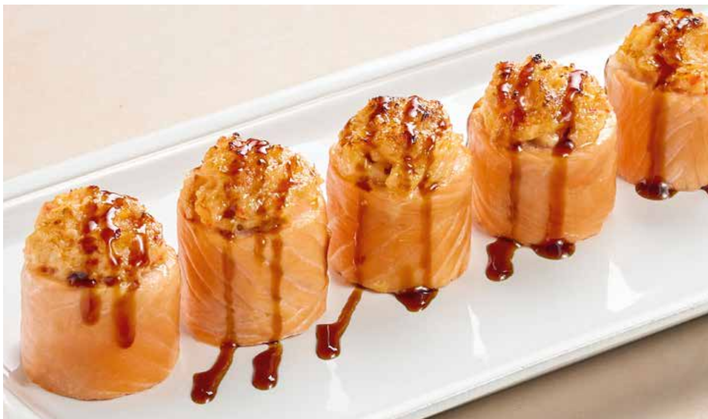
Ролл с лососем и снежным крабом