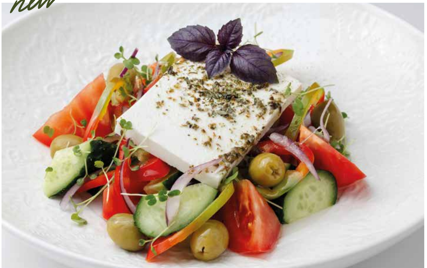
Греческий салат с домашней фетой