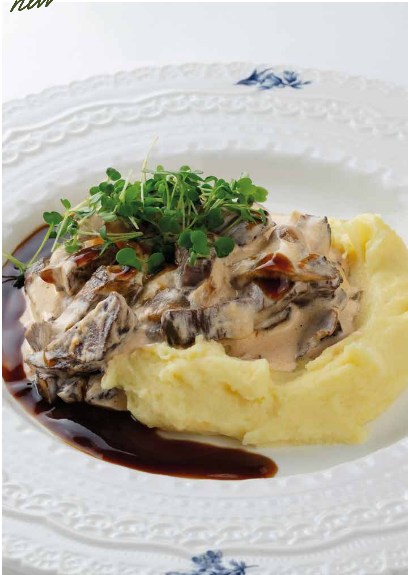
Бефстроганов с картофельным пюре