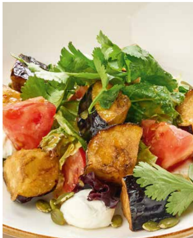
Салат с хрустящими баклажанами

свежие томаты, сыр фета, зелень, тыквенные семечки и горчишно-устричная заправка