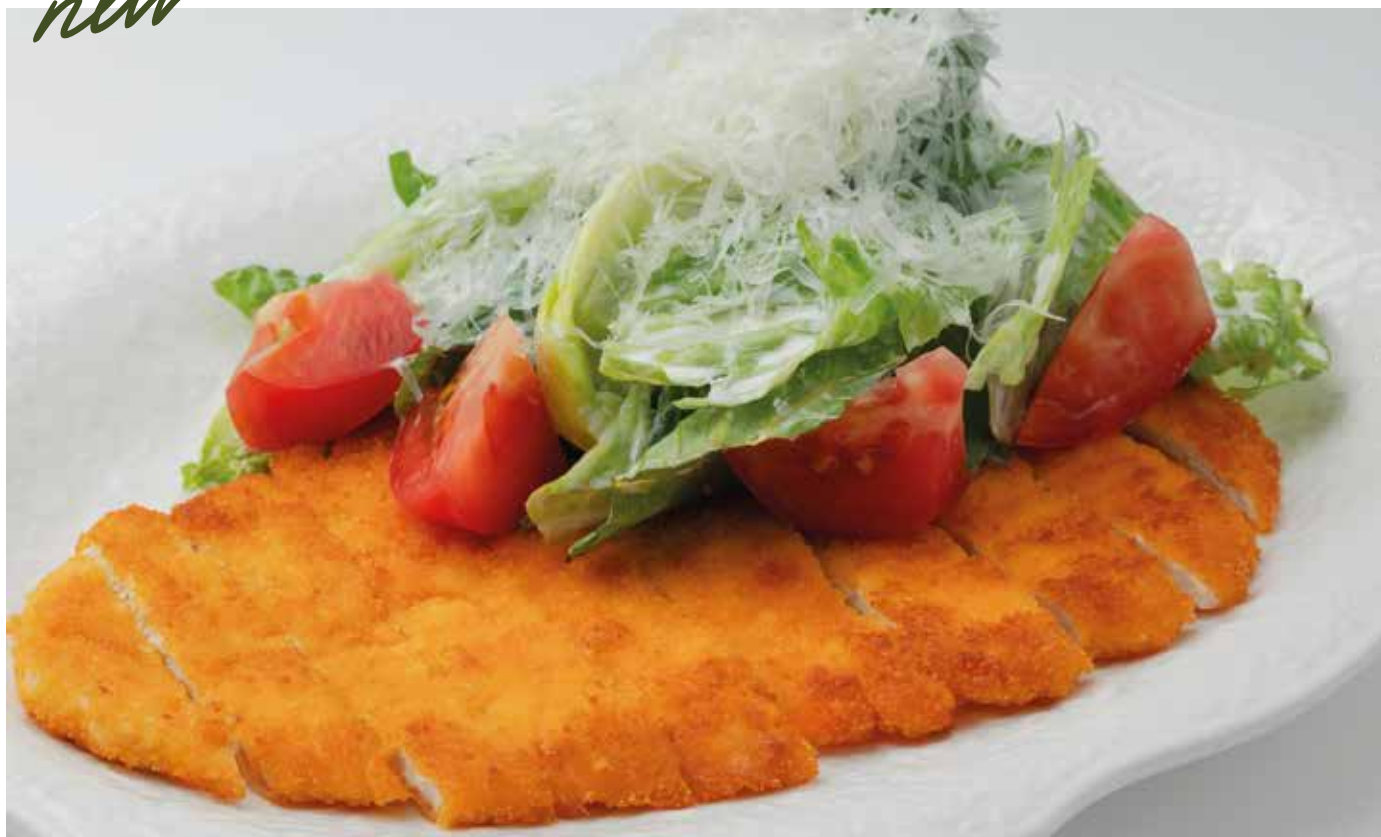
НЕ Цезарь со шницелем из цыплёнка