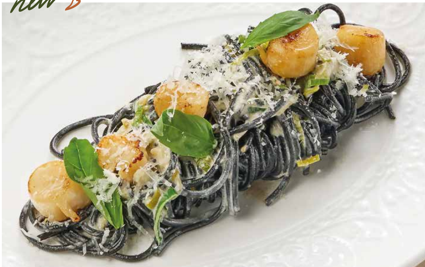
Спагетти Неро с сахалинским гребешком