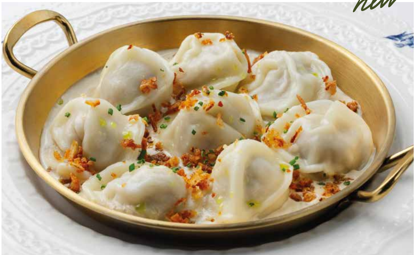
Пельмени с индейкой в сливочно-грибном соусе