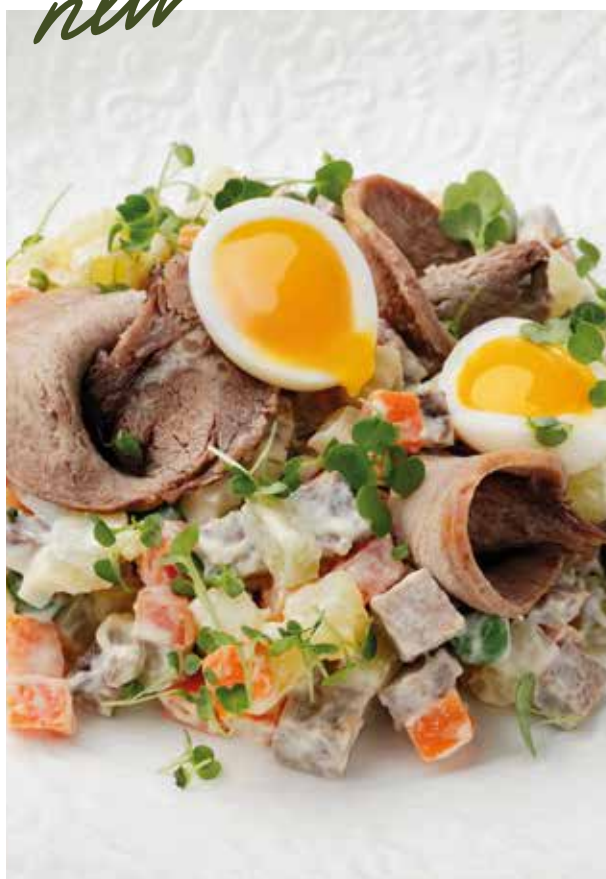
Оливье с языком