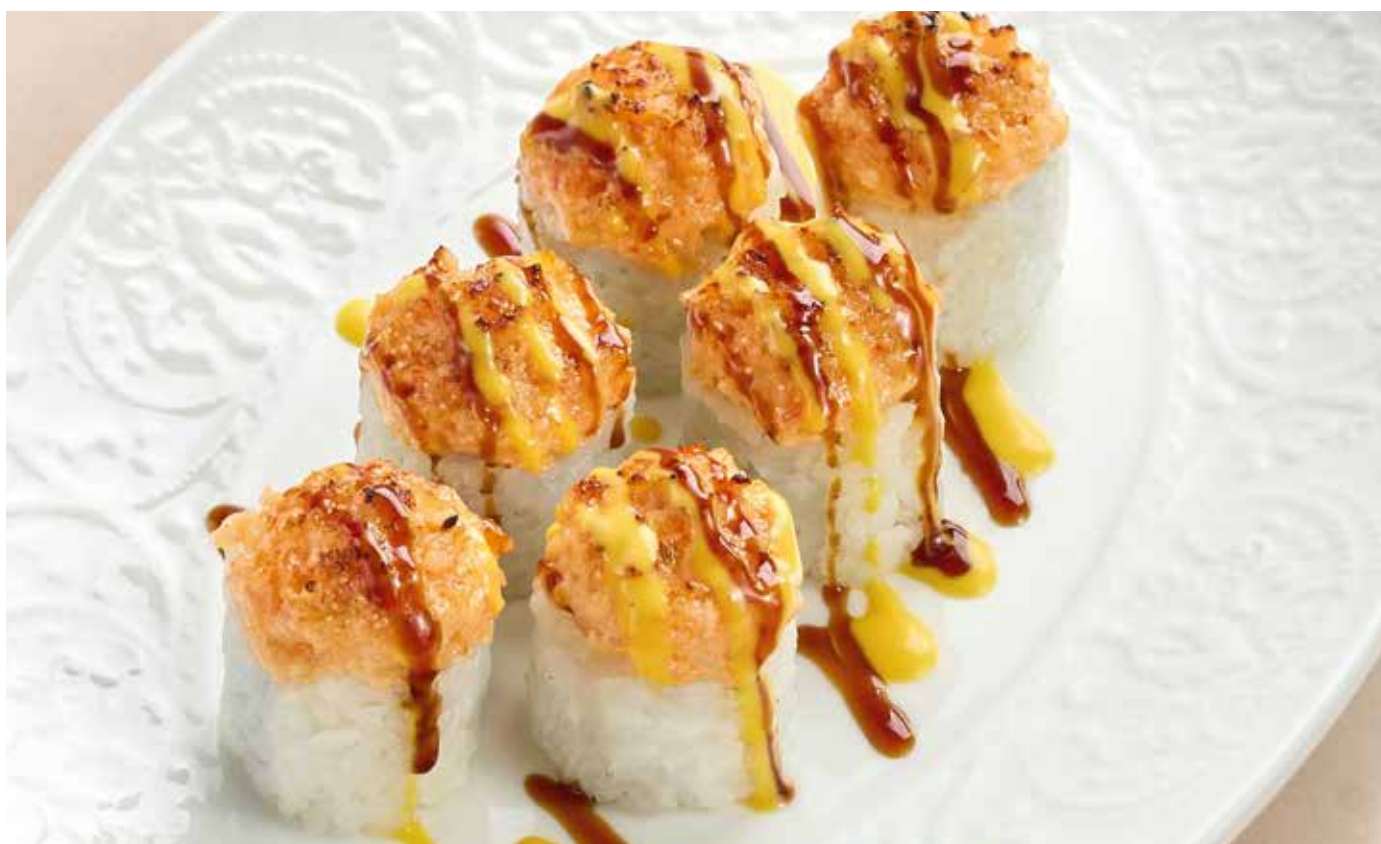
Ролл с острым угрём и снежным крабом