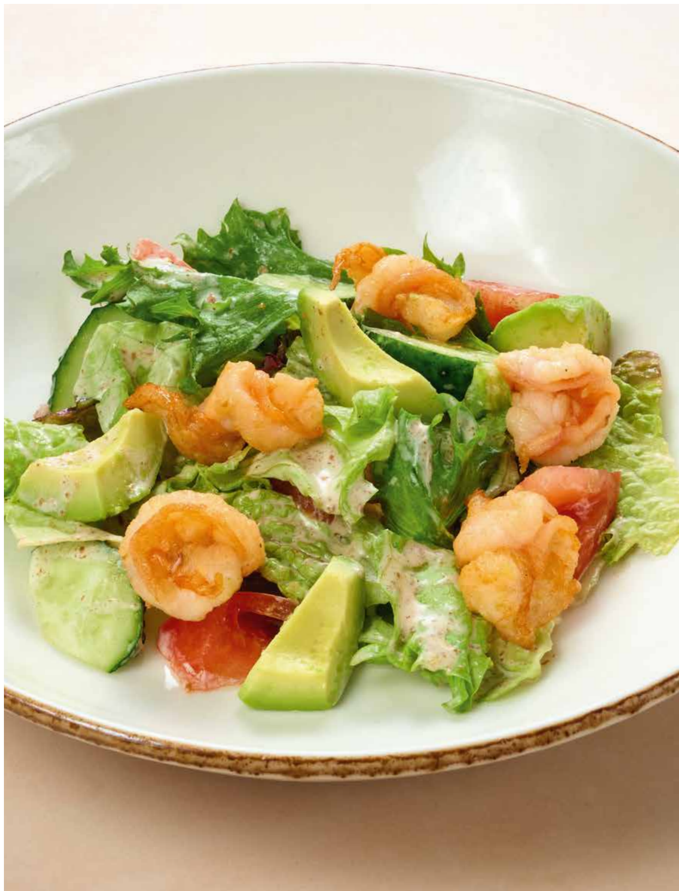
Летний салат с авокадо и креветками