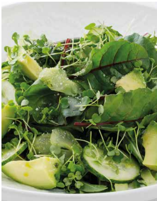
Зелёный салат с лимонно-трюфельной заправкой