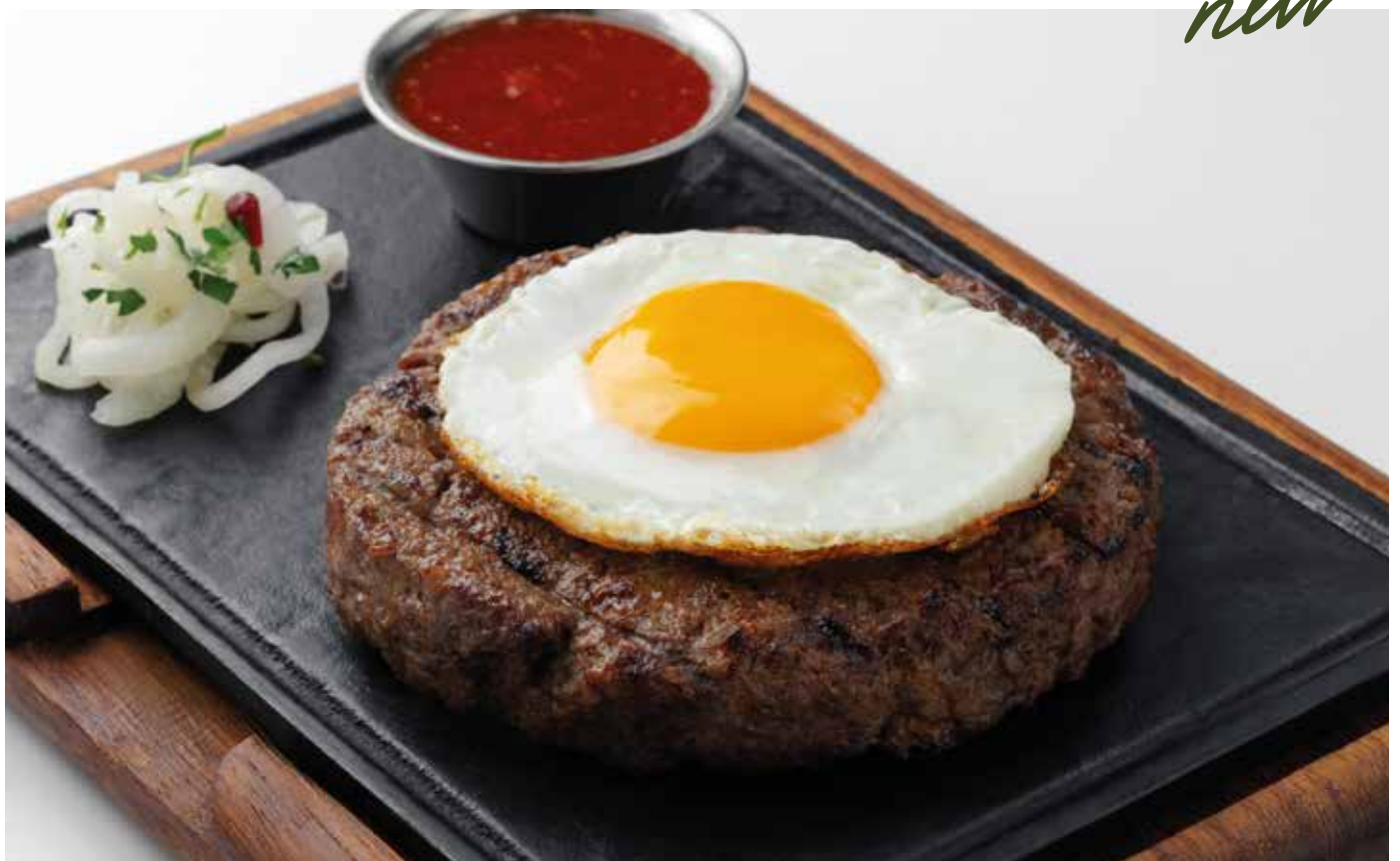
Бифштекс из мраморной говядины 980 | 260 гр.