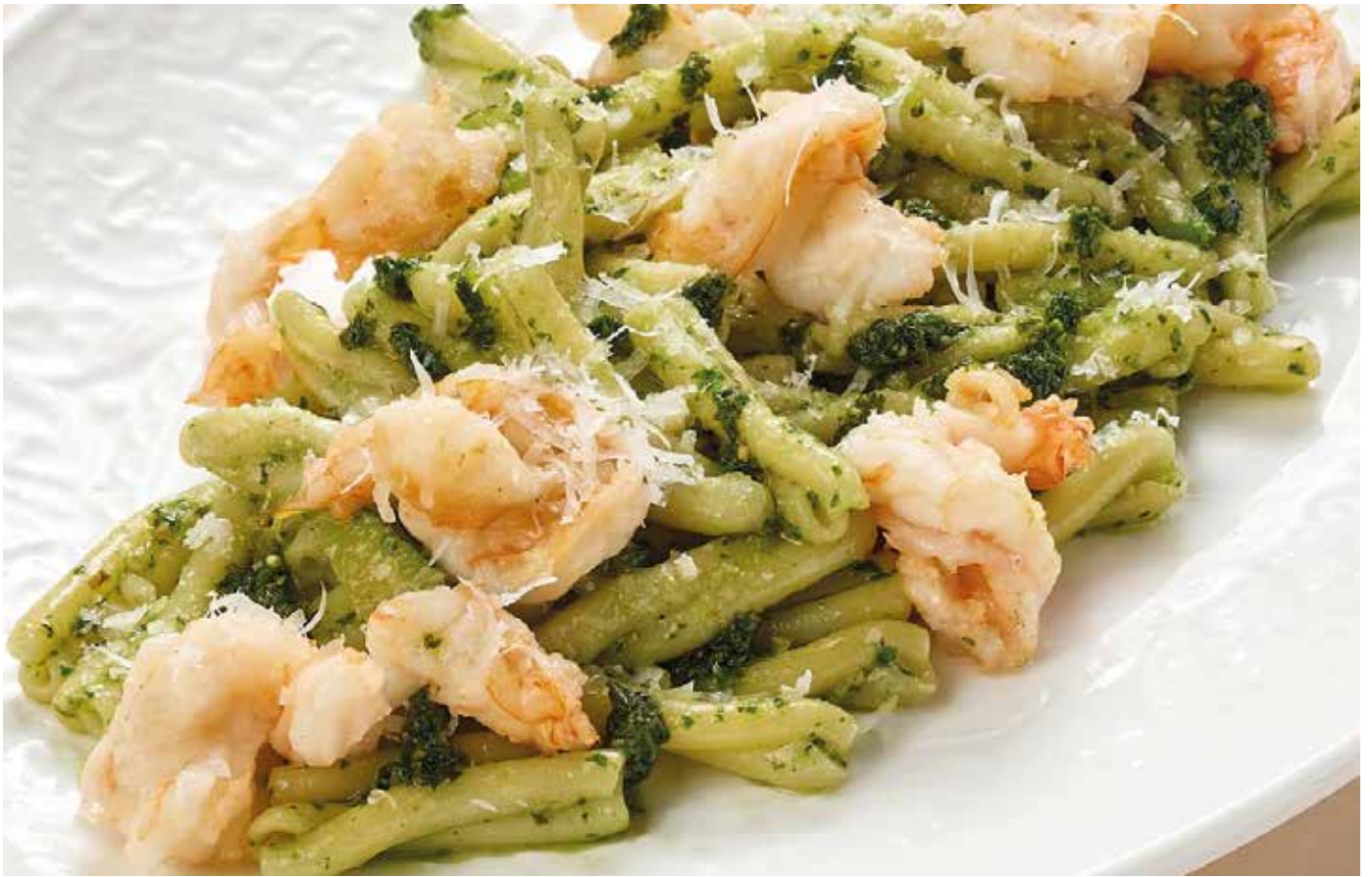
Паста с тигровыми креветками, цукини и соусом песто 760 | 260 гр.