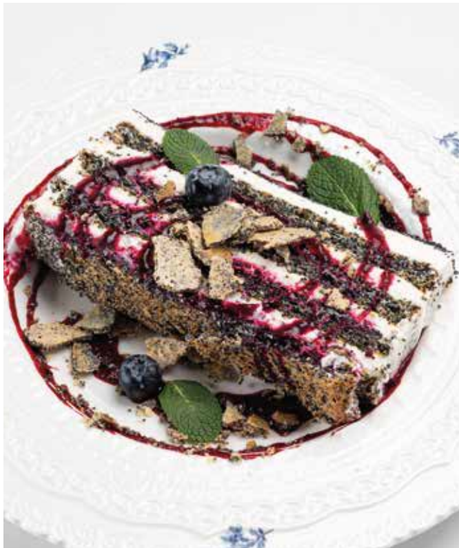
Маковый торт с чёрной смородиной