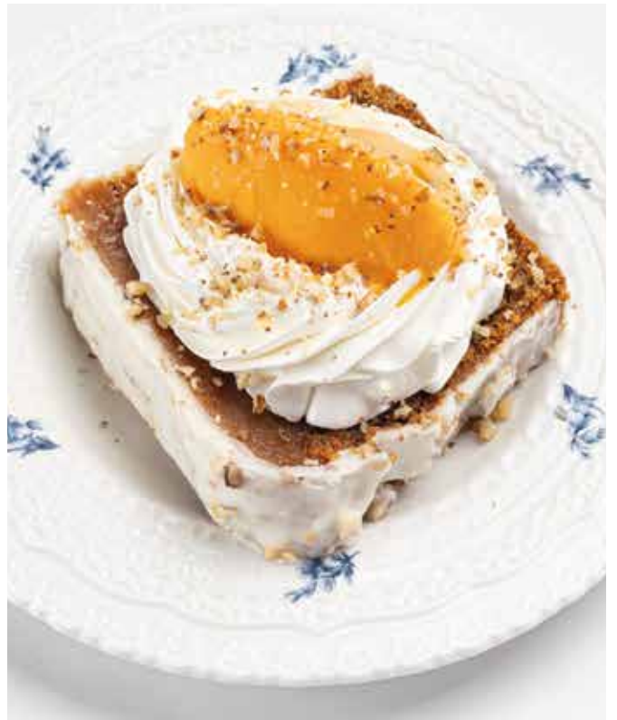
Морковный кекс с карамелью и облепиховым сорбетом