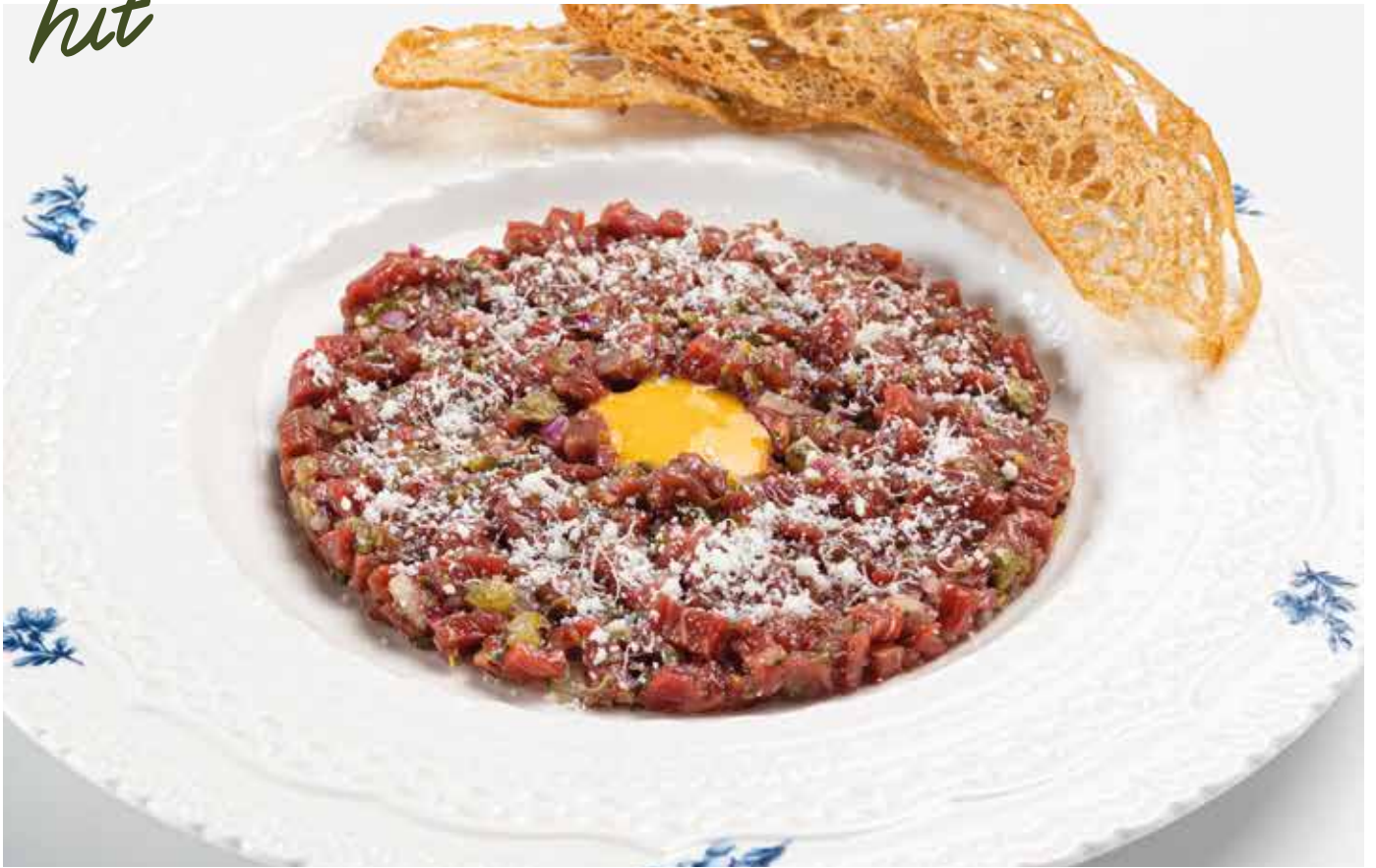
Тартар из говядины с трюфельной заправкой