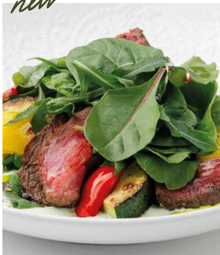
Тёплый салат с ростбифом и овощами на углях