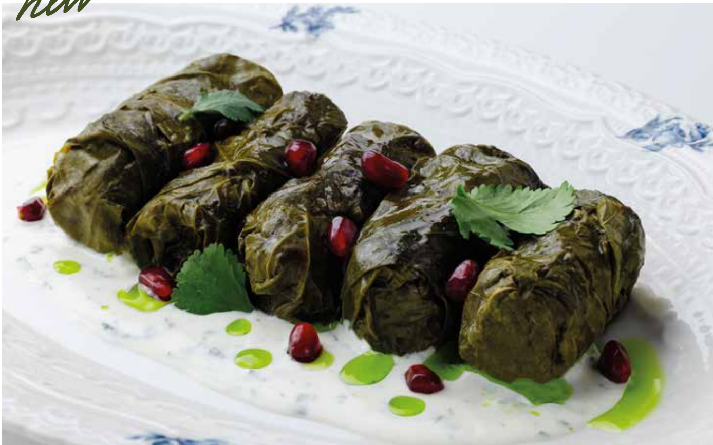
Долма в виноградных листьях