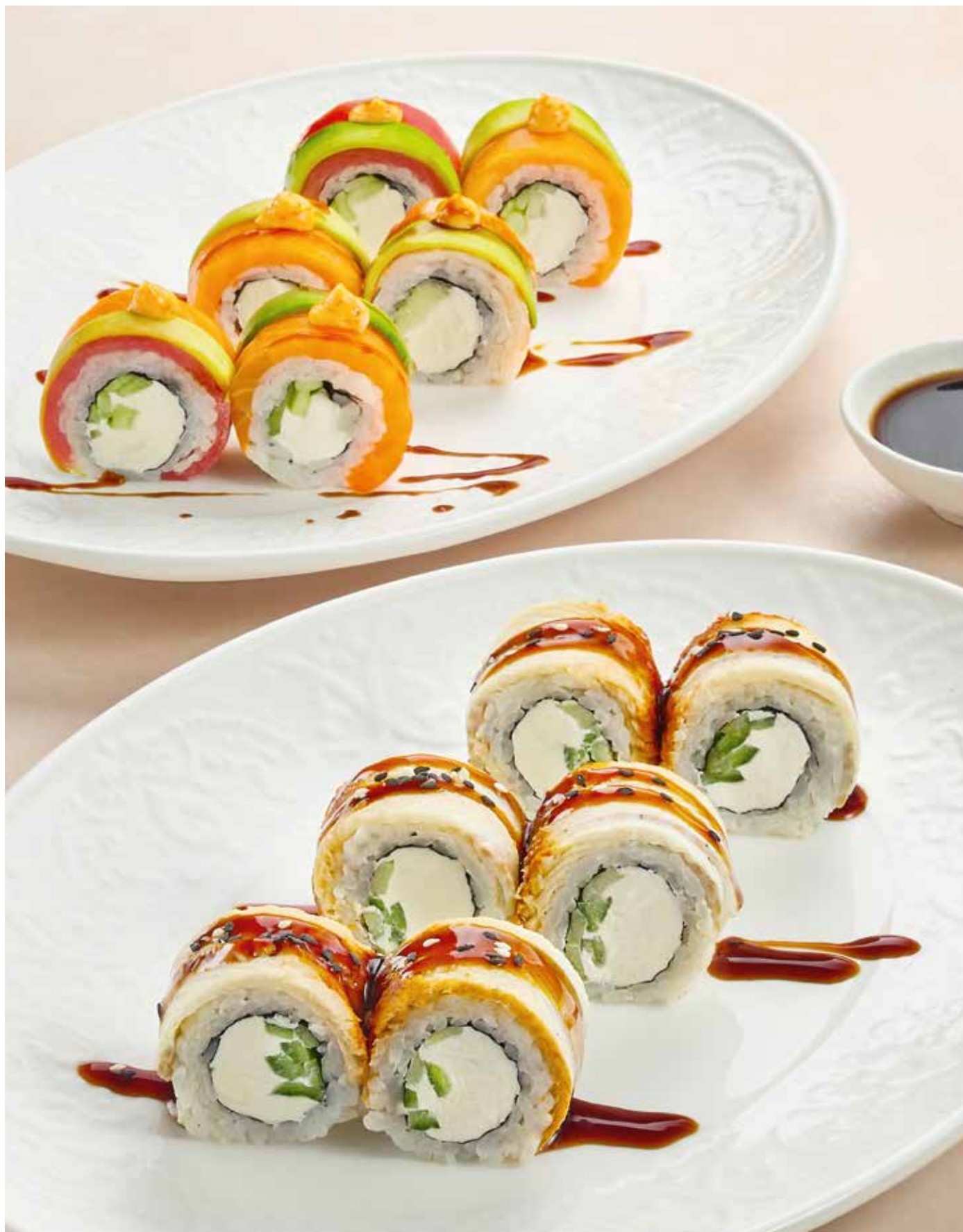
Ролл Трио с лососем, тунцом и креветкой 860 | 225 гр.