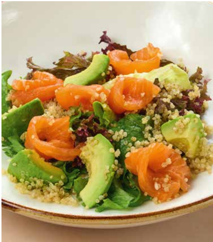
Салат с лососем, авокадо и киноа с горчиной заправкой