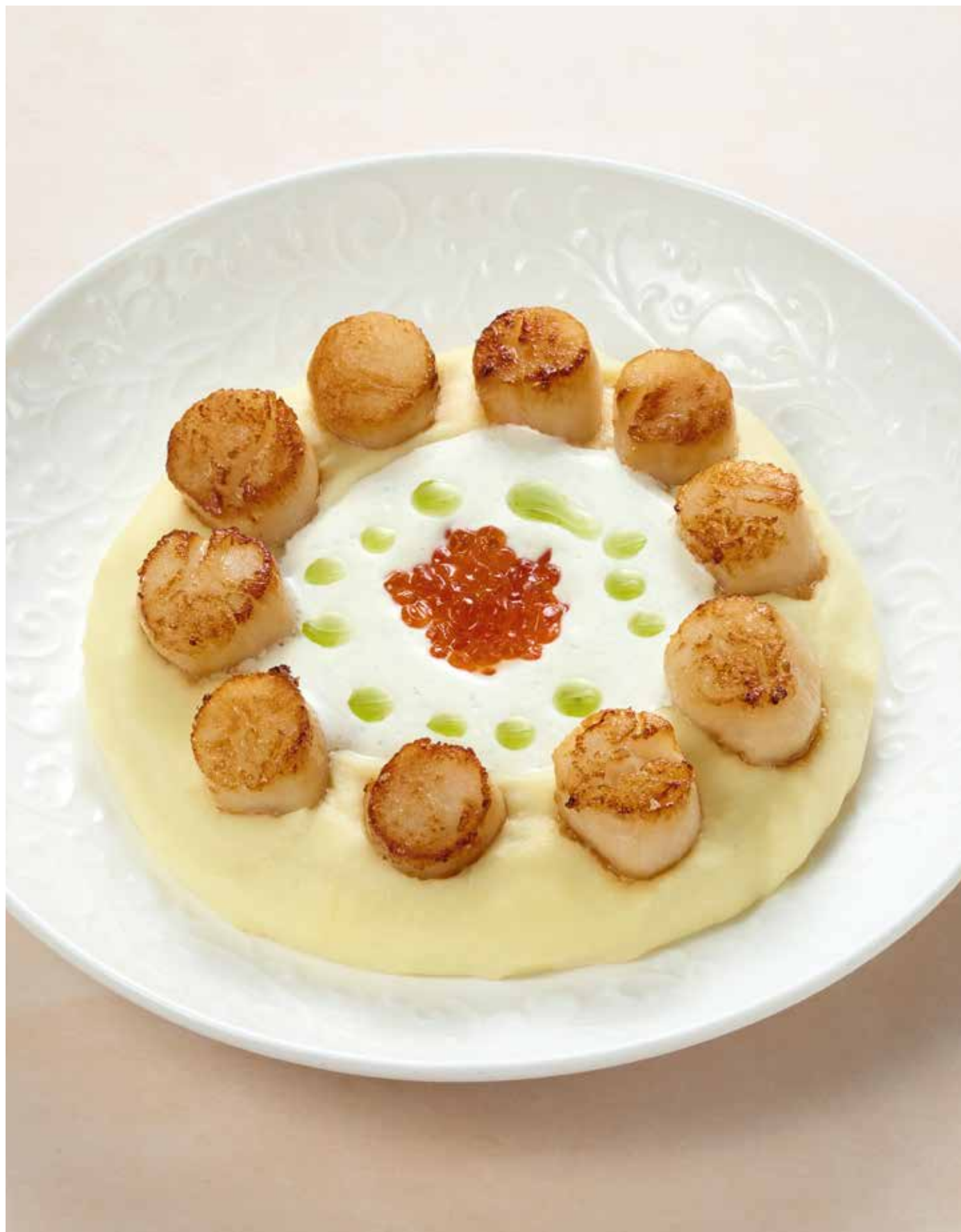
Сахалинские гребешки с красной икрой с картофельным пюре, красной икрой и трюфельным соусом 1190 | 190 гр.