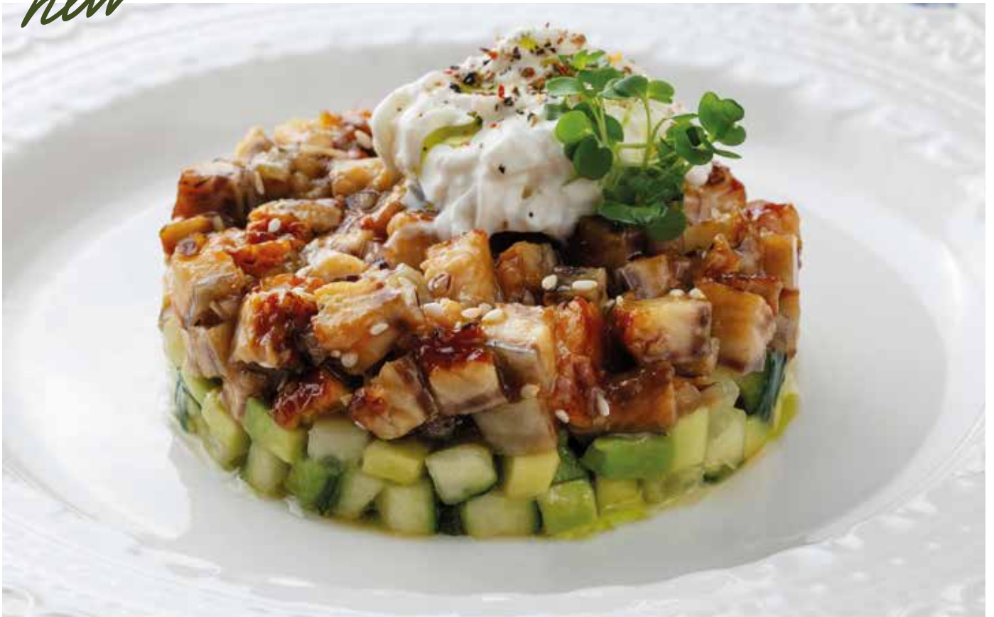
Тартар из угря с авокадо и страчателлой