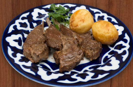
Казан-Кабоб баранина на косточке, обжаренная в казане с картофелем 150/100 г 900 ₺