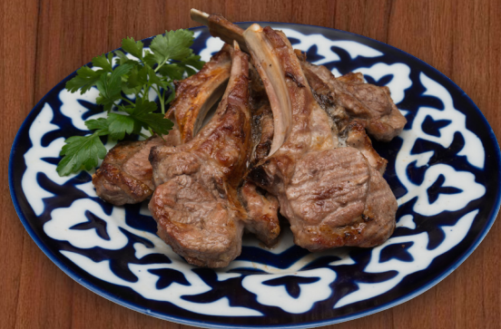
Дияр маринованная баранья корейка, обжаренная на углях 250 г 1800 ₺