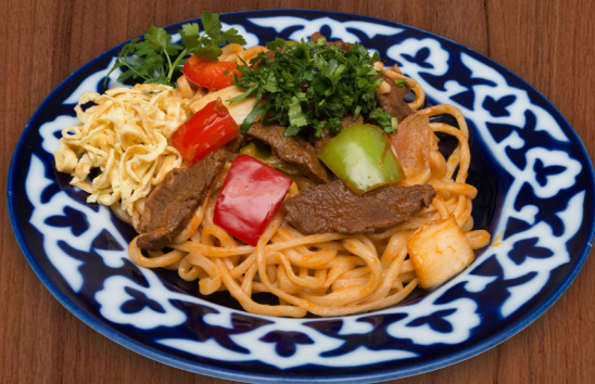
Ковурма Лагман домашняя лапша, обжаренная с соусом «Ва-Джу» 250 г 560 ₺