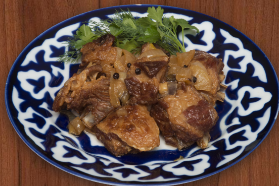
Жаз бараньи ребрышки с луком, тушеные по домашнему в казане 250 г 900 ₺