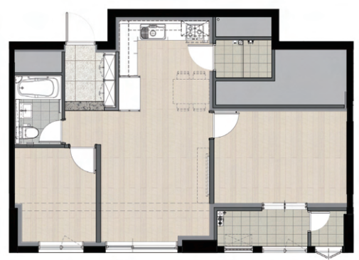
대표 주택형(49A Type)의 평면도

※ 상기 조감도, 단지 배치도, 세대평면도는 개략적인 설계 내용을 보여주기 위한 도면이며, 추후 사업 진행에 따라 변경될 수 있습니다.