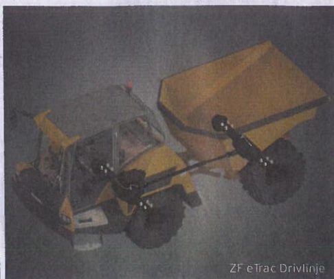
ZF eTrac Drivlinje

Hydrema AS Energiveien 7, Bergermoen N-3520 Jevnaker