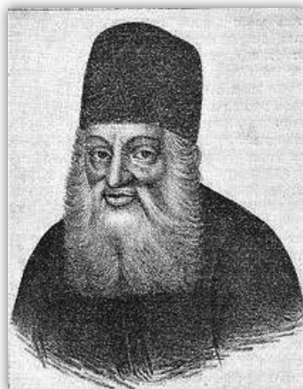
ציור המיוחס לרבי יהונתן אייבשיץ

בשנה הראשונה לכהונתו של רבי יהונתן כרב באלטונה, פרצה באזור מגיפה שפגעה בתינוקות וביולדות. בהיותו מפורסם כמקובל וכ"עושה נפלאות", פנו יהודים רבים אל רבי יהונתן בבקשת עזרה. רבי יהונתן החל לחלק קמיעות שהיו הנשים בהריון נושאות עמן ועונדות על צווארון. באחד הימים הובאה לתשומת ליבו של רבי יעקב אחת הקמיעות שנאמר לו כי כתב אותה רבי יהונתן (אם היה זה קמיע שאכן נכתבה על ידי רבי יהונתן או זיוף מכוון, עוד אינן לדבר הכרע בידי החוקרים 1 ). רבי יעקב פענח