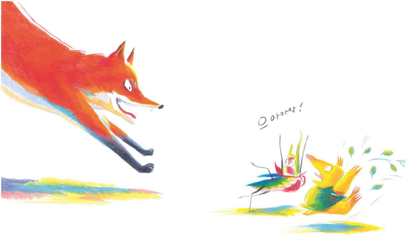
커다란 여우가 눈을 부라리고 이빨을 드러내며 사납게 달려들지 뭐야!

예: 두더지가 땅 아래로 굴을 파서 들어가고 뒤따라 사슴벌레도 굴속으로 들어가요. 두더지는 땅에 굴을 파서 들어가고 사슴벌레는 빨간 두꺼비 위에 올라타서 달아나요. 두더지는 땅 아래로 굴을 파서 들어가고 사슴벌레는 하늘을 날아서 여우의 공격을 피해요.